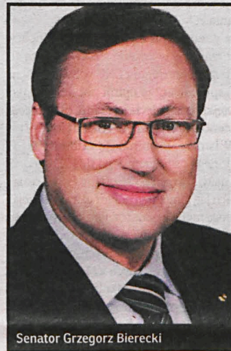
Senator Grzegorz Bierecki