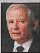
JAROSŁAW KACZYŃSKI, PREZES PiS „PRÓBA ZASTRASZENIA”

To, co w tej chwili jest robione, to nic innego, jak próba zastraszenia polskich rolników, żeby nie kupowali polskiej ziemi. Żeby polska ziemia była dla cudzoziemców. Pytanie kto doprowadził do tego, że w tej akcji bierze udział prokuratura i policja? Dlaczego mamy do czynienia z sytuacją, kiedy ludzie, którzy przystawiali broń do głowy, żeby wymuszać sprzedaż gospodarstw rolnych są na wolności, a rolnicy którzy walczyli o polską ziemię, znajdują się w więzieniu? Czy Polska jest państwem praworządnym, skoro te akcje mogą mieć miejsce?