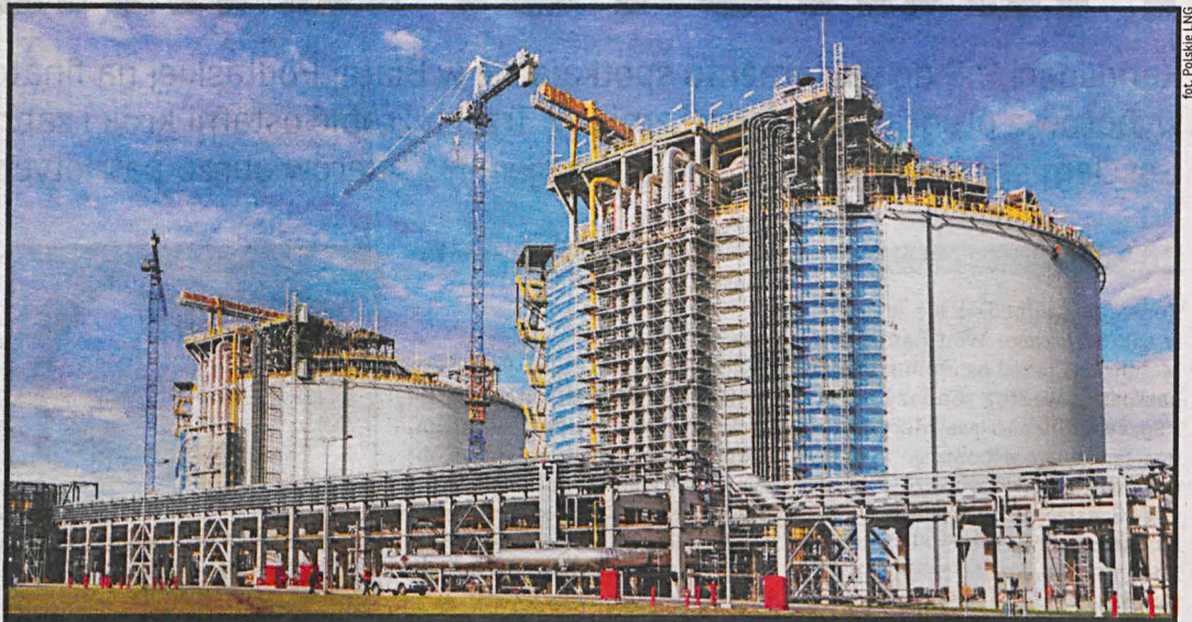
Terminal do odbioru skroplonego gazu ziemnego (LNG) to jedna z największych polskich inwestycji ostatnich lat. Umożliwi odbiór gazu ziemnego drogą morską praktycznie z każdego kraju świata

systemów gazoportu planowane jest dopiero na grudzień 2015 r., więc nie ma mowy o tym, że obiekt jest gotowy. Termin grudniowy jest zresztą efektem sprawdzenia stanu obiektu, jaki wykonał dostawca gazu z Kataru. Znamienne jest, że Katarczyści sami wymogli na stronie polskiej opóźnienia i rezygnację z wcześniejszego październikowo-listopadowego terminu.