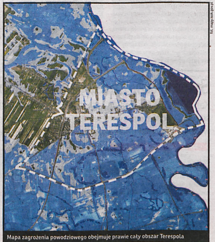
Mapa zagrożenia powodziowego obejmuje prawie cały obszar Terespoła