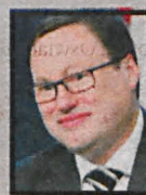
SENATOR GRZEGORZ BIERECKI „HAŃBA DLA KOALICJI PO-PSL”

To, co w tej chwili jest robione, to nic innego, jak próba zastraszenia polskich rolników, żeby nie kupowali polskiej ziemi. Żeby polska ziemia była dla cudzoziemców. Pytanie kto doprowadził do tego, że w tej akcji bierze udział prokuratura i policja? Dlaczego mamy do czynienia z sytuacją, kiedy ludzie, którzy przystawiali broń do głowy, żeby wymuszać sprzedaż gospodarstw rolnych są na wolności, a rolnicy którzy walczyli o polską ziemię, znajdują się w więzieniu? Czy Polska jest państwem praworządnym, skoro te akcje mogą mieć miejsce?