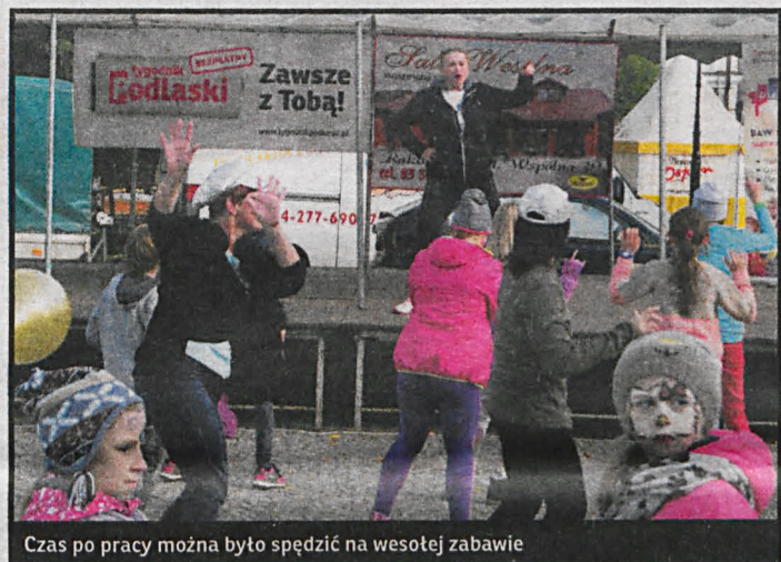
Czas po pracy można było spędzić na wesołej zabawie