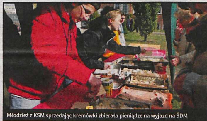
Młodzież z KSM sprzedając kremówki zbierała pieniądze na wyjazd na ŚDM