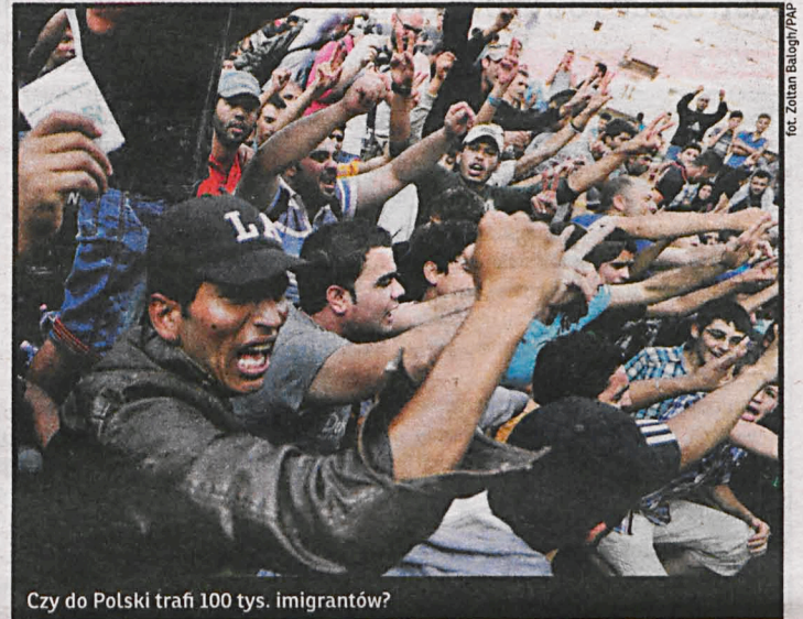
Czy do Polski trafi 100 tys. imigrantów?

Funduje nam bombę z opóźnionym zapłonem, czego dowodem jest sytuacja w Białej Podlaskiej i w całym naszym regionie. Czas to przerwać, jestem przekonany, że nowy rząd uporządkuje ten chaos i zapewni Polakom bezpieczeństwo – mówi Bierecki.