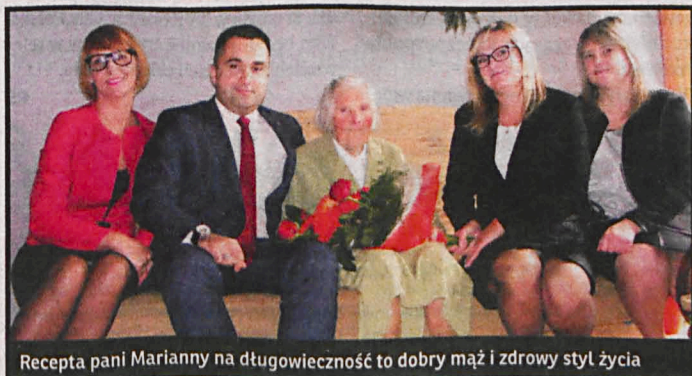
Recepta pani Marianny na długowieczność to dobry mąż i zdrowy styl życia

Galeria ES (ul. Warszawska 37) zaprasza na wernisaż poplenerowej wystawy XV Pleneru Malarskiego, który rozpocznie się w sobotę 17 października o godz. 17. Wystawę oglądać można do 21 listopada br.