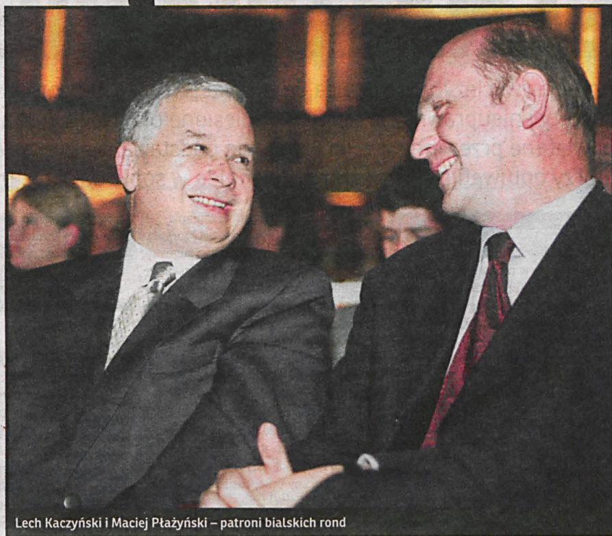
Lech Kaczyński i Maciej Płażyński – patroni białskich rond