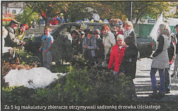
Za 5 kg makulatury zbieracze otrzymywali sadzonkę drzewka liściastego

Największym jednak sukcesem tej i wcześniejszych akcji „Tygodnika Podlaskiego” jest kształtowanie obywatelskich postaw już od najmłodszych lat. Polskie lasy – kto-