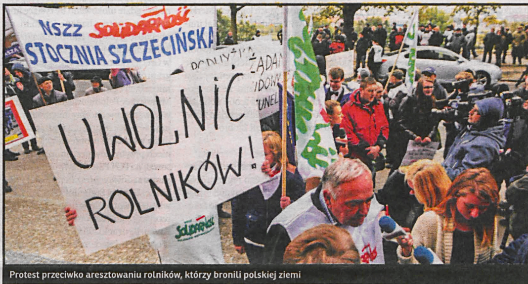
Protest przeciwko aresztowaniu rolników, którzy bronili polskiej ziemi