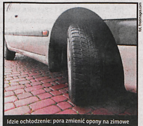
Idzie ochłodzenie: pora zmienić opony na zimowe

Od tego jak przygotowujemy opony (nie tylko zimą) zależy nasze bezpieczne dotarcie do celu. W 2012 roku zły stan techniczny pojazdów był przyczyną 55 wypadków drogowych, zginęło w nich 6 osób, a rany odniosło 66. Braki w ogumieniu stanowiły ponad 21% w tej kategorii przyczyn. W roku 2013 liczba wypadków zmniejszyła się do 53, w których zginęło 6 osób, a 63 osoby zostały ranne. Niestety, aż 30% z nich spowodowane były brakami w ogumieniu. Rok 2014 to kolejny spadek ilości wypadków (do 44). Śmierć poniosło 5 osób, a rany odniosło 59. Zły stan ogumienia był przyczyną 17% wszystkich wypadków związanych z niesprawnością techniczną