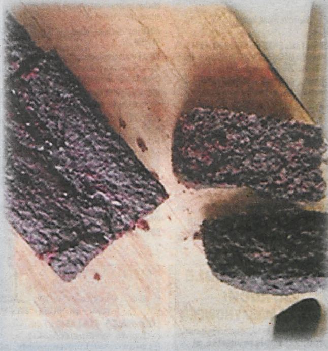
Tekst i foto: Małgorzata Tymoszuk

Wszystkie składniki przekładamy do miski i blendujemy na gładką masę. I już! To prawie wszystko. W formę (około 18 x 20 cm), wyłożoną papierem do pieczenia wykładamy naszą masę i pieczemy w temperaturze 180°C przez ok. 40 – 45 minut. Przed końcem pieczenia zastosujemy metodę tzw. „suchego patyczka”. Gdy będzie suchy – wyłączamy piekarnik, o ile okaże się mokry, wydłużymy czas pieczenia jeszcze o 5 minut. Ciasto kroimy dopiero po wystygnięciu!