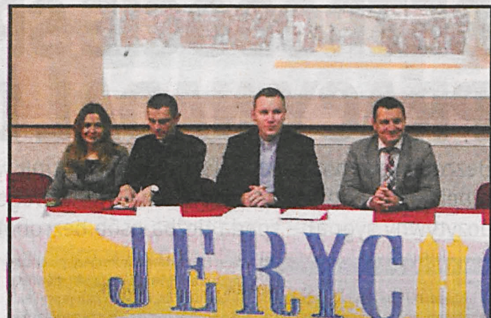
Konferencja Rejonowego Centrum ŚDM „Jerycho” w Parczewie