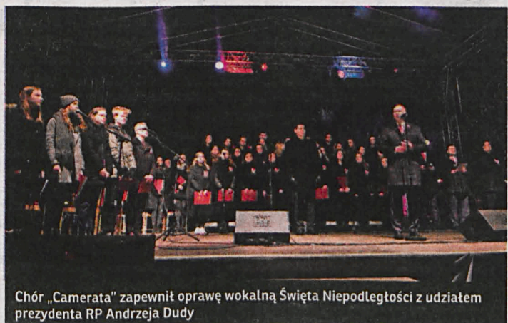
Chór „Camerata” zapewnił oprawę wokalną Święta Niepodległości z udziałem prezydenta RP Andrzeja Dudy