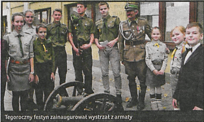
Tegoroczny festyn zainaugurował wystrzał z armaty