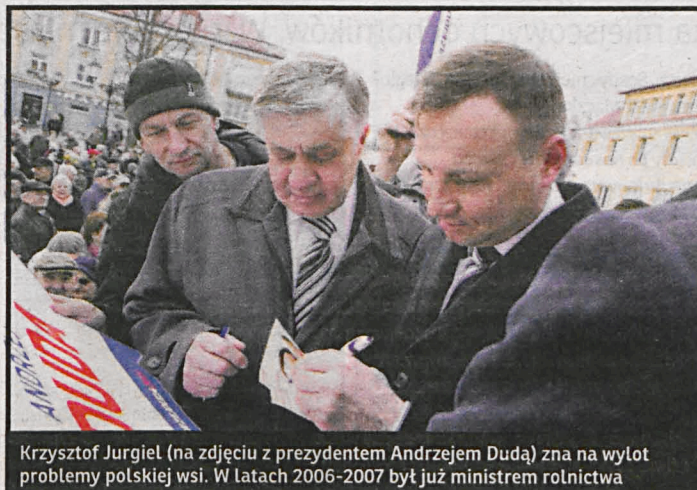
Krzysztof Jurgiel (na zdjęciu z prezydentem Andrzejem Dudą) zna na wylot problemy polskiej wsi. W latach 2006-2007 był już ministrem rolnictwa

Przez cały rok z cenami skupu świń było kiepsko, ale to co się dzieje od końca października to to już nie jest katastrofa, to tragedia! Ceny żywca wieprzowego spadały co tydzień o 10 groszy, tuczników zaś – aż o 20 gr. A przecież to połowa listopada, rusza sezon na mięso przed nadchodzącymi „źniwami”, czyli okresem Bożego Narodzenia. Tymczasem kilogram świni w skupie na Podlasiu po 3,30-3,40 zł! Portal farmer.pl informuje, że w skupach w kraju padają kolejne „rekordy” – za żywiec płaci się już tylko 3,10 zł za kilogram, inne zakłady za tuczniki w klasie E proponują rolnikom – uwaga! – 4,60 zł/kg netto! Do „Tygodnika Podlaskiego” docierają sygnały, że mimo niskich cen na Południowym Podlasiu, ubojnie mają jednak bardzo dużo pracy. To tylko pozorny paradoks. Pod nóż idą maciory rolników