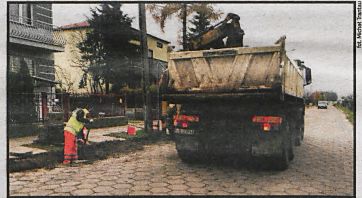
Na starą i wystuzoną trylinkę ul. Sworskiej zostanie położony asfalt

Budowa dróg oraz remont istniejących to priorytet nie tylko dla ich mieszkańców, ale i dla władarzy Białej Podlaskiej. W minionym roku oddano do użytku węzeł komunikacyjny przy ul. Lubelskiej, nowe nawierzchnie uzyskały Droga Wojskowa i ul. Topolowa, rozpoczęto prace remontowe na ul. Kruczej oraz Langiewicza. Zainstalowano również sygnalizację świetlną na skrzyżowaniu ul. Francuskiej z krajową „dwójką”. W czerwcu br. nową nawierzchnię uzyska ul. Górna. Wkrótce rozpocznie się realizacja pierwszego etapu budowy ul. Armii Krajowej, a już w połowie grudnia br. nową nawierzchnię zyska ul. Sworska. Wykonawcą inwestycji jest białaska firma Transbet, która zaoferowała najniższą cenę – ok. 330 tys. zł.