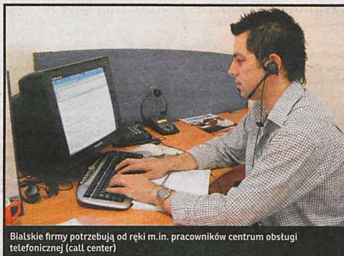
Bialskie firmy potrzebują od ręki m.in. pracowników centrum obsługi telefonicznej (call center)

– W naszym regionie są najczęściej poszukiwani pracownicy w handlu, usługach i kierowcy. Pracodawcy, aby nie być monotematyczni, zawód sprzedawcy nazywają doradcą klienta, specjalistą ds. handlu, opiekunem klienta. Ale ciągle chodzi o to samo: żebyś ktoś sprzedawał, a raczej potrafił ludziom wmówić,