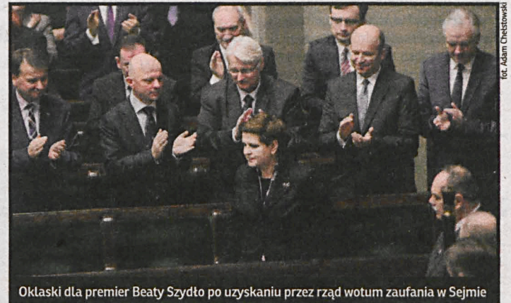
Oklaski dla premier Beaty Szydło po uzyskaniu przez rząd wotum zaufania w Sejmie

– Trzeba na końcu kadencji powiedzieć, jaki stan państwa zostawia się Polakom. My taki audyt przeprowadzimy. Powiemy Polakom, jaka jest sytuacja polskiego państwa. To kwestia uczciwości