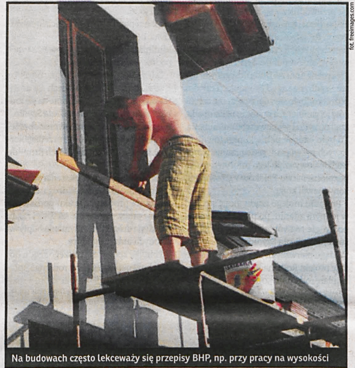
Na budowach często lekceważą się przepisy BHP, np. przy pracy na wysokości

Lista zaniedbań jest imponująca: nieprawiłowości w zakresie montażu ruszto-