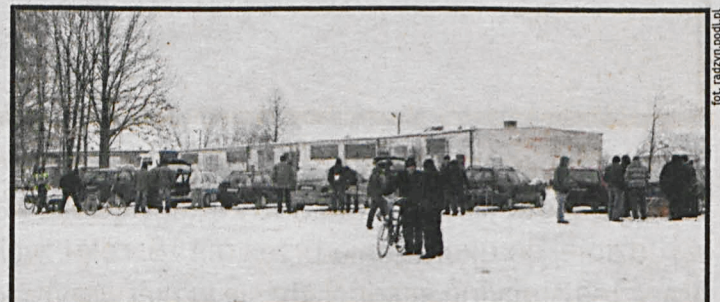
Zima nie sprzyja handlowi na powietrzu, ale pojawiły się już pierwsze stoiska

20 stycznia otwarte zostało w Radzynie Podlaskim targowisko zwierząt. Choć pogoda nie sprzyja handlowi na świeżym powietrzu, pojawili się pierwsi oferenci, nie tylko z Radzyna Podlaskiego, ale również z Łukowa, Parczewa czy Lubartowa z gołębiami i królikami. Handel dużymi zwierzętami w tym miejscu będzie możliwy, gdy wyznaczone zostaną odpowiednie sektory, wybudowane kojce i zamontowane specjalistyczne urządzenia.