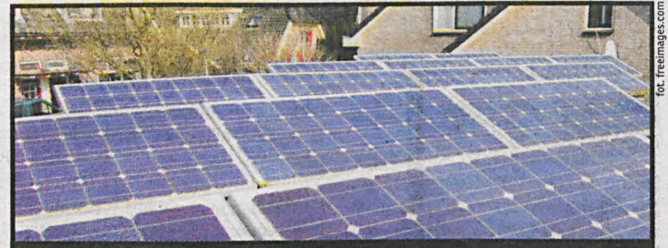
Właściciel nieruchomości pokryje tylko jedną dziesiątą kosztów instalacji solarnej

Bliższe informacje oraz druki deklaracji znajdują się na stronie www.radzyn-podl.pl , można je również otrzymać w Urzędzie Miasta (pokój nr 120), gdzie też należy składać wypełnione deklaracje.