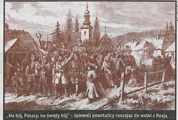
„Na bój, Polacy, na święty bój” – śpiewali powstańcy ruszając do walki z Rosją

Zbiórka uczestników marszu nastąpi na rynku, pod kościołem św. Anny o godz. 16:40, skąd autobus przewiezie ich w miejsce jego rozpoczęcia. Organizatorzy proszą o zabranie ze sobą kamizelek odblaskowych oraz elementów patriotycznych. W programie: przemarsz do Kodnia, msza św. w kaplicy klasztornej, Apel Pamięci przy pomniku, ognisko,