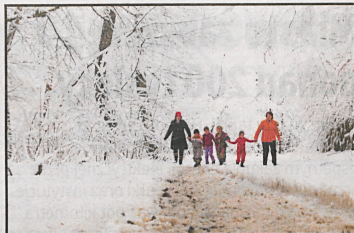
Istotą programu „Rodzina 500 plus” jest wypłata 500 zł miesięcznie na każde drugie i kolejne dzieci w rodzinie, do ukończenia przez nie 18. roku życia

Trzeba będzie złożyć wniosek w gminie osobiście lub przez internet (wzór wnio-