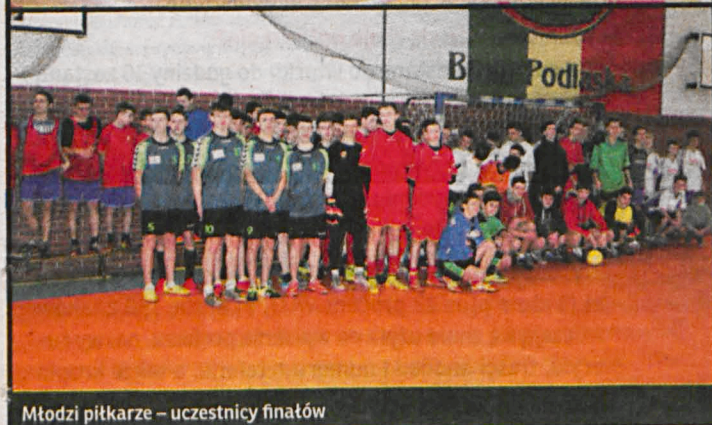
Młodzi piłkarze – uczestnicy finałów