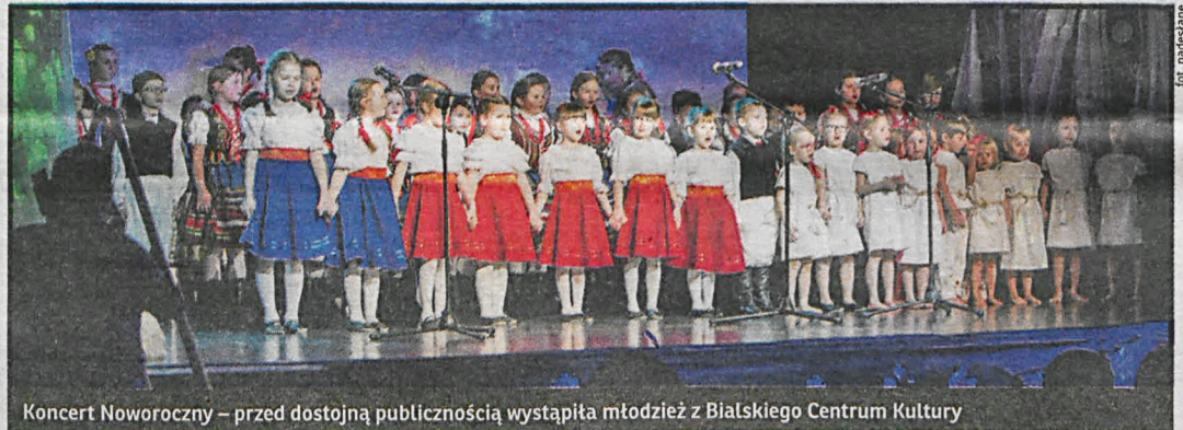
Koncert Noworoczny – przed dostojną publicznością wystąpiła młodzież z Białskiego Centrum Kultury