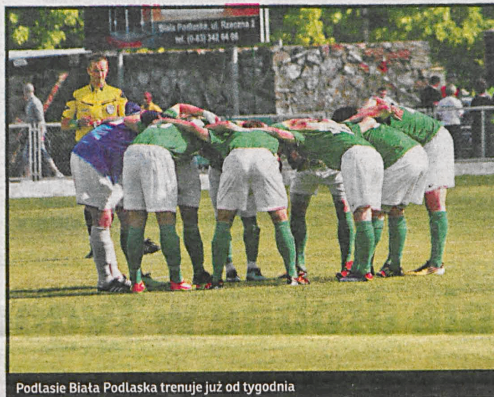
Podlasie Biała Podlaska trenuje już od tygodnia