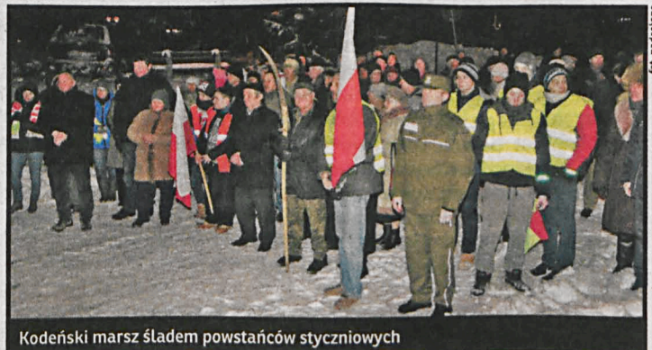
Kodeński marsz śladem powstańców styczniowych

Przy pamiątkowym kamieniu obok kościoła św. Anny zebrani odśpiewali hymn narodowy, w imieniu społeczeństwa Kodnia wieniec na pamiątkowej płycie