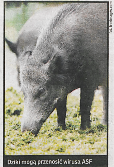
Dziki mogą przenosić wirusa ASF

Projekt rozporządzenia ministra rolnictwa w sprawie zarządzenia odstrzału został skierowany do uzgodnień i konsultacji społecznych, które zakończą się w czwartek 4 lutego 2016 r. Można spodziewać się tu protestów organizacji eko-