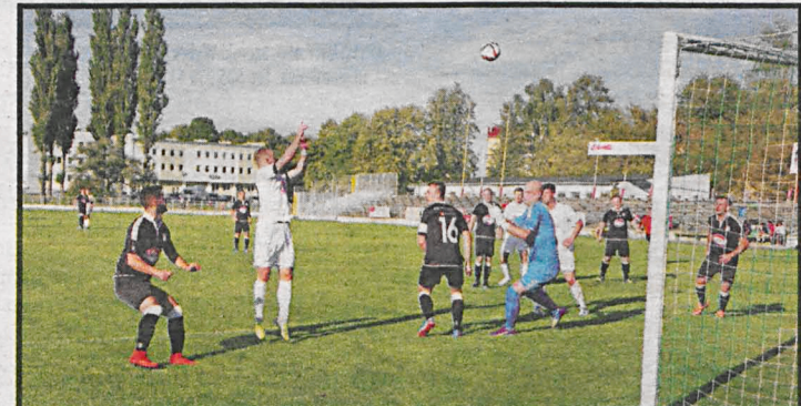
W najbliższy weekend nasi piłkarze zagrają pierwsze sparingi

do jego dyspozycji. Podlasie pracuje na własnych obiektach, a na dniach zajęcia wznowi Lutnia Piszczac.