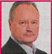
JANUSZ SZEWCZAK Posel PiS