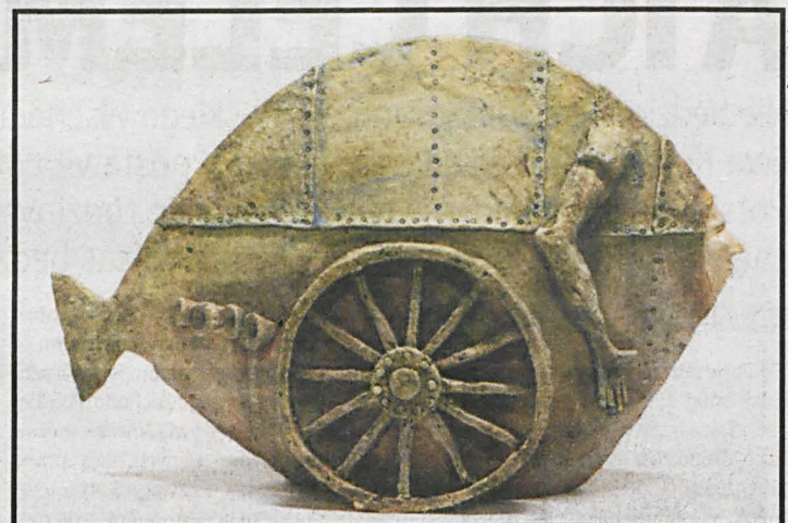
Jedna z prac Artura Szweda; nie przez przypadek nazywa się go „poetą ceramiki”

Swoje gliniane rzeźby Arkadiusz Szwed prezentuje na stronach internetowych. Biorąc pod uwagę ilość osób odwiedzają-