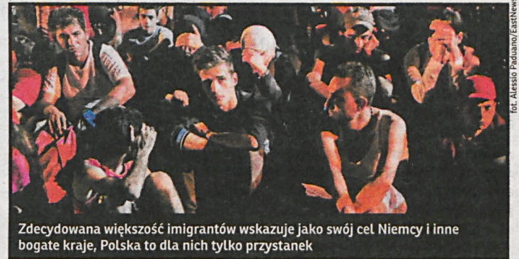
Zdecydowana większość imigrantów wskazuje jako swój cel Niemcy i inne bogate kraje, Polska to dla nich tylko przystanek

– Dla parafian był to wielki szok i smutek. Nawet nie myślałem, że to aż tak głęboko nam wszystkim zapadło w serca. Czuliśmy się trochę oszukani, bo nigdy nie myślałem, że może dojść do takiej sytuacji. Myśmy przecież zaoferowali im pomoc, niczego nie oczekując w zamian. Ale tak po ludzku było nam smutno, że oni byli, że cieszyliśmy się, że możemy im pomóc, że mogliśmy się włą-