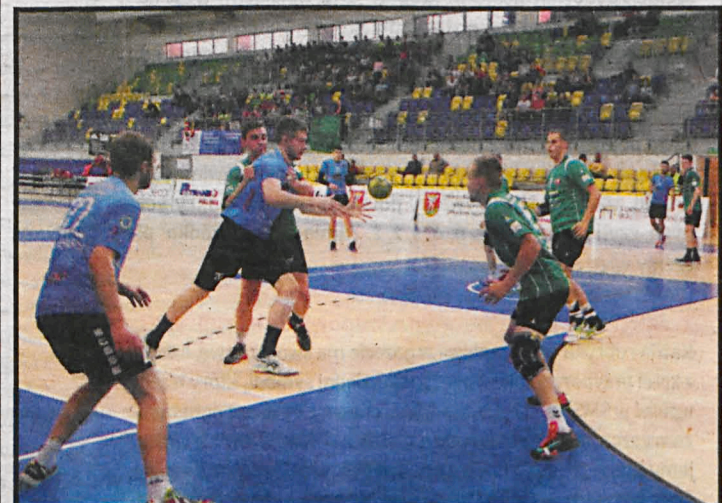
Szczypliwności na razie tylko sparują