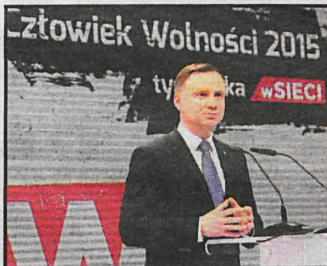
Prezydent Andrzej Duda odebrał nagrodę, przyznaną w plebiscyie przez czytelników tygodnika „wSieci”

Prezydent Andrzej Duda otrzymał nagrodę Człowiek Wolności 2015 tygodnika „wSieci”. Uroczysta gala odbyła się w Warszawie, gromadząc wybitne osobistości ze świata polityki, kultury i gospodarki.