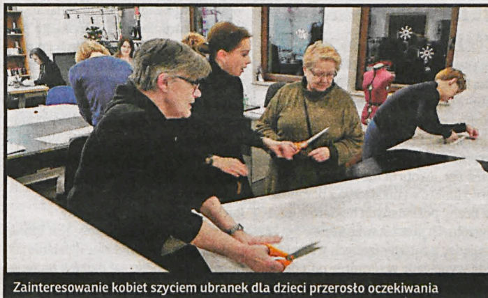
Zainteresowanie kobiet szyciem ubrańek dla dzieci przerodziło się w oczekiwanie