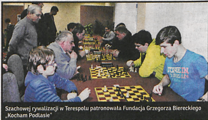
Szachowej rywalizacji w Terespolu patronowała Fundacja Grzegorza Biereckiego „Kocham Podlasie”

Zawodnicy z Węgrowa, Łomaz, Konstancyńowa, Białej Podlaskiej, Międzyrzecza, Grabanowa oraz Terespoła uczestniczyli w turnieju szachowym zorganizowanym pod patronatem senatora Grzegorza Biereckiego.