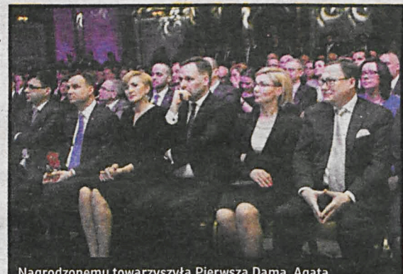
Nagrodzonemu towarzyszyła Pierwsza Dama, Agata Kornhauser-Duda, oraz inni dostojni goście: minister skarbu Dawid Jackiewicz i senator Grzegorz Bierecki