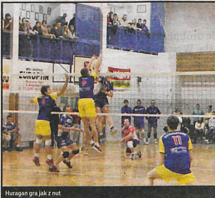
Huragan gra jak z nut