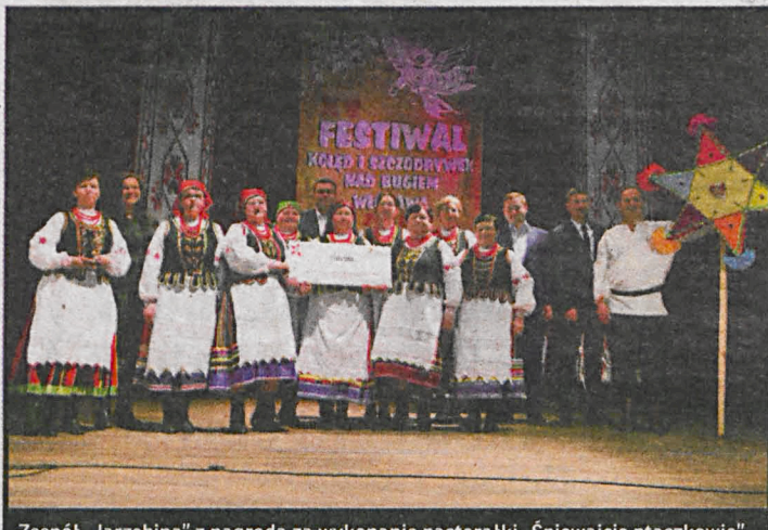
Zespół „Jarzębina” z nagrodą za wykonanie pastorałki „Śpiewajcie ptaszkiwie”