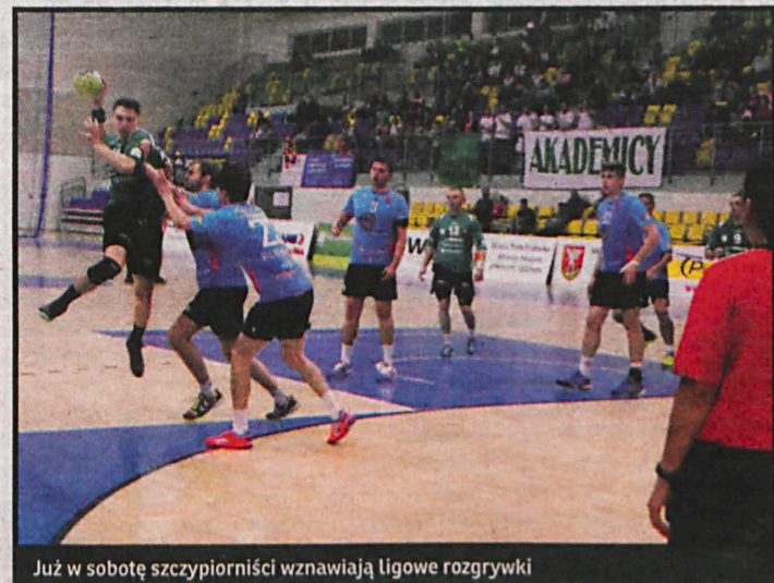
Już w sobotę szczypiorniści wznawiają ligowe rozgrywki