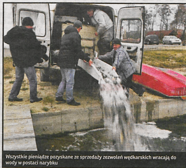
Wszystkie pieniądze pozyskane ze sprzedaży zezwoleń wędkarskich wracają do wody w postaci narybku

ją chronić – podsumowuje prezes. Dzięki ich pracy międzyrzeckie jeziorka stają się znane nie tylko na Podlasiu. W ubiegłorocznym maratonie wędkarskim uczestniczyły m.in. drużyny z Warszawy, Chełma, Bogdanki, Mszczonowa, Rawy Mazowieckiej, Zamostcia. Zwycięski zaś 3-osobowy team