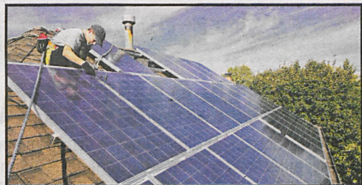
Montaż instalacji w miejscowościach, które otrzymają dofinansowanie będzie mógł rozpocząć się już w przyszłym roku

W miniony wtorek i środę odbyły się w Terespole spotkania informacyjne dla mieszkańców zainteresowanych przystąpieniem do projektu „Odnawialne źródła energii dla miasta Terespol – etap II”.