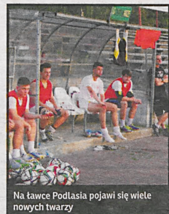
Na ławce Podlasia pojawi się wiele nowych twarzy