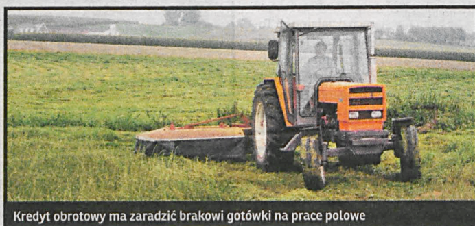
Kredyt obrotowy ma zarządzić brakowi gotówki na prace polowe

1 lutego rząd znowelizował rozporządzenie umożliwiające rolnikom otrzymanie preferencyjnych kredytów bankowych przeznaczonych na sfinansowanie kosztów prowadzenia produkcji rolnej w okresie oczekiwania na wypłatę płatności bezpośrednich. Teraz Agencja