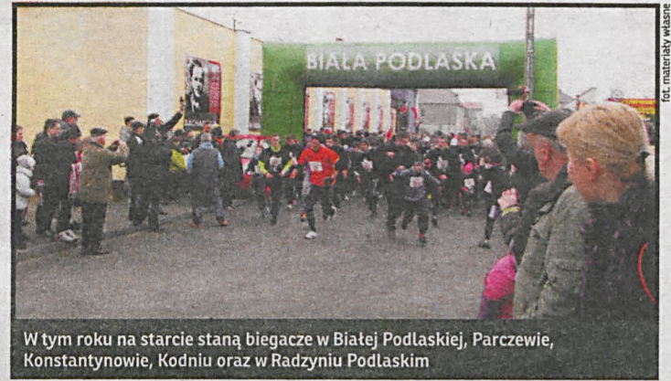
W tym roku na starcie staną biegacze w Białej Podlaskiej, Parczewie, Konstancynowie, Kodeń oraz w Radzynie Podlaskiej

Do Parczewa i Białej Podlaskiej, gdzie biegi odbędą się po raz drugi, dołączyły w tym roku Konstancynów, Kodeń oraz Radzyń Podlaski. Podstawowy dystans to 1963 metry, bowiem właśnie w 1963 roku zginął ostatni z Żołnierzy Wyklętych – sierżant Józef Franczak, ps. „Lalek”.