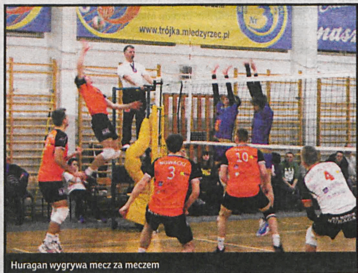
Huragan wygrywa mecz za meczem