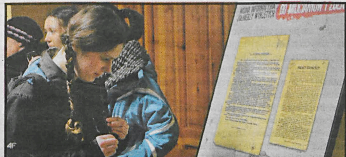
Ekspozowane na wystawie dokumenty z lat 40. pochodzą z byłych archiwów MO