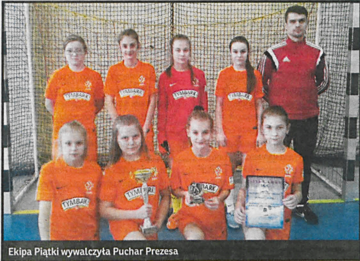
Ekipa Piątka wywalczyła Puchar Prezesa