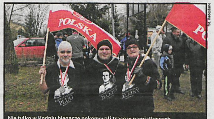
Nie tylko w Kodniu biegacze pokonywali trasę w pamiątkowych koszulkach. Najmłodszy z uczestników podlaskich biegów miał 2 lata (przebył trasę na wózku), najstarszy – 76 lat