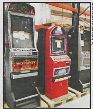
Walka z „jednoręcznymi bandytami” to priorytet dla władz Białej Podlaskiej