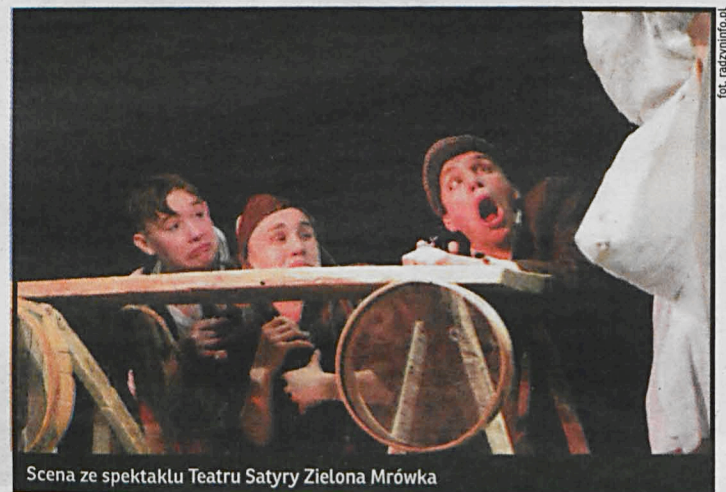
Scena ze spektaklu Teatru Satyry Zielona Mrówka