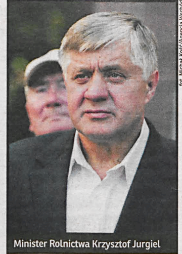
Minister Rolnictwa Krzysztof Jurgiel

ruchomości będą mogli być tylko rolnicy indywidualni. Ustawa ma chronić również interes publiczny, poprzez zabezpieczenie żywnościowe kraju. Ma też zatrzymać spekulacyjny wzrost cen nieruchomości rolnych. Polski rolnik nie jest bowiem obecnie w stanie konkurować z rolnikiem z Niemiec czy Holandii przy zakupie ziemi.