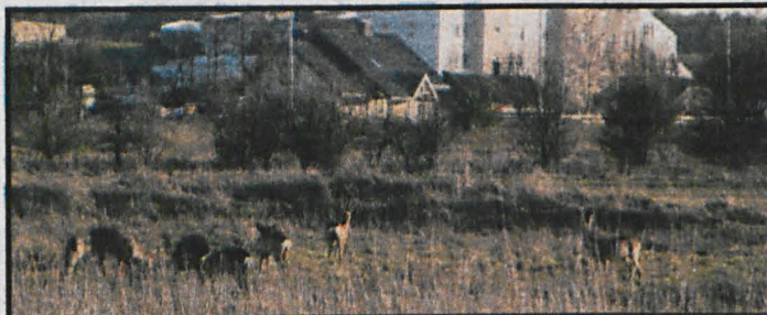
To już ostatni czas na spacer podczas którego dostrzec będziemy mogli dziką zwierzynę w pobliżu siedzib ludzkich. Wkrótce uniemożliwi to bujna zieleń