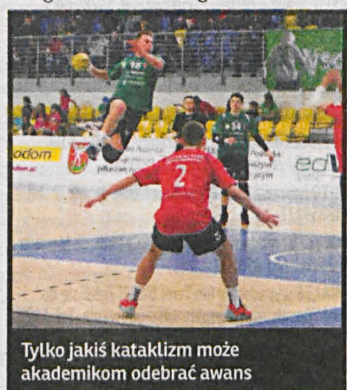
Tylko jakiś kataklizm może akademikom odebrać awans