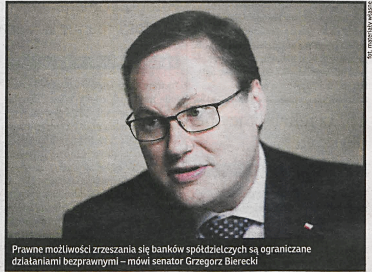
Prawne możliwości zrzeszania się banków spółdzielczych są ograniczane działaniami bezprawnymi – mówi senator Grzegorz Bierecki

Komitet Obrony Bankowości Spółdzielczej (KOBS), w piśmie skierowanym do Ministra Finansów, ujawnił skandaliczne praktyki KNF wraz z Bankiem Polskiej Spółdzielczości (BPS), w którego radzie nadzorczej zasiadała prominentna działaczka PO, Krystyna Skowrońska. Opisuje naciski KNF i zarządu BPS, narzucające zrzeszonemu bankom spółdzielczym dołączenie do rady nadzorczej BPS dwóch „niezależnych” członków. Sprawilo to, że faktyczną kontrolę nad działaniami BPS