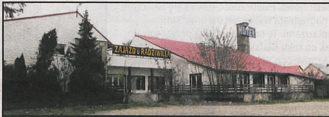
W miejscu, na którym stoi kwalifikujący się do rozbiórki Zajazd, ma powstać centrum dla dzieci autystycznych