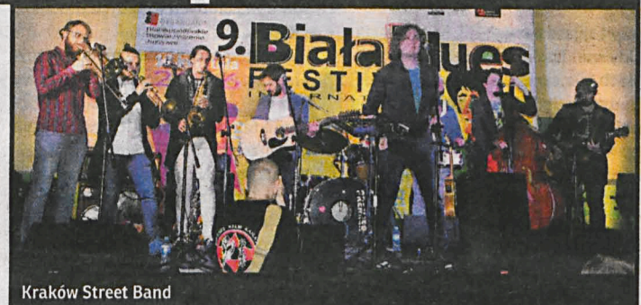
Kraków Street Band