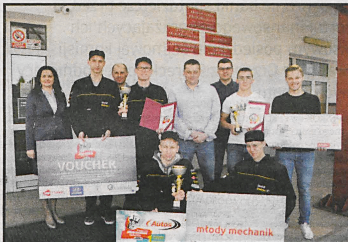
Młodzi mechanicy z ZSP otrzymali atrakcyjne nagrody, wśród których są szkolenia z obsługi i naprawy klimatyzacji zorganizowany przez firmę Autos oraz szkolenie techniczne w centrum szkoleniowym Hyundai Motor Poland