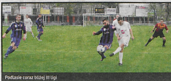
Podlasie coraz bliżej III ligi