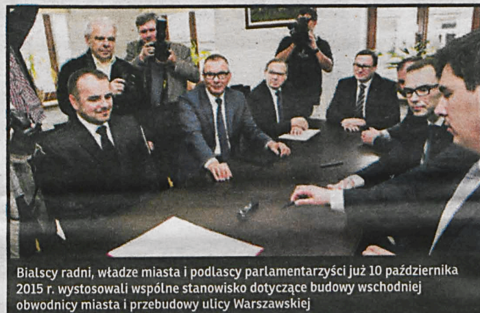
Białscy radni, władze miasta i podlascy parlamentarzyści już 10 października 2015 r. wystosowali wspólne stanowisko dotyczące budowy wschodniej obwodnicy miasta i przybudowy ulicy Warszawskiej

– Liczymy, że będziemy mogli uzyskać dofinansowania ze środków unijnych woj. lubelskiego. To ważna inwestycja dla miasta, szczególnie teraz, gdy