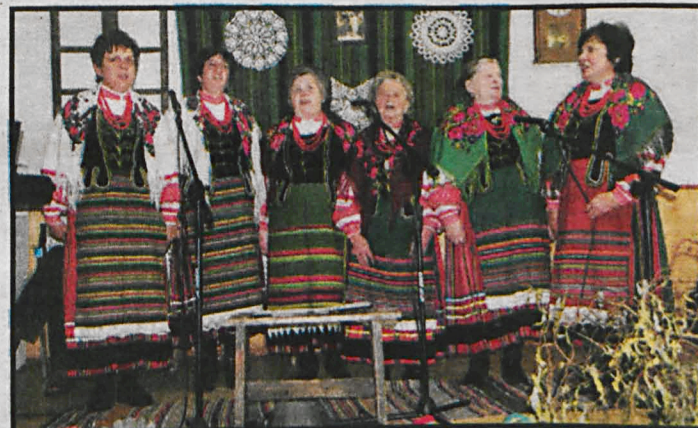
Od 30 lat „Worgulanki” koncertują, zdobywają festiwalowe nagrody, ale przede wszystkim pielęgnują zanikające zwyczaje i obrzędy