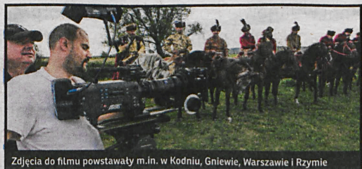
Zdjęcia do filmu powstawały m.in. w Kodniu, Gniewie, Warszawie i Rzymie

Firma Kondrat-Media została dystrybutorem filmu „Błogosławiona wina”, dokumentującego skomplikowane losy Cudownego Wizerunku Matki Bożej Kodońskiej i Mikołaja Sapielny, za którego sprawę obraz znalazł się w Kodniu. Film, powstały z inspiracji senatora Grzegorza Biereckiego, od 13 maja do 10 czerwca br. obejrzą widzowie 40 polskich miast. Szczegółowy plan pokazów dostępny jest na przygotowanej przez dystrybutora stronie: błogoslawionawina.pl Znajdują się tam również informacje o możliwości włączenia „Błogosławionej winy” do swego reper-