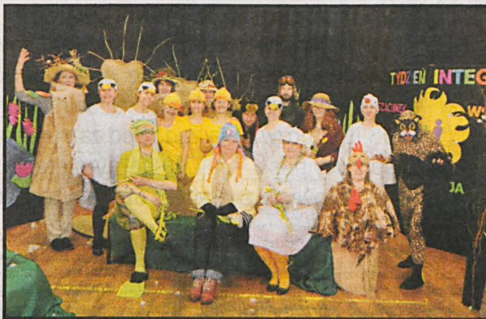
Spektakl „Brzydkie Kaczątko” był prezentem nauczycieli dla uczniów