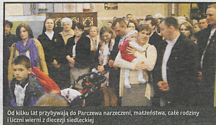
Od kilku lat przybywają do Parczewa narzeczeni, małżeństwa, całe rodziny i liczni wierni z diecezji siedleckiej

Od kilku lat przybywają do Parczewa narzeczeni, małżeństwa, całe rodziny i liczni wierni z diecezji siedleckiej, aby u stóp Matki Bożej Królowej Rodzin w Parczewskiej Bazylice szukać pomocy, dziękować i prosić o Boże błogosławieństwo. Jest to miejsce szczególnie poświęcone właśnie rodzinom – sanktuarium maryjne, w którym wielu doświadcza umocnienia, odnowienia czy wprost przemiany więzi małżeńskich i rodzinnych. Zapraszam na nie w sposób szczególny rodziny, które zadeklarowały przyjęcie do swoich domów młodych ludzi z zagranicy przybywających na Światowe Dni