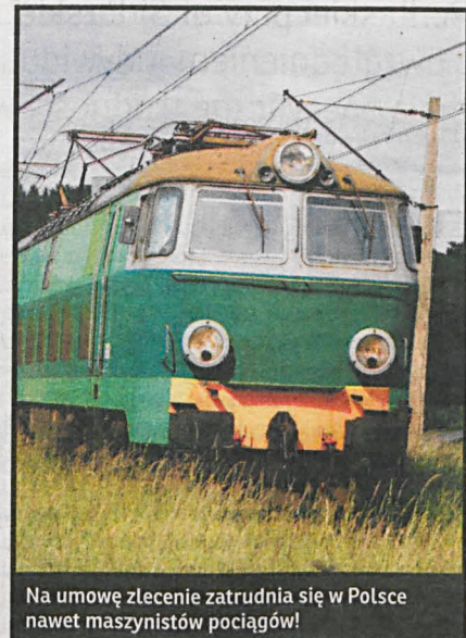
Na umowę zlecenie zatrudnia się w Polsce nawet maszynistów pociągów!

Patologia nadużywania tych umów szkodzi finansom publicznym i systemowi emerytalnemu. Ponieważ z takich umów odprowadza się mniejsze składki na fundusz ubezpieczeń społecznych – umowy śmieciowe to również śmieciowe emerytury.