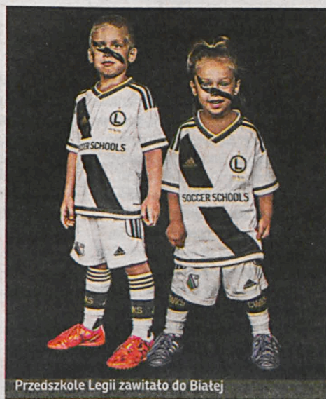
Przedszkole Legii zawitało do Białej

– Wręcz przeciwnie. Dzieci mogą trenować za-