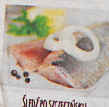
ŚLEDŹ PO SZCZECIŃSKU

WEŹ UDZIAŁ! ZGŁOSZENIA KONKURSOWE PRZYJMujemy NA STRONIE WWW.KONKURSKULINARYNY.KASASTEF CZYKA.PL ORAZ W PLACÓWKACH DO 3 CZERWCA 2016 R.