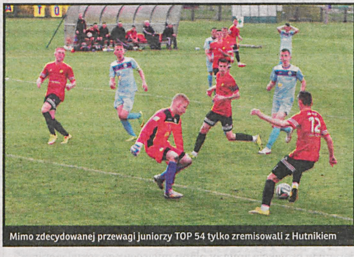
Mimo zdecydowanej przewagi juniorzy TOP 54 tylko zremisowali z Hutnikiem