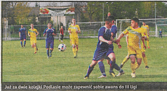
Już za dwie kolejki Podlasie może zapewnić sobie awans do III ligi

zremisowały bezbramkowo z GOSiR-em Piaseczno i we wtorek przegrały w Gdańsku ze Sztormem 1:3. Daje jej to po rundzie zasadniczej dziewiąte miejsce z 11 punktami przewagi nad miejscem spadkowym. Podlasie po wygranej na wyjeździe z Polesiem Kock i remisie u siebie z Janowianką, może już za dwie kolejki zapewnić sobie powrót do III ligi. Lutnia Piszczac po porażkach z drużynami ze strefy spadkowej: u siebie z Orleńcami Łuków i na wyjeździe z Orionem wciąż nie jest pewna ligowego bytu.