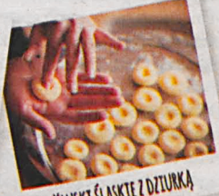
KLUSKI ŚLĄSKIE Z ODTURKĄ