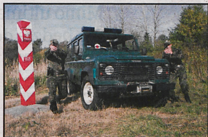
Straż Graniczna obserwuje coraz większą determinację przemytników

– Funkcjonariusze z placówki SG w Nowym Dworze, współdziałając z funkcjonariuszami NOSG w Chełmie w zatrzymanym do kontroli drogowej aucie ujawnili 206 pakunków. Jak się później okazało były to środki odurzające. W sumie, w zamkniętych hermetycznie