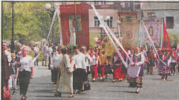
Procesję uświetniają niesione przez wiernych feretrony i inne znaki religijne

Wieczorem w białskim amfiteatrze odbył się już po raz drugi Koncert Uwielbienia, którego centralnym punktem była adoracja Najświętszego Sakramentu.