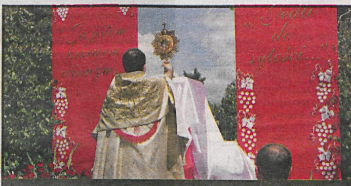
Procesja zatrzymuje się kolejno przy czterech ołtarzach, przy których czytane są fragmenty z jednej Ewangelii (wg kolejności) Mateusza, Marka, Łukasza i Jana