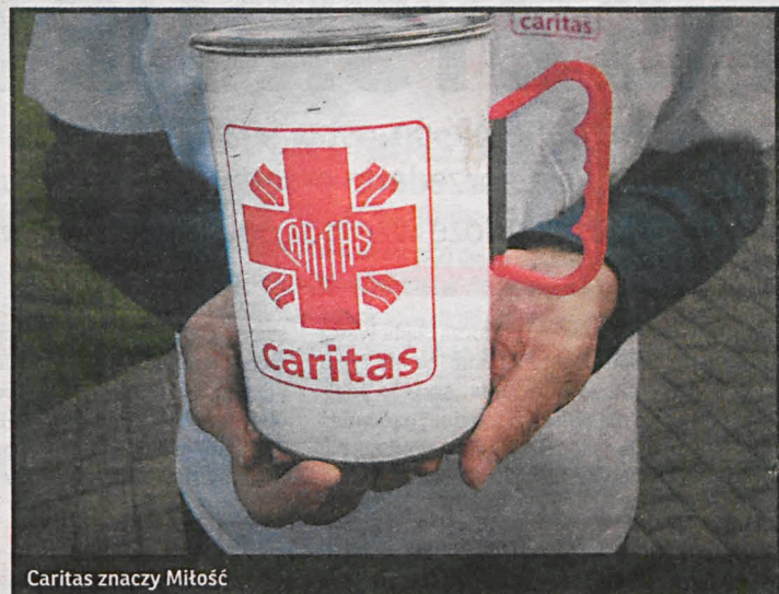
Caritas znaczy Miłość