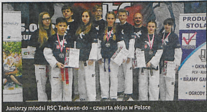
Juniorzy młodzi RSC Taekwon-do - czwarta ekipa w Polsce