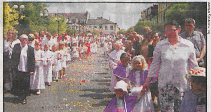
Piękną tradycją jest sypanie kwiatów pod stopy kaptana niosącego Hostię