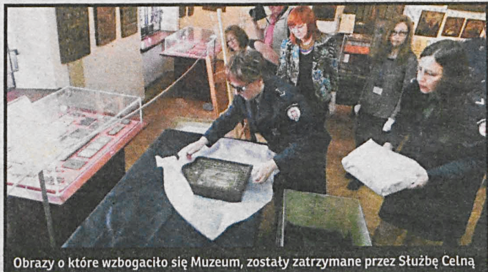
Obrazy o które wzbogaciło się Muzeum, zostały zatrzymane przez Służbę Celną