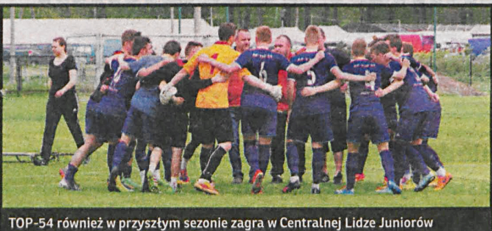
TOP-54 również w przyszłym sezonie zagra w Centralnej Lidze Juniorów