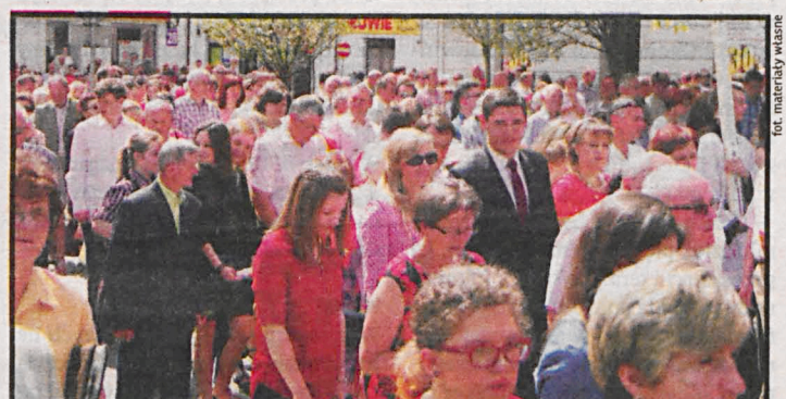
Procesja Bożego Ciała jest publicznym wyznaniem naszej wiary