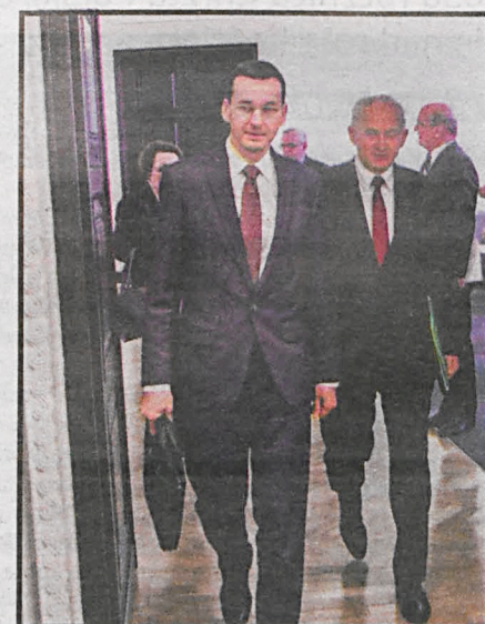
Wicepremier Morawiecki przedstawił plan rozwoju gospodarki narodowej

Nic dziwnego, że Bank Światowy w swoim kwietniowym raporcie o tendencjach dla Polski stwier-