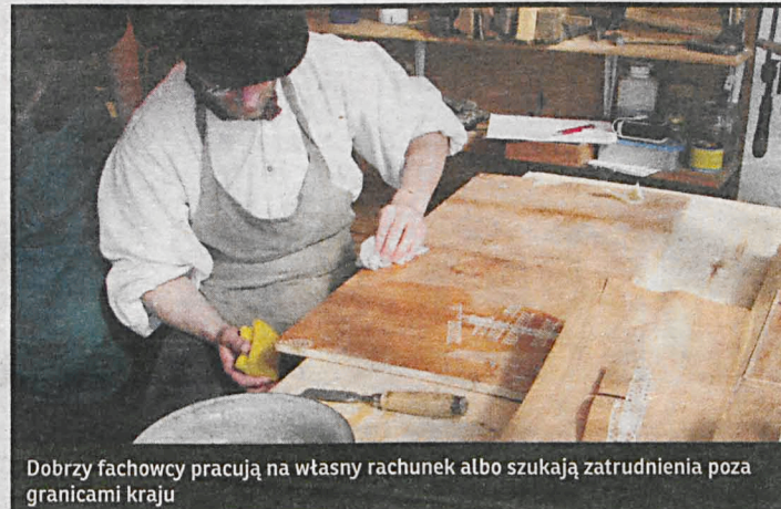
Dobrzy fachowcy pracują na własny rachunek albo szukają zatrudnienia poza granicami kraju

Przedsiębiorcy apelują do dyrekcji ZSZ nr 2 o rozpoczęcie nauczania na kierunkach stolarskich, ślusarskich czy związanych z automatyką, gdyż i w tym