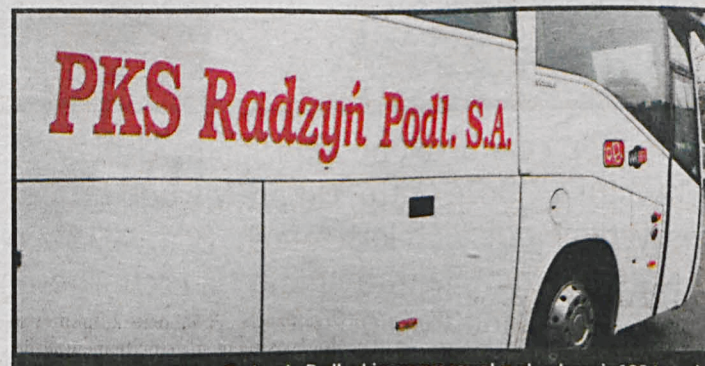
W ubiegłym roku PKS w Radzynie Podlaskim wypracował zysk w kwocie 100 tys. zł

W roku ubiegłym firma wypracowała zysk w kwocie ponad 100 tys. zł. Mniejsze dochody z podstawowej działalności, jaką jest transport osób, przedsiębiorstwo rekompensuje rozwijaniem usług okołotransportowych: prowadzi stację kontroli pojazdów, stację paliw, stację obsługi autokarów oraz pracownię badań psychologicznych. Radzyński PKS prowadzi również działania oszczędnościowe, dba o reklamę, sukcesywnie wymienia tabor i regular-