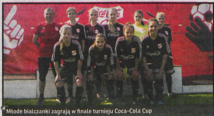
Młode białczanki zagrają w finale turnieju Coca-Cola Cup