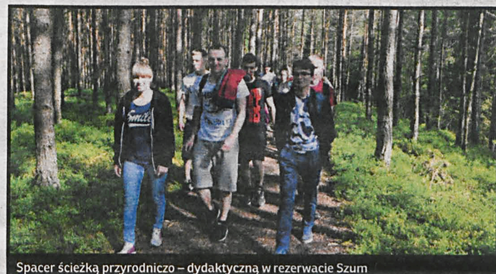
Spacer ścieżką przyrodniczo – dydaktyczną w rezerwacie Szum

i świetnie się bawią. Aby obniżyć koszty związane z podróżą i wyżywieniem, opiekunowie poszukują sponsorów. Podczas tych wyjazdów dzieci od najmłodszych lat poznają walory przyrody,