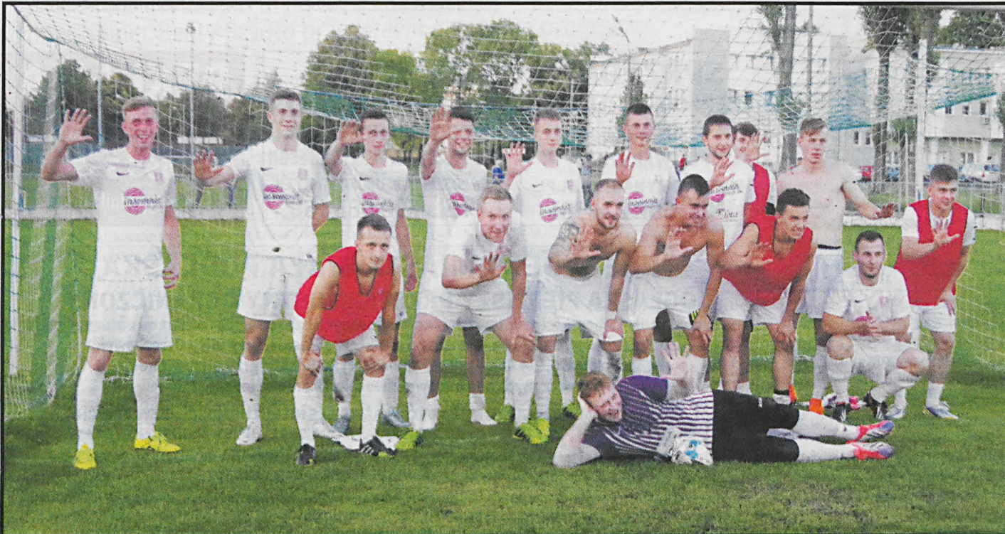
Podlasie wywalczyło awans do III ligi