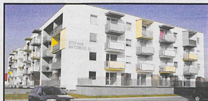
Głównym celem programu jest udostępnienie mieszkań dla tych, których pomijały dotychczasowe projekty rządowe

Uzupełnieniem programu Mieszkanie Plus oraz jego drugim filarem stanie się zwiększenie rządowego wsparcia dla społecznego budownictwa czynszowego. Samorządy będą mogły wnioskować o dofinansowanie w wysokości od