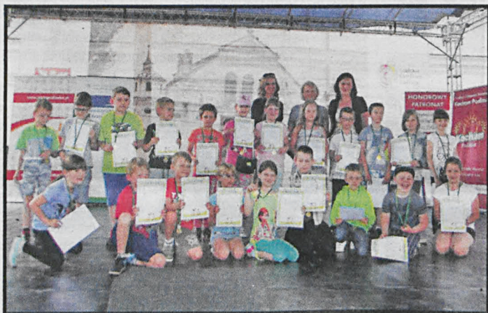
Uczniowie kl. II C, jednej z 4 klas SP nr 3 uczestniczących w projekcie SKEF „Moje Pierwsze Pieniądże”