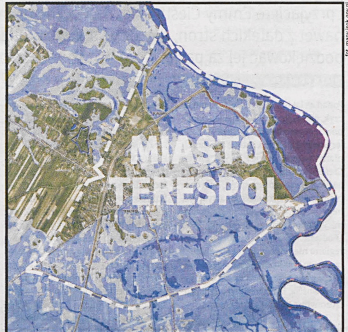
Mapa zagrożenia powodziowego obejmowała prawie cały obszar Terespola

Przynajmniej terespolanie – ponieważ problem dotyczy wielu polskich gmin. Mapy, które miały być jednym z narzędzi służących samorządowcom do ochrony terenów zalewowych, w praktyce w wielu miejscach przekłamywały stan faktyczny i pokazywały zagrożenie, które w rzeczywistości nie istnieje, bądź jest nieporównywalnie mniejsze.