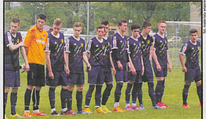
Na połączeniu obu klubów skorzystaliby piłkarze AP TOP-54 (u góry) oraz Podlasia (zdjęcie dolne)

Pomysł połączenia się obu klubów od początku cieszy aprobatę władz miasta. Zresztą projekt statutu i harmonogram połączenia powstał właśnie w magistracie. Jednak sceptycyzm rośnie. – Mam wrażenie, że nic z tego nie będzie. Jeżeli mówicie „chcemy się połączyć, ale...”, to z tego nic nie wyjdzie. Musicie wypracować kompromis – ape-