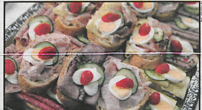
W pielgrzymim menu dominować będą polskie wędliny, warzywa i owoce

nie znamy zapotrzebowania, z drugiej wiemy, że trzeba być przygotowanym na każdą ilość. Mamy więc dwie różne wiadomości» – przyznał ks. Kordula. „O tym, jaka to jest skala przedsięwzięcia, pokazują proste rachunki. Na jednym tirze, który stanie w Brzegach, o pojemności 40 ton, mieści się 10 tys. pakietów suchego prowiantu. Jeżeli będzie 12 takich stref, to jednorazowo będzie to ok. 500 ton żywności. Sądymy, że trzeba to pomnożyć razy kilka, dlatego że sobota i niedziela to wydarzenie, na które przybędzie ogromna liczba pielgrzymów. Je-