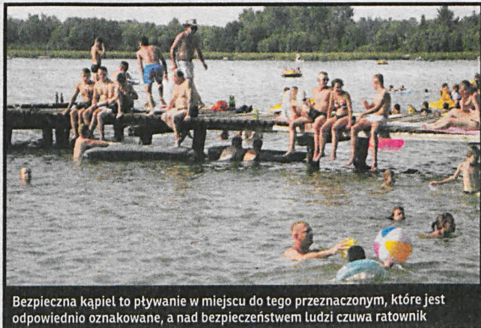
Bezpieczna kąpiel to pływanie w miejscu do tego przeznaczonym, które jest odpowiednio oznakowane, a nad bezpieczeństwem ludzi czuwa ratownik