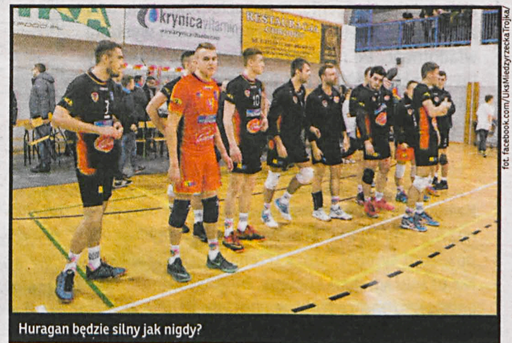
Huragan będzie silny jak nigdy?

Cisza panuje na razie wokół przygotowań i zmian w Zakładzie Karnym.