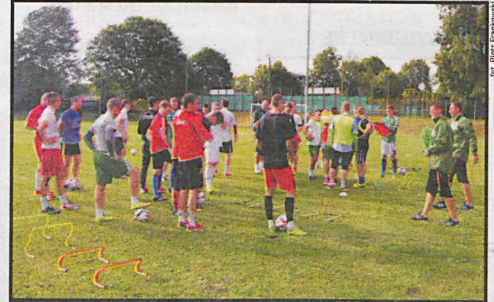
Na pierwszym treningu Podlasia stawilo się ponad 30 piłkarzy