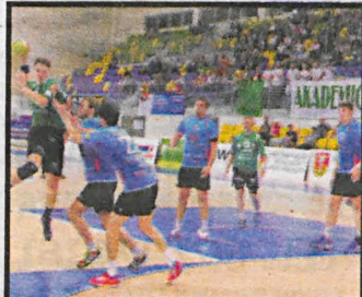
Zwycięzcy mistrzostw powiatu wracają na parkiet 10 września

Poznaliśmy terminarz gier I ligi piłki ręcznej. Biański AZS AWF rozpocznie zmagania w domu z Czuwajem Przemysł 10 września. Kolejnymi rywalami akademików będą: Siódemka Legnica, Olimpia Piekary Śląskie, KSPPR Końskie, Moto-Jelcz Oława, MKS Kalisz, MTS Chrzanów, SPR Tarnów, KSZO Odlewnia Ostrowiec Świętokrzyski, Stal Mielec, Vive Tauron II Kielce, ASPR Zawadzkie, Ostrovia Ostrów Wielkopolski.