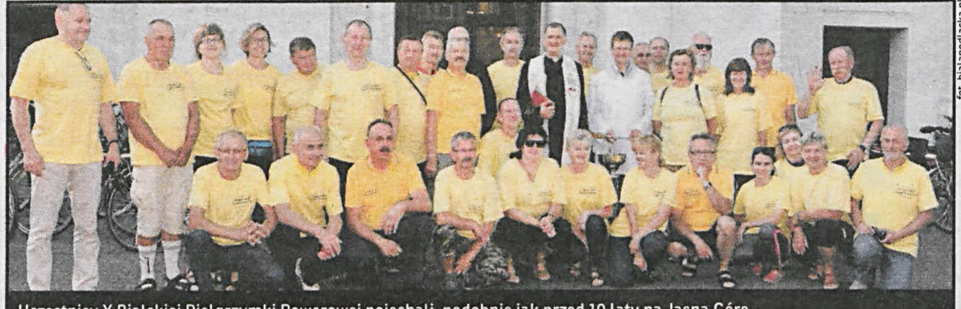
Uczestnicy X Białskiej Pielgrzymki Rowerowej pojechali, podobnie jak przed 10 laty na Jasną Górę