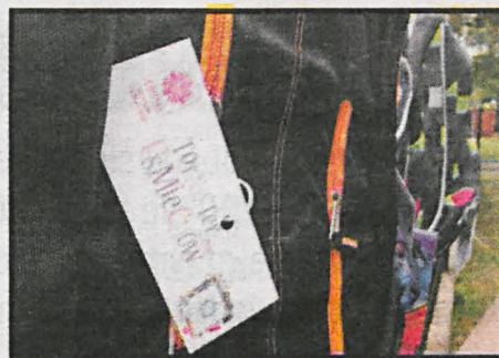
W tym roku 1700 plecaków trafi do najbardziej potrzebujących uczniów.

Caritas Diecezji Siedleckiej zakupiła w czerwcu br. 1700 plecaków. Będą one rozdysponowywane do parafii, które zgłaszają chęć udziału w akcji. W ogłoszeniach parafialnych podane będą informacje, jak włączyć się w pomoc