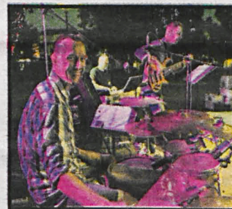
Piątkowy występ zespołu Silk na pl. Wolności oraz niedzielny koncert muzyki poważnej w Parku Radziwiłłowskim zainaugurowały cykl tegorocznych koncertów wakacyjnych