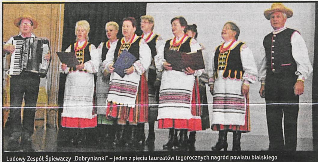
Ludowy Zespół Śpiewaczy „Dobryniarki” – jeden z pięciu laureatów tegorocznych nagród powiatu bialskiego

działania związane z dokumentacją historii i kultury lokalnej. Powstała w ten sposób multimedialna kronika Dubicy, zawierająca wywiady z najstarszymi mieszkańcami oraz film o historii miejscowości.