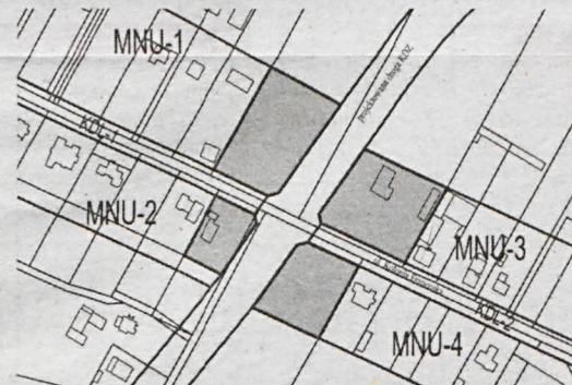
Część terenu na skrzyżowaniu ul. Kolonia Francuska z projektowaną drogą zbiorczą

Zainteresowani mogą składać wnioski do wyżej wymienionej zmiany planu miejscowego. Wnioski należy składać na piśmie w siedzibie Urzędu Miasta Biała Podlaska, ul. Marszałka Józefa Piłsudskiego 3, pok. nr. 8 (kancelaria ogólna) w terminie do dnia 22 sierpnia 2016 r. Wniosek powinien zawierać nazwisko, imię, nazwę i adres wnioskodawcy, przedmiot wniosku oraz oznaczenie nieruchomości, której dotyczy.