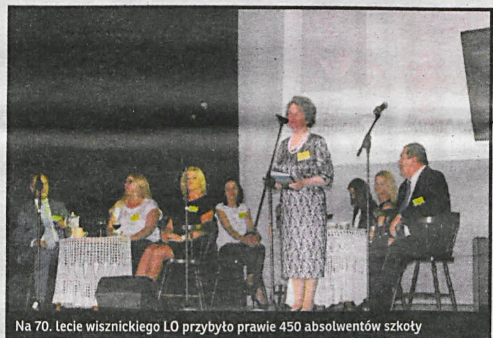
Na 70. lecie wisznickiego LO przybyło prawie 450 absolwentów szkoły