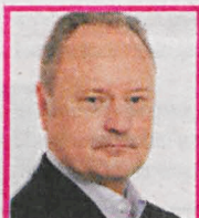
JANUSZ SZEWCZAK Poseł PiS