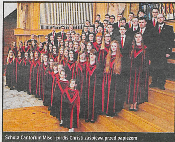
Schola Cantorum Misericordis Christi zaśpiewa przed papieżem