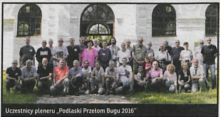
Uczestnicy pleneru „Podlaski Przełom Bugu 2016”

ZAWIĘZI Z 1994 tygodnik Podlaski BIALA PODLASKA BARDZYSZ PODLASKI MIĘDZYRZEC PODLASKI PRACZEW TERESPOL