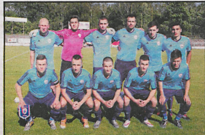
Lutnia najlepsza w Memoriale