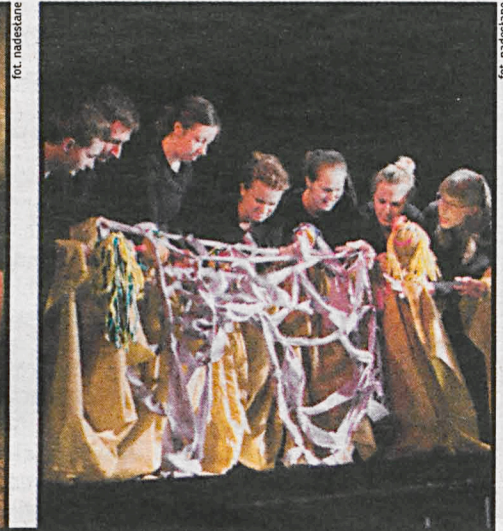
W radzyńskich warsztatach uczestniczy nie tylko młodzież znajdująca się u progu przygody z teatrem, ale również osoby pragnące podnieść swoje umiejętności sceniczne oraz instruktorzy, prowadzący grupy teatralne w różnych ośrodkach kultury