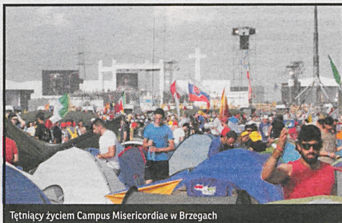
Tętniący życiem Campus Misericordiae w Brzegach

– Czuję łączącą nas wszystkich chrześcijańską radość. Jest to z pewnością największa przygoda, jakie przeżyłem. Z każdego nauczania papieża Franciszka wzięłem garstkę dla siebie. Postanowiłem zaangażować w jakieś koło w szkole albo wolontariat. Po to, by nie skupiać się na tym tylko, żeby mieć dobre oceny. Chciałbym innym dać coś od siebie. ŚDM, bo to nie tylko modlitwa, ale też integracja, poznanie różnych kultur, kumulacja dobrej energii oraz obalanie stereotypów o różnych nacjach.