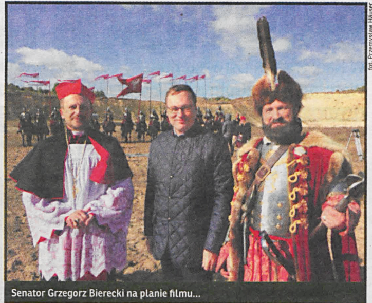
Senator Grzegorz Bierecki na planie filmu...

Po uroczystej premierze w Białej Podlaskiej i licznych pokazach kinowych w całej Polsce film trafi niebawem na telewizyjne ekrany. Emisję „Błogosławionej winy” w Programie Pierwszym TVP zapowiedziano na niedzielę, 14 sierpnia o godz. 12.50.