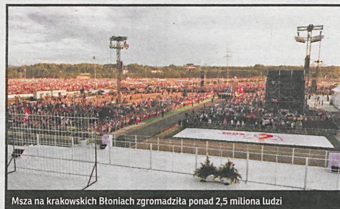
Msza na krakowskich Błoniach zgromadziła ponad 2,5 miliona ludzi

Ta ciężka praca wielu osób zaangażowanych w organizację uroczystości już przyniosła owocny plon. Nie tylko dla hotelarzy, restauratorów i wszystkich tych, którzy zarabiali na licznie zgromadzonych w Polsce pielgrzymach. Ten zysk będzie tylko procentował, bo zadowoleni