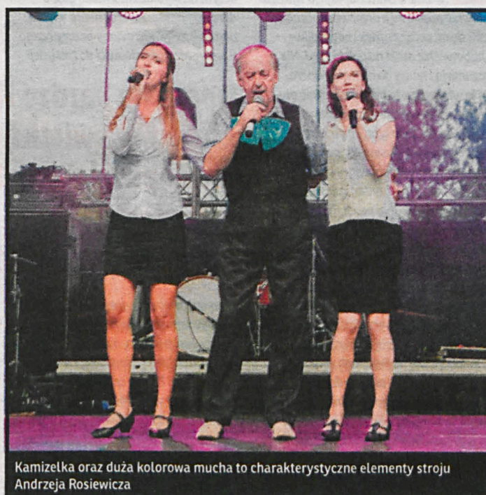
Kamizelka oraz duża kolorowa mucha to charakterystyczne elementy stroju Andrzeja Rosiewicza