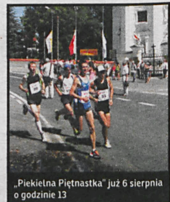
„Piekielna Piętnastka” już 6 sierpnia o godzinie 13

– Zapraszamy również zapominałskich, zgłoszenia do biegu głównego będą przyjmowane w dniu biegu od godz. 9 w biurze zawodów (ZPO, ul. 1-go Maja 27). O godz. 10.30 w Sanktuarium odprawiona zostanie msza św. w intencji uczestników, organizatorów i sponsorów biegu, a dekoracja zwycięzców