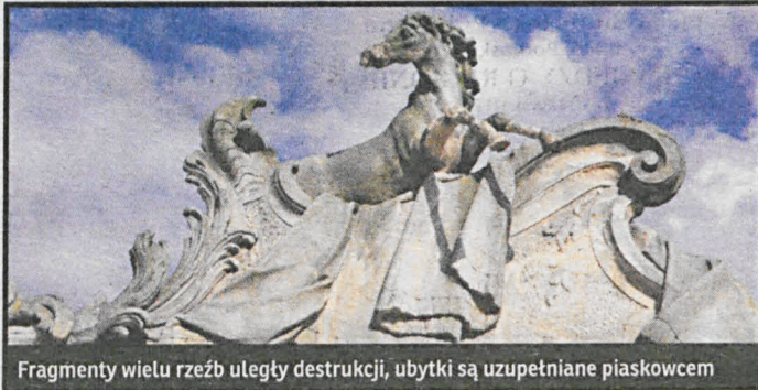
Fragmenty wielu rzeźb uległy destrukcji, ubytki są uzupełniane piaskowcem