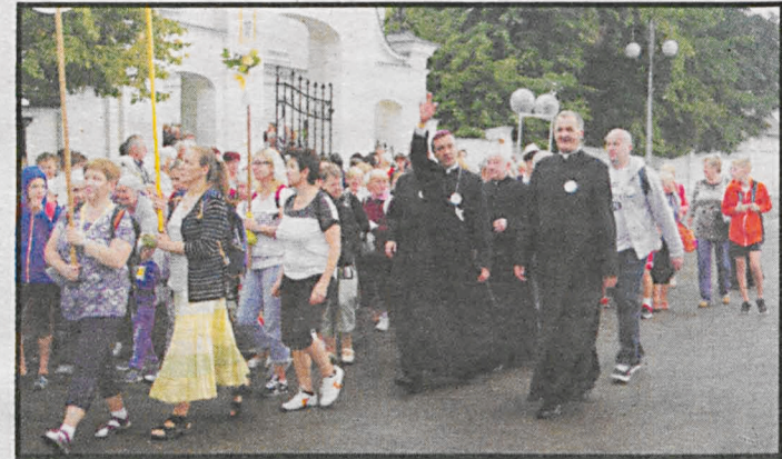
1 sierpnia z Białej wyruszyła 35 Piesza Pielgrzymka Podlaska na Jasną Górę

– Już nie te lata, nie to zdrowie – powie-