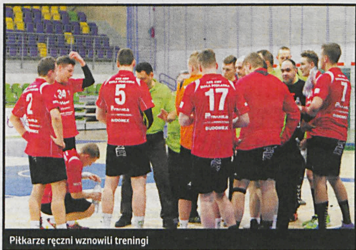
Piłkarze ręczni wznovili treningi