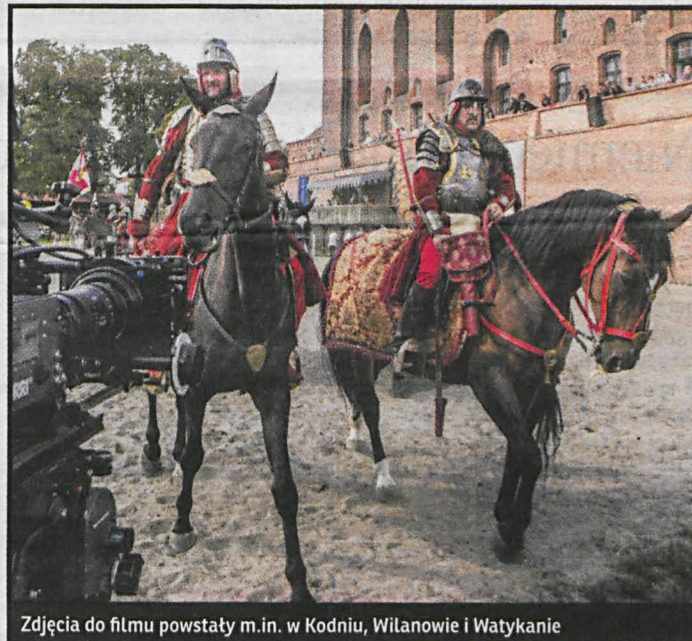
Zdjęcia do filmu powstały m.in. w Kodniu, Wilanowie i Watykanie

promujemy Południowe Podlasie. Historia i kultura tego regionu jest jednym z naszych największych skarbów.