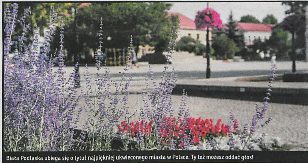
Biała Podlaska ubiega się o tytuł najpiękniej ukwieconego miasta w Polsce. Ty też możesz oddać głos!