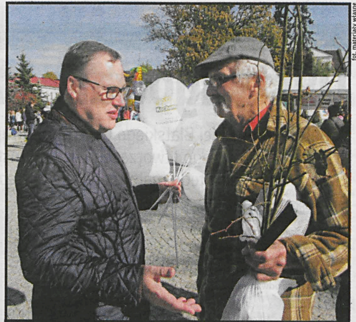
Sen. Grzegorz Bierecki: wyborcy oceniają mnie przez pryzmat efektów pracy, a nie medialnych insynuacji