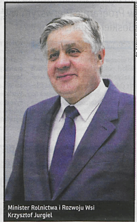
Minister Rolnictwa i Rozwoju Wsi Krzysztof Jurgiel

W tym uroczystym dniu życzę, aby rolnicy za swoją ciężką pracę, produkcję żywności, mogli otrzymywać godziwe wynagrodzenie, tak jak na to rzeczywiście zasługują oraz by społeczeństwo darzyło Was zawsze szacunkiem. Życzę serdecznie pomyślności i satysfakcji z pięknej służby na rzecz wyżywienia narodu, a nade wszystko – zdrowia i szczęścia rodzinnego.