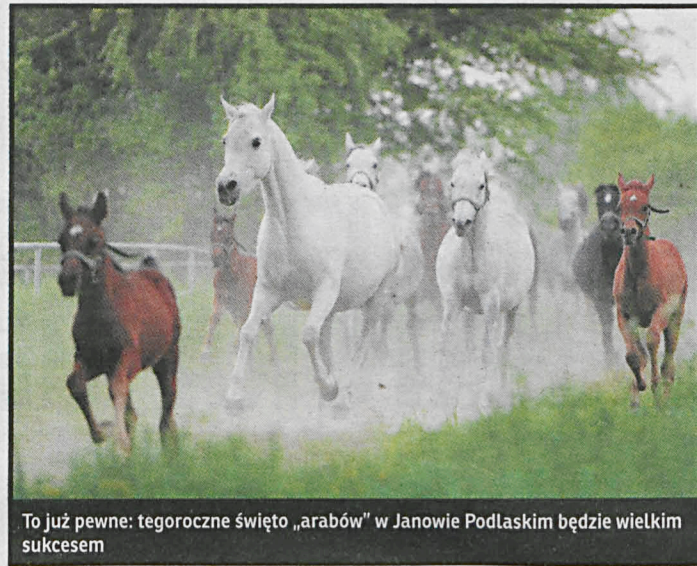
To już pewne: tegoroczne święto „arabów” w Janowie Podlaskim będzie wielkim sukcesem