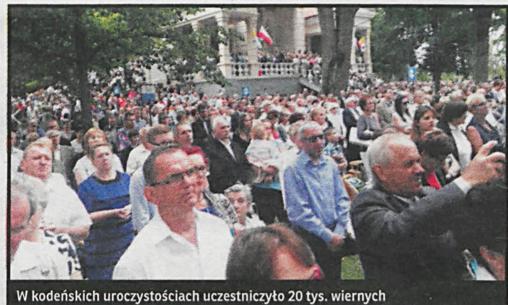
W kodeńskich uroczystościach uczestniczyło 20 tys. wiernych