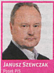
JANUSZ SZEWCZAK Posłanek PIS

cznia niesprzedanej żywności można iść do więzienia nawet na dwa lata. Polska ustawa nie będzie tak restrykcyjna jak francuska. Senator Augustyn twierdzi, że nowe przepisy mają bardziej działać na świadomość zarządców sklepów, że przekazując żywność potrzebującym, mogą ograniczyć swoje koszty. Senacki projekt przewiduje nałożenie