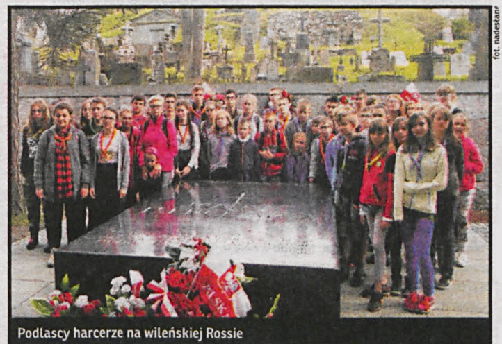
Podlascy harcerze na wileńskiej Rossie