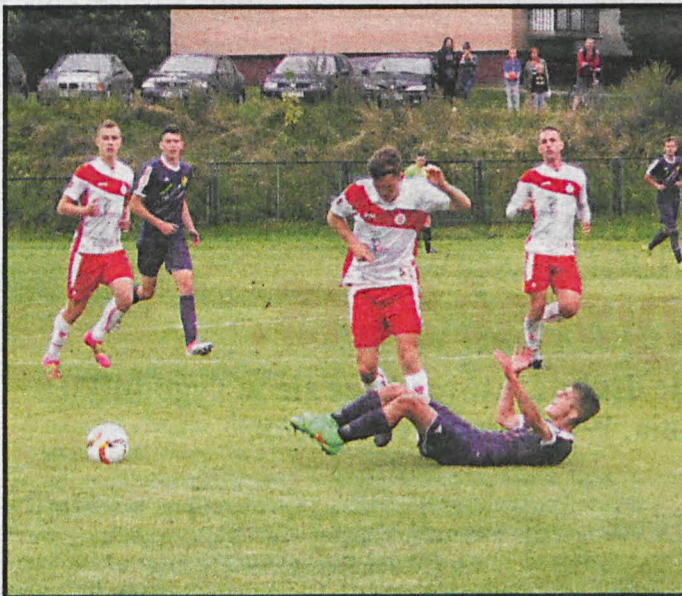
Pierwsze zwycięstwo w rozgrywkach CLJ odnieśli juniorzy TOP 54