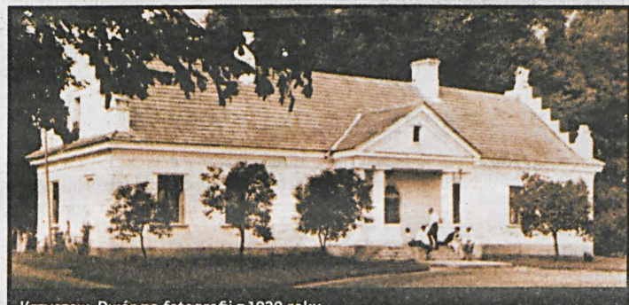
Krzyczew. Dwór na fotografii z 1930 roku

szła nieposłuszeństwem wobec rodziców, za co została okrutnie ukarana: zamieniła się z głaz. – Niestety perełka Nepli, zabytkowy park ulega ciągłej dewastacji, wszyscy