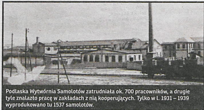
Podlaska Wytwórnia Samolotów zatrudniała ok. 700 pracowników, a drugie tyle znalazło pracę w zakładach z nią kooperujących. Tylko w l. 1931 – 1939 wyprodukowano tu 1537 samolotów.