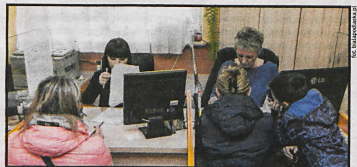
Wbrew obawom sceptyków pieniądze otrzymywane w ramach świadczenia „Rodzina 500+” inwestujemy w rozwój swoich dzieci

Rodziny podkreślają, że otrzymywane środki inwestują w rozwój intelektualny, kulturalny i fizyczny swoich dzieci: opłacanie zajęć dodatkowych,