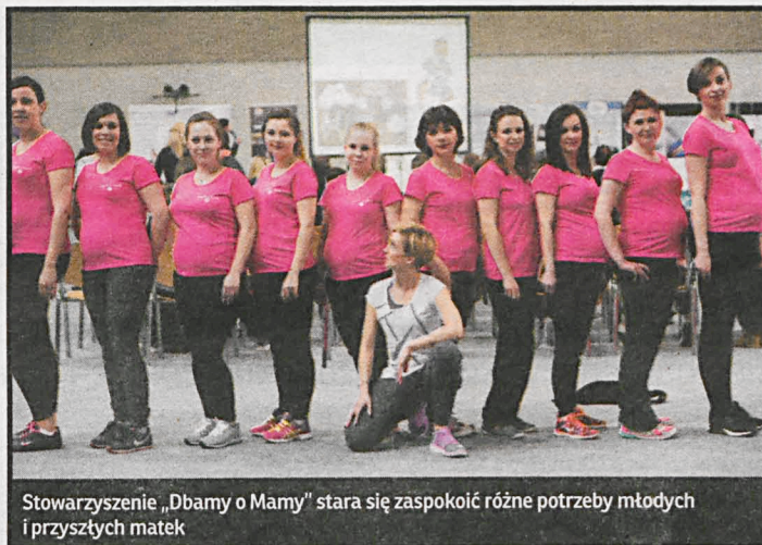
Stowarzyszenie „Dbamy o Mamy” stara się zaspokoić różne potrzeby młodych i przyszłych matek

Z chwilą pojawienia się dziecka obojgu rodzicom lawinowo przybywa nowych