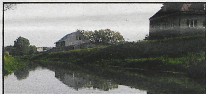
Tablice na wale z napisem: „Wejście i poruszanie się zabronione” zbulwersowały i mieszkańców i magistrat