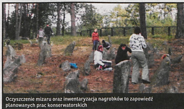
Oczyszczenie mizaru oraz inwentaryzacja nagrobków to zapowiedź planowanych prac konserwatorskich