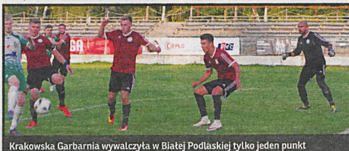
Krakowska Garbarnia wywalczyła w Białej Podlaskiej tylko jeden punkt

czu z Armenią ekipa biało-czerwonych wywalczyła prawo gry w nadchodzących Mistrzostwach Europy. W najbliższą sobotę o godz. 11 piłkarki AZS PSW podejmą AZS PWSZ Wałbrzych. Kolejny dobry występ zaliczyło Podlasie Biała Podlaska, remisując bezbramkowo na własnym boisku z Garbarnią Kraków.