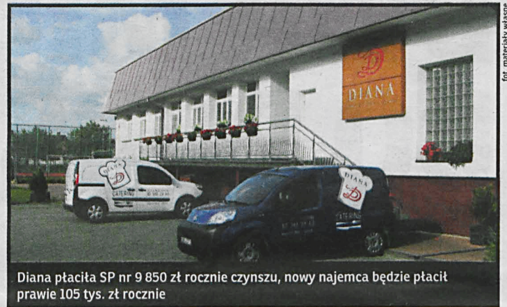
Diana płaciła SP nr 9 850 zł rocznie czynszu, nowy najemca będzie płacił prawie 105 tys. zł rocznie

Owszem, magistrat zgadza się częścią argumentów Diany, przyznaje że ta firma przygotowywała smaczne posiłki. Jednakże kwota najmu świadczyła o olbrzymich zaniedbaniach i niegospodarności ze strony poprzed-