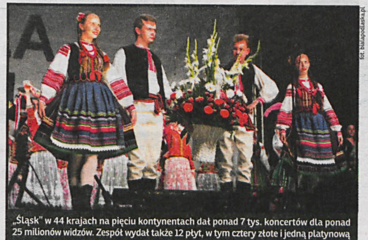
„Śląsk” w 44 krajach na pięciu kontynentach dał ponad 7 tys. koncertów dla ponad 25 milionów widzów. Zespół wydał także 12 płyt, w tym cztery złote i jedną platynową