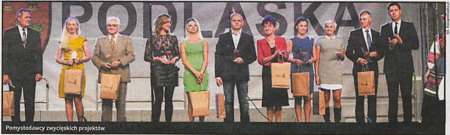
Pomysłodawcy zwycięskich projektów

Jeden milion złotych przeznaczył na budżet obywatelski prezydent Dariusz Stefaniuk. Mieszkańcy zgłosili aż 65 pomysłów realizacji różnorodnych przedsięwzięć w swoim najbliższym otoczeniu: na swoich ulicach i osiedlach. Po ocenie formalnej do głosowania zakwalifikowano 51 z nich. Miasto zostało podzielone na 7 obszarów, z których każdy otrzymał 50 tys. zł jako sumę podstawową i kwotę dodatkową, wliczaną proporcjonalnie do liczby mieszkańców. Zgodnie z przyjętymi zasadami głosować mógł każdy mieszkaniec Białej Podlaskiej powyżej 16 roku życia na dwa projekty z dwóch różnych obszarów. W ten sposób wyłoniono siedem najciekawszych zdaniem mieszkańców inicjatyw, które poparło ponad 10 tys. osób.