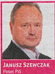
JANUSZ SZEWCZAK Posel PIS

szym ogniwem jest człowiek, a pomyłki nawet te personalne są rzeczą ludzką, które jednak zawsze można w porę skorygować. Pozostała nam reszta majątku narodowego w formie spółek SP, która potrzebuje dobrego, kompetentnego właściciela i nadzorca, który potrafi dbać przede wszystkim o dobro wspólne Polaków.