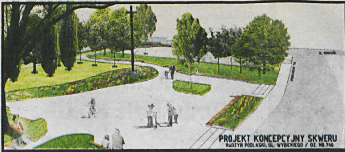
Wstępna wizualizacja Skweru 1050-lecia Chrztu Polski