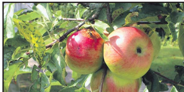
Producenci indywidualni oraz organizacje producentów otrzymają pomoc finansową za wycofanie z rynku wybranych owoców i warzyw

Organizacje producentów i producenci indywidualni mogą od 30 września składać powiadomienia w Oddziale Terenowym Agencji Rynku Rolnego w Lublinie, ul. Leszka Czarnego 3, 20-610 Lublin na formularzu powiadomienia, znajdującym się na stronie internetowej www.arr.gov.pl .