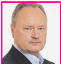
JANUSZ SZEWCZAK Poseł PiS

W arto wreszcie podjąć skuteczne, kontrolne działania w stosunku do dużych koncernów, banków czy instytucji finansowych. Zamiast ekonomii chciwości, Polska jak i cały świat, a przede wszystkim zwykli ludzie coraz bardziej potrzebują ekonomii wartości i sprawiedliwości. Jeśli chcemy rządzić kilka kadencji, na co są ogromne szanse, to nasi fachowcy nie mogą być głównie przyjaciółmi rynków, zakładnikami banksterów, drżącymi przed kolejną oceną wiarygodności przez coraz mniej wiarygodne agencje ratingowe. Pomruki niezadowolonego Związku Banków Polskich czy kolejne wygłupy i złośliwości eurobiurokratów nie powinny robić wielkiego wrażenia na rządzących, bo silne i skuteczne państwo to takie, które potrafi sobie poradzić z bankami, instytucjami finansowymi i grupami interesu czy różnego rodzaju lobby, a nie odwrotnie. Stawiając czoła wyzwaniom i naprawiając Polskie Państwo, nie tylko nie możemy zawieść pokładanych nadziei, ale musimy bronić interesów najsłabszych, bo państwo polskie i jego