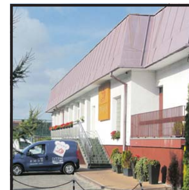
Diana nie zamierza się wyprowadzić. Triomix, firma która wygrała przetarg, czeka na lokum

Zupełnie inne wyniki badań wody przedstawiła firma Diana. Właścicielka zleciła badania wody Laboratorium Usługowo-