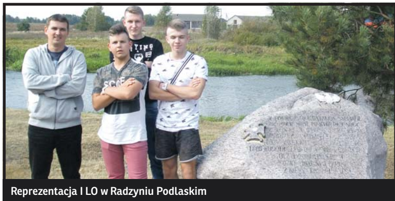
Reprezentacja I LO w Radzynie Podlaskim