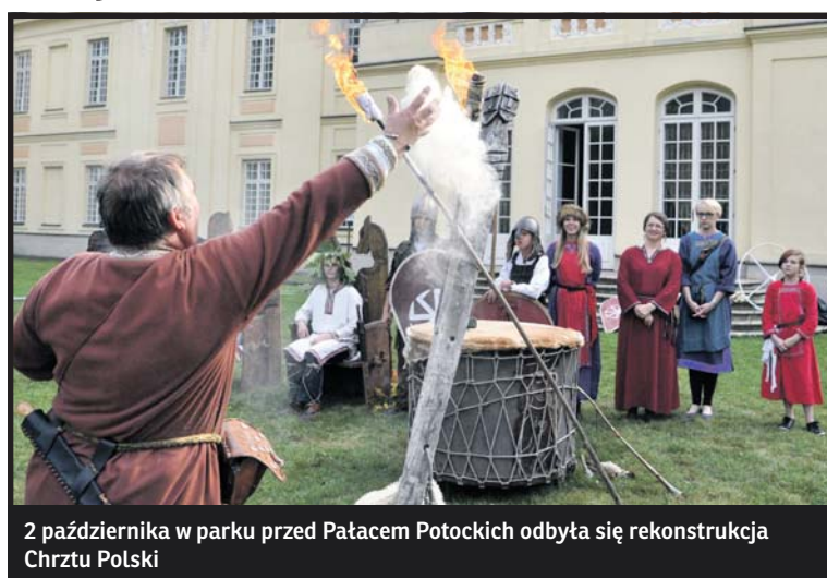
2 października w parku przed Pałacem Potockich odbyła się rekonstrukcja Chrztu Polski

W sobotę 8 października o godz. 19 w Sanktuarium Matki Boskiej Nieustającej odbędzie się wernisaż wystawy fotograficznej „Książd arcybiskup Andrzej Dzięga – Radzynianin wśród radzynian”. Finał uroczystości przewidziano w niedzielę 9 października o godz. 10.30.