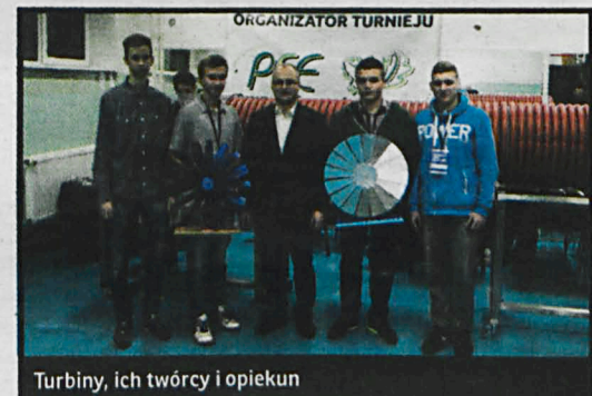
Turbiny, ich twórcy i opiekun

Drużynie „Wind Performance” udało się zająć I miejsce w kategorii „moment obrotowy” przy zatrzymanym wale turbiny. – Już tradycją stał się udział reprezentantów naszej szkoły w finale ogólnopolskim. W ubiegłym roku zajęliśmy II miejsce w Polsce w kategorii „moment obrotowy”. Obecnie również liczymy na dobry wynik. Obie drużyny napracowały się solidnie. Aby maszyny były efektywne, uczniowie musieli wykażać się wiedzą z zakresu mechaniki i fizyki. Dokładność