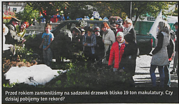
Przed rokiem zamieniliśmy na sadzonki drzewek blisko 19 ton makulatury. Czy dzisiaj pobijemy ten rekord?