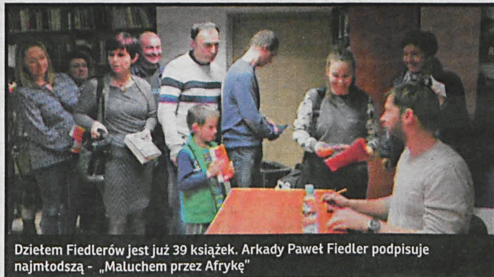
Dzieciom Fiedlerów jest już 39 książek. Arkady Paweł Fiedler podpisuje najmłodszą – „Maluchem przez Afrykę”

zapoczątkował podróżnicze tradycje w mojej rodzinie. Myślę jednak, że główny powód to wychowanie w domu, który stworzył; domu pełnego pamiątek, zdjęć i opowieści z dalekiego świata.