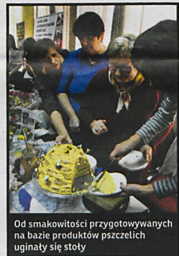
Od smakowitości przygotowywanych na bazie produktów pszczelich ugnęły się stoły

Miód – nazywany płynnym złotem bądź naturalnym antybiotykiem ma działanie bakteriobójcze i antyseptyczne, korzystnie wpływa na przemianę materii, pracę serca, kości i nerwy, a także najszybciej uzupełnia niedobory energetyczne organizmu. Znany był już w starożytności. Stosowano go do leczenia ran, na dolegliwości oczu oraz jako środek wzmacniający. Obecnie ma szerokie zastosowanie w różnych dziedzinach naszego życia, m.in.: w medycynie, kosmetologii i kuchni. Organizatorami II Jarmarku Pszczelar-