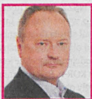
JANUSZ SZEWCZAK Poseł PiS