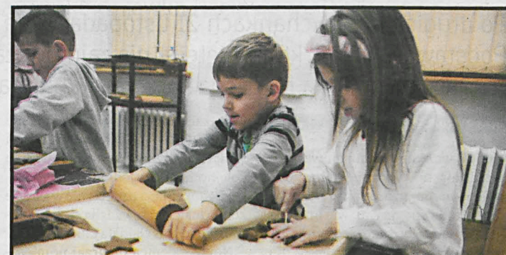
Technologię pieczenia pierników można poznać podczas warsztatów organizowanych przez pracowników muzeum dla młodzieży szkolnej oraz całych rodzin