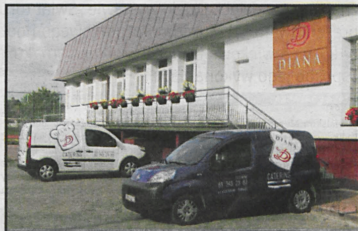
Too już przeszłość. 21 listopada Diana opuściła wreszcie stołówkę SP nr 9

Niestety, modernizacja stołówki i oddanie jej do użytku najprawdopodobniej nie zakończy tej sprawy. Wszystko wskazuje na to, że wojenny topór nie został jeszcze zakopany.