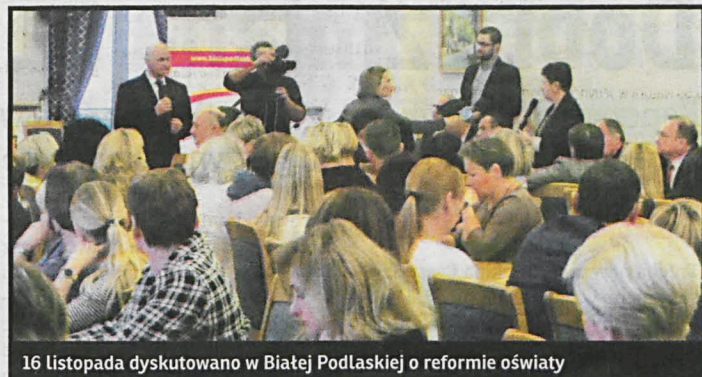
16 listopada dyskutowano w Białej Podlaskiej o reformie oświaty

Ministerstwo Edukacji Narodowej uruchomiło specjalny serwis internetowy www.reformaedukacji.men.gov.pl , gdzie znaleźć można najistotniejsze informacje dla uczniów, ich rodziców, nauczycieli oraz organów prowadzących szkoły a także numery telefonów i adres e-mail, pod którymi można zadać pytanie, przedstawić własne sugestie i propozycje.