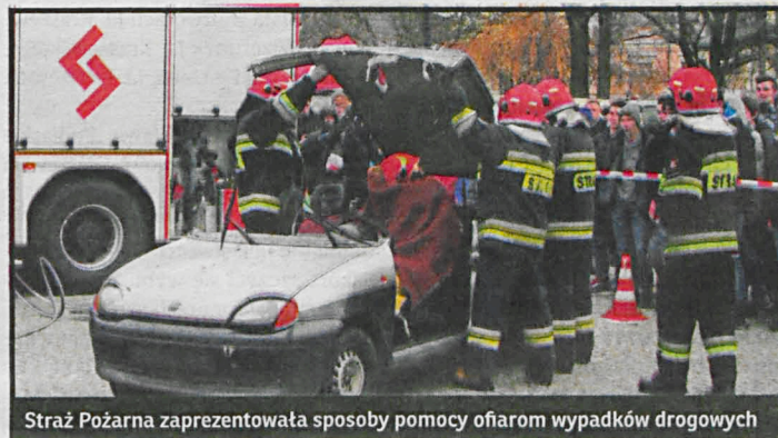
Straż Pożarna zaprezentowała sposoby pomocy ofiarom wypadków drogowych