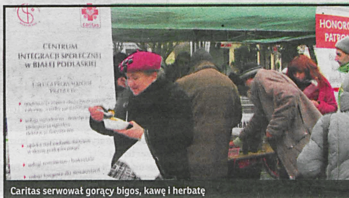
Caritas serwował gorący bigos, kawę i herbatę