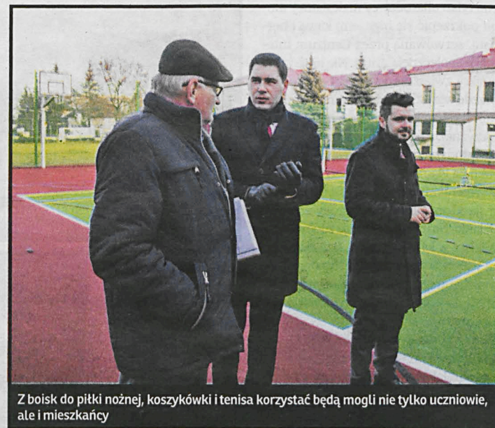
Z boiska do piłki nożnej, koszykówki i tenisa korzystać będą mogli nie tylko uczniowie, ale i mieszkańcy

Tuż przed sesją popularnonaukową nie tylko młodzież szkolna, ale również mieszkańcy miasta otrzymali niezwykle cenny prezent. Przy I LO im. J.I. Kraszewskiego oddano do użytku pełnowymiar-