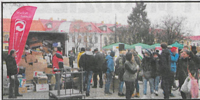
O godz. 11 pierwszy kontener był już wypełniony. W tym roku przynieśliśmy na Plac Wolności 14 320 kg makulatury