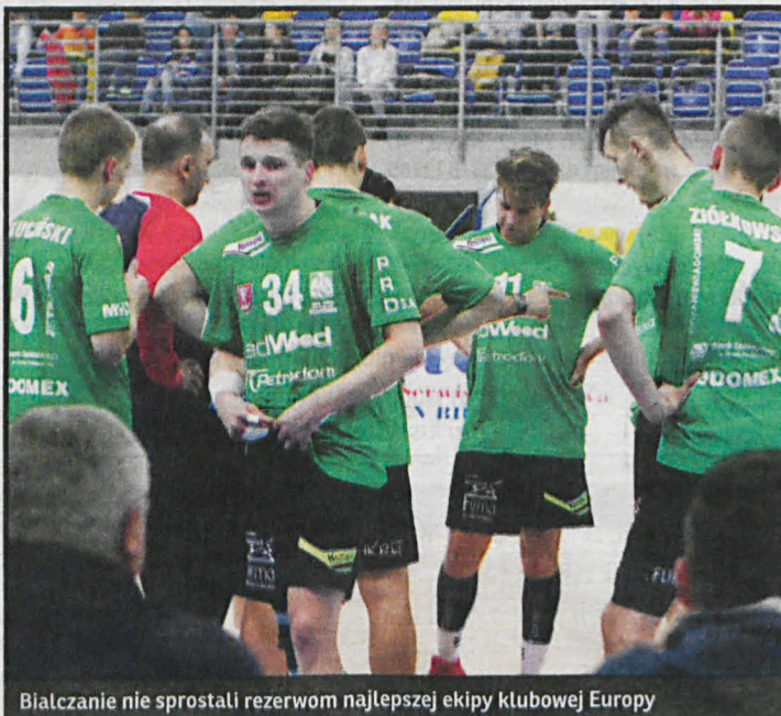
Białczanie nie sprostał rezerwow najlepszej ekipy klubowej Europy

AZS AWF: Adamiuk, Chmurski, Kozłowski – Warmijak 2, Skuciński, Ziółkowski, Rusin 3, Chełmiński, Stefaniec 9, Kruczkow 7, Jaszczuk 2, Banaś, Kandora 1, Pezda 1