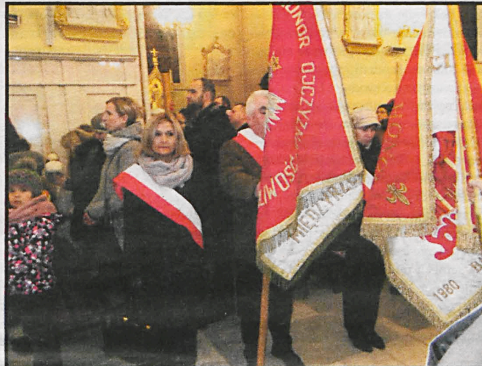
W Białej Podlaskiej, Radzynie i Międzyrzeczu odbyły się msze św. za Ojczyznę w 35. rocznicę wprowadzenia stanu wojennego i złożenie kwiatów w miejscach pamięci

Poznański czerwiec 1956 r., grudzień 1970 r. na Wybrzeżu, czerwiec 1976 r. w Radomiu i Ursusie, świdnicki lipiec 1980 r.... Regionalne strajki zawsze udało się władzy spacyfikować, ale w sierpniu 1980 r. stanął cały kraj, wprowadzenie stanu wojennego przez totalitarną władzę było tylko kwestią czasu. 13 grudnia 1980 r., w nocy z soboty na niedzielę – jeszcze przed jego oficjalnym ogłoszeniem – aresztowano czołowych działaczy „Solidarności”. Na ulicach miast pojawiło się ok. 100 tysięcy żołnierzy i funkcjonariuszy MSW, wspartych