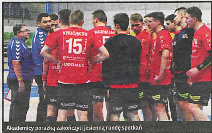
Akademicy porażką zakończyli jesienną rundę spotkań

Zagraliśmy dobry mecz, ale zabrakło zimnej głowy w decydujących momentach. Nasza postawa w Ostrowie jest dobrym prognostykiem przed przyszłoroczną częścią ligowych zmagania.