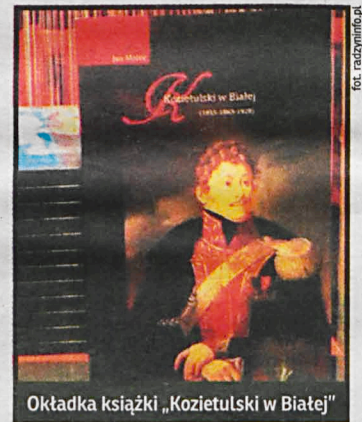
Okładka książki „Kozietulski w Białej”