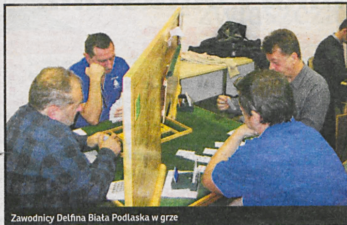
Zawodnicy Delfina Biała Podlaska w grze