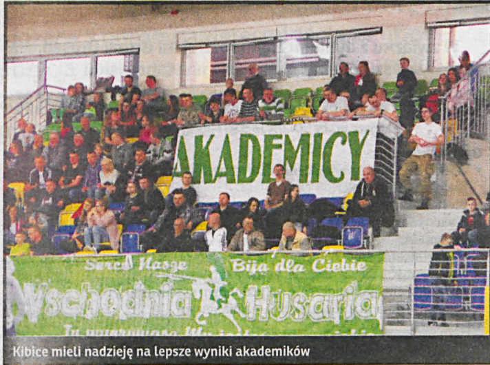
Kibice mieli nadzieję na lepsze wyniki akademików

Za nami pierwsza runda rozgrywek I ligi piłki ręcznej mężczyzn. W roli beniaminka występuje w niej AZS AWF Biała Podlaska.