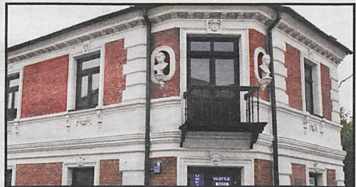
Mural na pustej ścianie kamienicy „Pod Wieszczami” powstanie do czerwca 2017

Konkurs ma charakter otwarty. Tematyka muralu o wymiarach ok. 24,06 m x 9,15 m musi być związana z historią miasta. W projekcie mogą zostać uwypuklone wartości związane z tradycją, ilustrujące jej wpływ na współczesne ży-