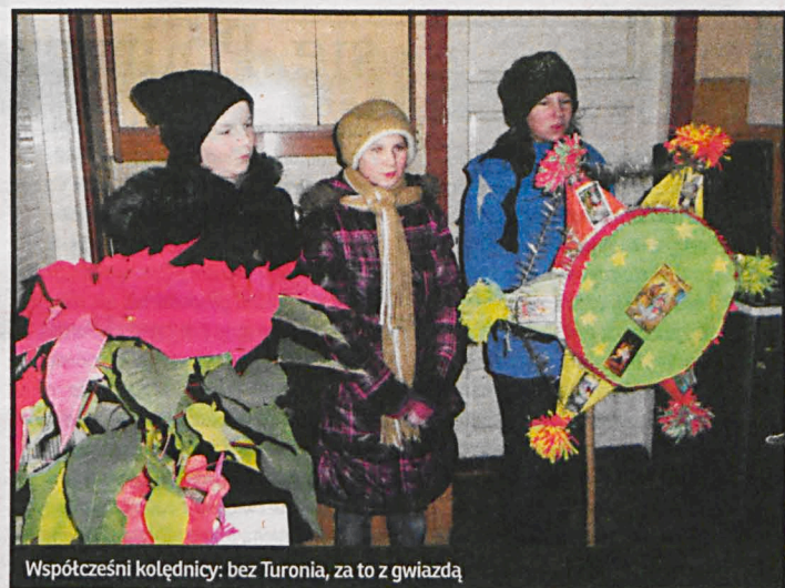
Współcześni kolednicy: bez Turonia, za to z gwiazdą

W dworach szlacheckich przygotowywano dwanaście potraw, czyli tyle ilu było apostołów i miesięcy w roku. Natomiast w chłopskich domach katolickich na Podlasiu liczba potraw musiała być nieparzysta, nie przekraczała zwykłe pięciu lub siedmiu. Potrawy miały być przygotowane z plonów ogrodu, pola, lasu i wody. Z rzadko sporządzanych obecnie pojawiały się wśród nich kutia, kisiel z owsa lub żurawiny, kulebiak, grzyby smażone w cieście. Nie mogło zabraknąć dań z dodatkiem maku, który był symbolem płodności. Potrawy z miodu miały zapewniać ludziom przychylność sił nadprzyrodzonych, z grzybów – ułatwiać nawiązywanie kontaktu ze światem zmarłych. Nie mogło zabraknąć grochu, który – jak wierzono – chronił przed chorobami, a w połączeniu z kapustą był gwarantem urodzaju. Orzechy zaś miały chronić przed bólem zębów.