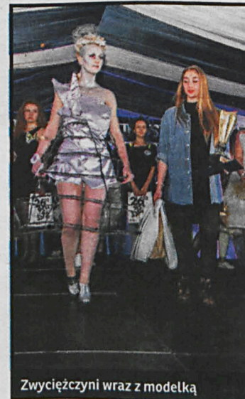
Zwycięczynie wraz z modelką

tygodnik Podlaski tygodnik BEZPŁATNY Nakład 10 000