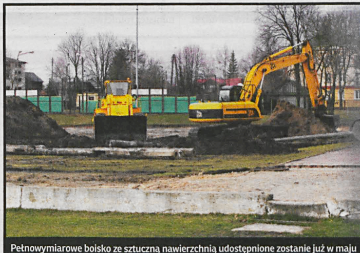
Pełnowymiarowe boisko ze sztuczną nawierzchnią udostępnione zostanie już w maju

Tegoroczna zima była ostatnią, podczas której białscy piłkarze przygotowujący się do sezonu, musieli korzystać z pełnowymiarowych boisk, w miejscowościach gdzie one istniały. Rozpoczęła się bowiem budowa takiego boiska w miejscu dotychczasowego placu treningowego za stadionem MKS Podlasie. To inauguracja inwestycji, dzięki której stadion piłkarski, a raczej jego ruina, przestanie straszyć nie tylko kibiców. Pierwszy etap kosztować będzie 2 mln zł, z czego połowę dofinansuje ministerstwo sportu i turystyki. W mi-