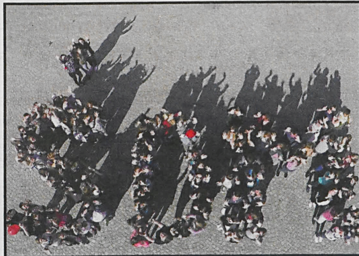
Rejon Biała Podlaska ŚDM organizuje comiesięczne spotkania

wych pochodzących z zewnątrz w budżetach w 2015 roku. Wysoki wskaźnik wskazuje na poziom samodzielności finansowej samorządu, niezależność od sytuacji budżetowej państwa, poziomu bezrobocia, koniunktury gospodarczej, pozwala na planowanie długoterminowych inwestycji. W Polsce większość gmin opiera swe budżety na subwencjach i dotacjach. Wysoką samodzielnością odznacza się tylko 87 samorządów. Ranking opublikował Serwis samorządowy Polskiej Agencji Prasowej.