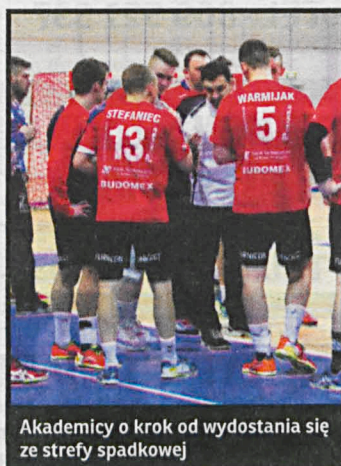
Akademiści o krok od wyostania się ze strefy spadkowej

Zawadzkie – Moto-Jelcz 29:26 Vive II – Ostrovia 25:24 Olimp – Czuwaj 29:32 KSZO – Siódemka 24:24 Tarnów – Olimpia 29:30 Chrzanów – Kościńskie 24:22 Kalisz – AZS AWF 27:21