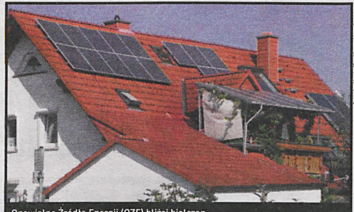
Odnawialne Źródła Energii (OZE) bliżej białczan

Zarząd Województwa Lubelskiego – Instytucja Zarządzająca Regionalnym Programem Operacyjnym Województwa Lubelskiego na lata 2014 – 2020 – uznał protest za zasadny. Białski wniosek otrzy-