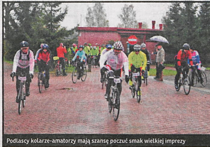
Podlascy kolarze-amatorzy mają szansę poczuć smak wielkiej imprezy

Nowością tegorocznej imprezy jest zapatrzenie wszystkich zawodników w specjalne nadajniki, które pozwolą na śledzenie ich trasy na ekranie komputera bądź innego urządzenia mobilnego. Szczegółowy regulamin, trasa maratonu oraz formularz zgłoszeniowy znajdują się