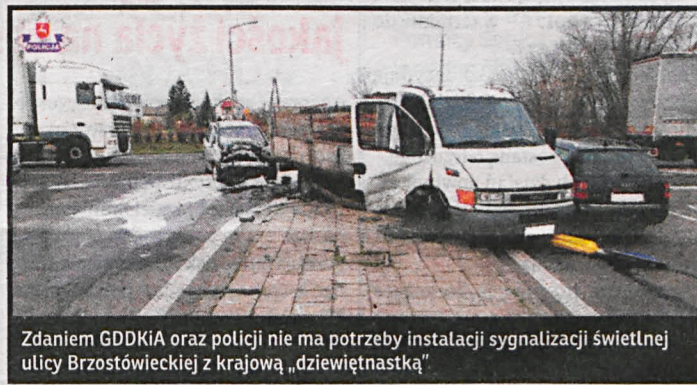
Zdaniem GDDKiA oraz policji nie ma potrzeby instalacji sygnalizacji świetlnej ulicy Brzostówieckiej z krajową „dziewiętnastką”

ciężarówce. 1 osoba została ranna. 5 listopada – w wyniku zderzenia trzech samochodów dwie osoby trafiły do szpitala. 28 stycznia – ciężarówka potrąciła 73-latkę, który zginął na miejscu. Zastępca rzecznika radzyńskiej komendy poinformował nas ponadto, że przebudowa tego skrzyżowania w roku ubiegłym oraz obecne poziome i pionowe jego oznakowanie zapewniają uczestnikom ruchu drogowego wystarczające