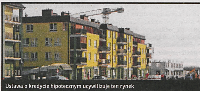
Ustawa o kredycie hipotecznym ucywilizuje ten rynek

jeżeli kredytobiorca nie będzie uzyskiwał dochodu w tej walucie.