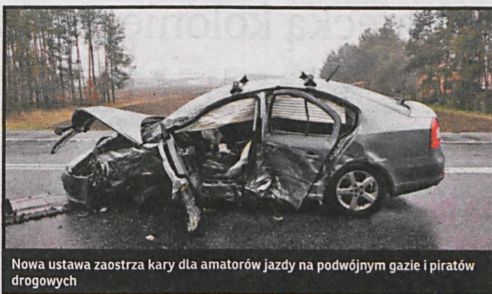
Nowa ustawa zaostrza kary dla amatorów jazdy na podwójnym gazie i piratów drogowych

1000 sprawców groźnych wykroczeń drogowych (w tym 150 kolizji i 320 przekroczeń prędkości) nie spotkała kara, bo ich sprawy się przedawniły. Spośród prawie 1400 osób, które skazano za jazdę bez prawa jazdy odebranego decyzją ad-