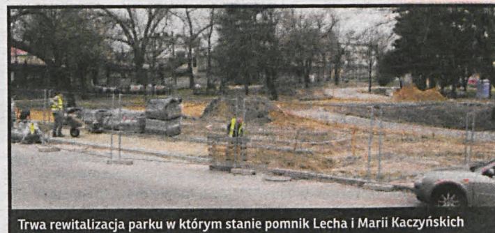
Trwa rewitalizacja parku w którym stanie pomnik Lecha i Marii Kaczyńskich

Pomnik powstaje wyłącznie ze środków pozyskiwanych drogą dobrowolnych wpłat osób prywatnych oraz instytucji.