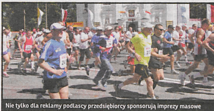
Nie tylko dla reklamy podlascy przedsiębiorcy sponsorują imprezy masowe

– W sponsorowaniu imprez sportowych więcej jest idei, aniżeli profitów. Owszem, prawdą jest to, że sponsoring przynosi reklamę mojej firmie. Kluczową jednak rolę w tym, że pomagam finansowo w organizowaniu imprez sportowych, odgrywa altruizm. Widzę bowiem w tym dobro człowieka. Sport pomaga