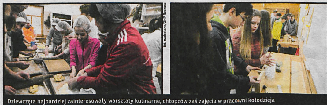
Dziewczeta najbardziej zainteresowały warsztaty kulinarne, chłopców zaś zajęcia w pracowni kołodzieja

Centrum Kształcenia i Wychowania OHP w Roskoszy odwiedziła młodzież szkolna, w ramach projektu pod hasłem „Pozytywnie regionalni”, prowadzonego wraz ze Stowarzyszeniem Biała Pozytywka.