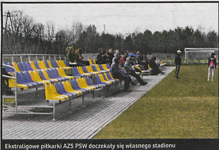
Ekstraligowe piłkarski AZS PSW doczekali się własnego stadionu