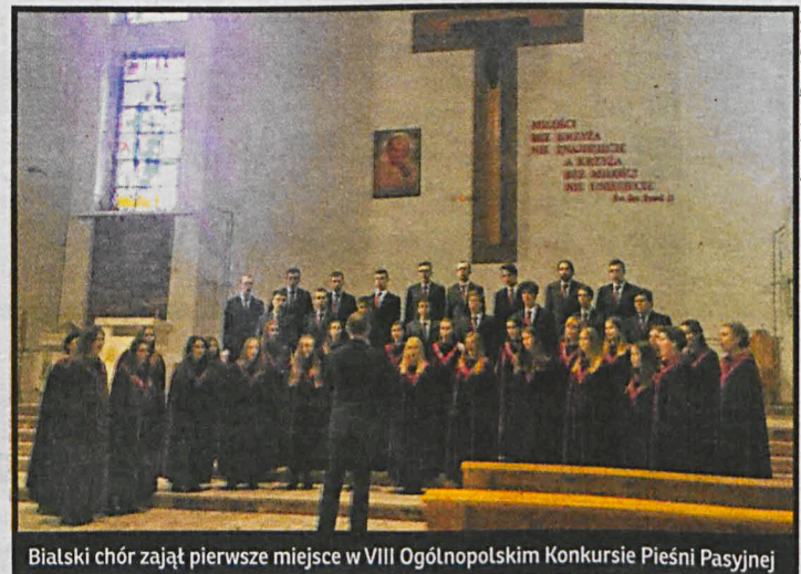
Bialski chór zajął pierwsze miejsce w VIII Ogólnopolskim Konkursie Pieśni Pasyjnej