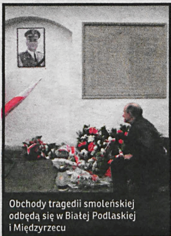
Obchody tragedii smoleńskiej odbędą się w Białej Podlaskiej i Międzyrzeczu