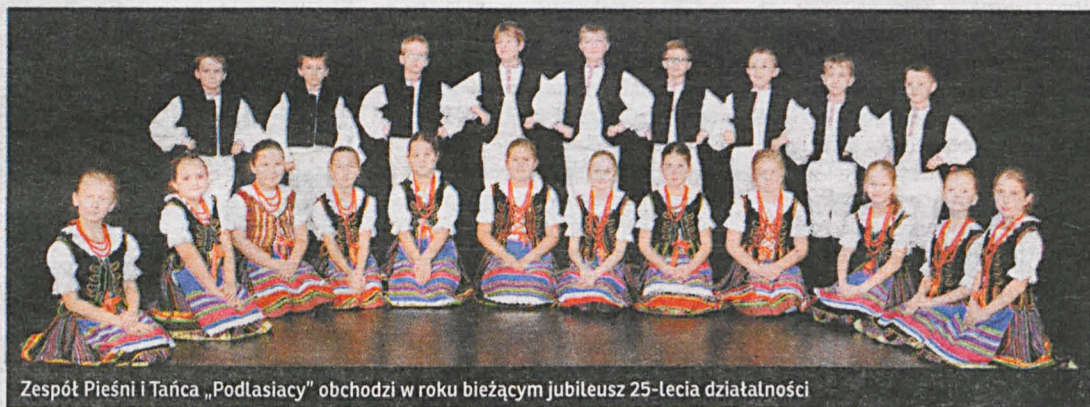
Zespół Pieśni i Tańca „Podlasiacy” obchodzi w roku bieżącym jubileusz 25-lecia działalności

O godz. 18 zostaną zaprezentowane publiczności grupy taneczne, działające w Bialskim Centrum Kultury.