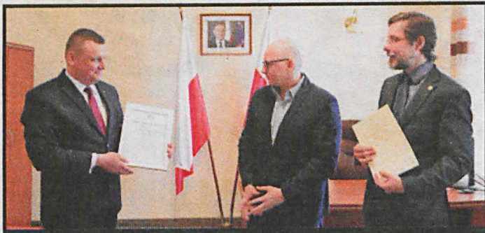
W województwie lubelskim zakończono przekazywanie gruntów Lasom Państwowym