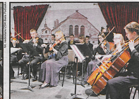
„Muzyka u Radziwiłłów” czyli comiesięczne koncerty muzyki klasycznej cieszą się wśród białczan coraz większą popularnością