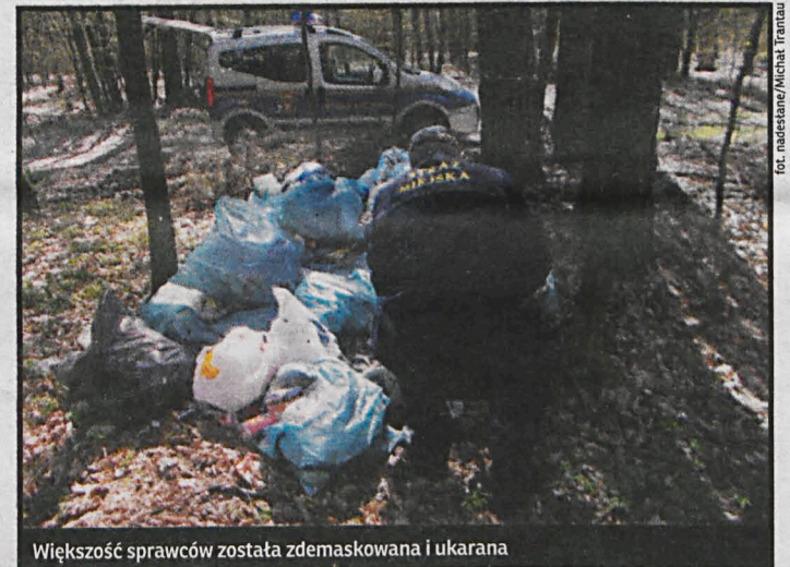
Większość sprawców została zdemaskowana i ukarana

Obcokrajowcy zazdroszczą nam nieskrępowanego wstępu do lasów. Tymczasem bywają wśród nas tacy, którzy traktują je jako wysypisko śmieci. Strażnicy miejscy wypowiedzieli im wojnę. W ostatnich dniach odkryli oni ponad 20 dzikich wysypisk śmieci, powstałych na obrzeżach miasta, głównie w lasach, ale też na łąkach oraz w okolicach ogródków działkowych. Większość sprawców została zdemaskowana i ukarana. Strażnicy dotarli do nich za pomocą dokumentów znalezionych w pozostawionych w nieczystościach. Zidentyfikować winowajców pomogły znalezione wśród nich rachunki, dowody wpłat oraz korespondencja. Winni to w większości mieszkańcy domów jed-