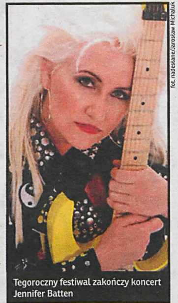
Tegoroczny festiwal zakończy koncert Jennifer Batten