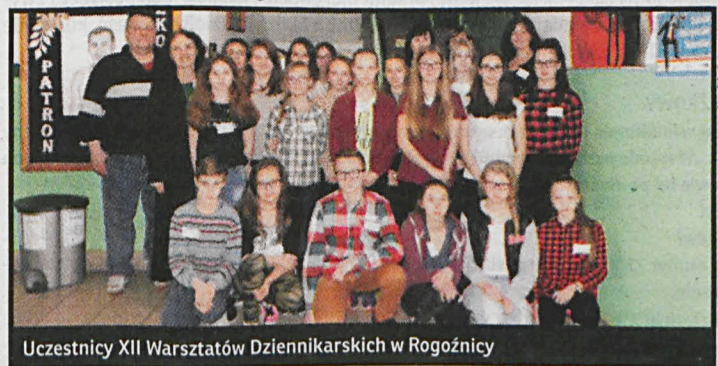
Uczestnicy XII Warsztatów Dziennikarskich w Rogoźnicy

– To właśnie oni w ciągu jednego pokolenia zbudowali w niewolniczych warunkach sięgający nieba pustynny Manhattan. Tego turysta nigdy nie zobaczy, bo mogłoby to wysadzić w powietrze kreowany przez lata mit Dubaju – powiedział podróżnik, dla którego pierwszy pobyt w Dubaju był spełnieniem obietnicy danej żonie przed 37 laty: wspólnej luksusowej wyprawy. PG