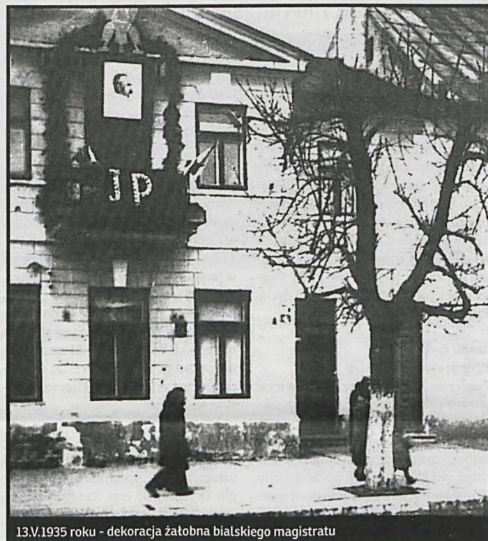
13.V.1935 roku - dekoracja żałobna biańskiego magistratu