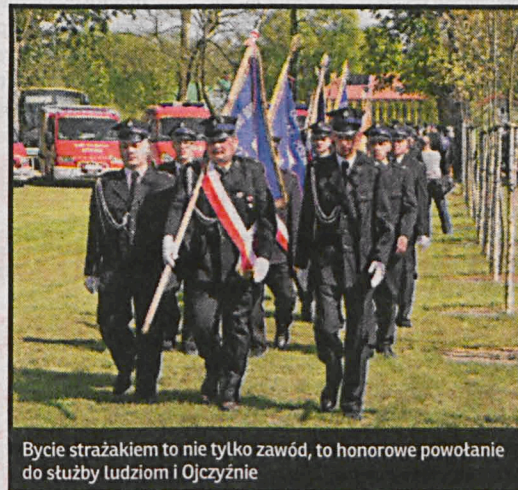
Bycie strażakiem to nie tylko zawód, to honorowe powołanie do służby ludziom i Ojczyźnie