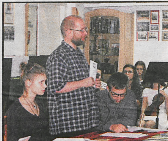
Przyjaźń jest tym, co najbardziej łączy ludzi „Skafandra”

Nieformalnym patronem Podlaskiej Grupy Poetyckiej „Skafander” jest Karol Wojtyła. Poeta, który potrafił połączyć tworzenie poezji wysokiej próby z postawą osoby mądrej życiowo. „Cenimy również poezję Wojciecha Bąka, Kazimierza Iłkowiaczówny, Jana Twardowskiego, Wojciecha Wencła oraz Konstantego Ildefonsa Gałczyńskiego. To głównie ci autorzy nas kształto-