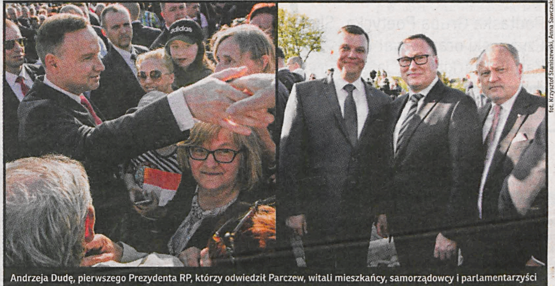
Andrzeja Dudę, pierwszego Prezydenta RP, którzy odwiedził Parczew, witali mieszkańcy, samorządowcy i parlamentarzyści