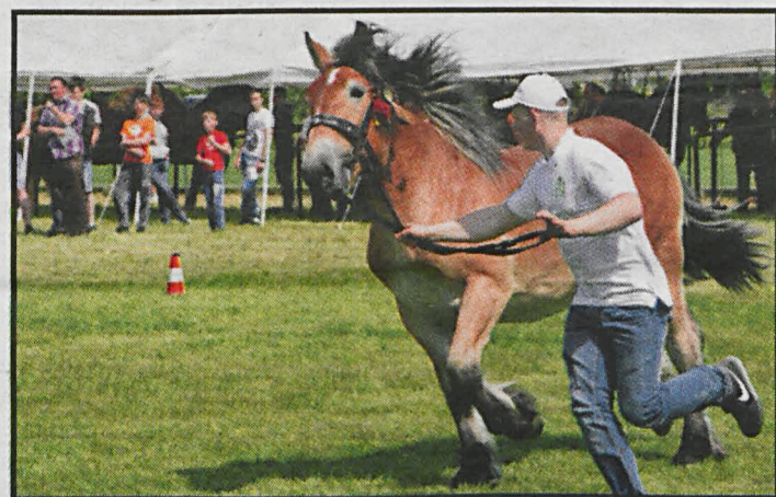
Konie zimnokrwiste coraz rzadziej pracują, ale ich hodowla nie zanika