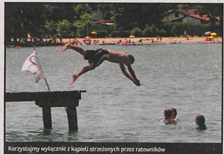
Korzystajmy wyłącznie z kąpeli strzeżonych przez ratowników

Las w gorące dni kusi nie tylko cieniem. Wkrótce zacznie się wysyp jagód i grzybów. Krótkie spodenki i takaż koszulka nie są dobrym pomysłem. Kleszczy jest w tym roku więcej niż dotych-