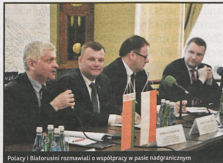
Polacy i Białorusini rozmawiali o współpracy w pasie nadgranicznym

W części merytorycznej spotkania przedstawiono aktualną sytuację, związaną z zagrożeniami jakimi jest występowanie chorób infekcyjnych i pasożytniczych na terenach przygranicznych (m.in. chorób przenoszonych