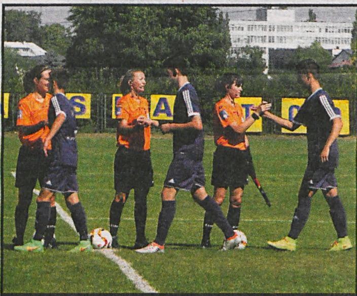
Pożegnaliśmy CLJ. Miejmy nadzieję, że tylko na jeden sezon