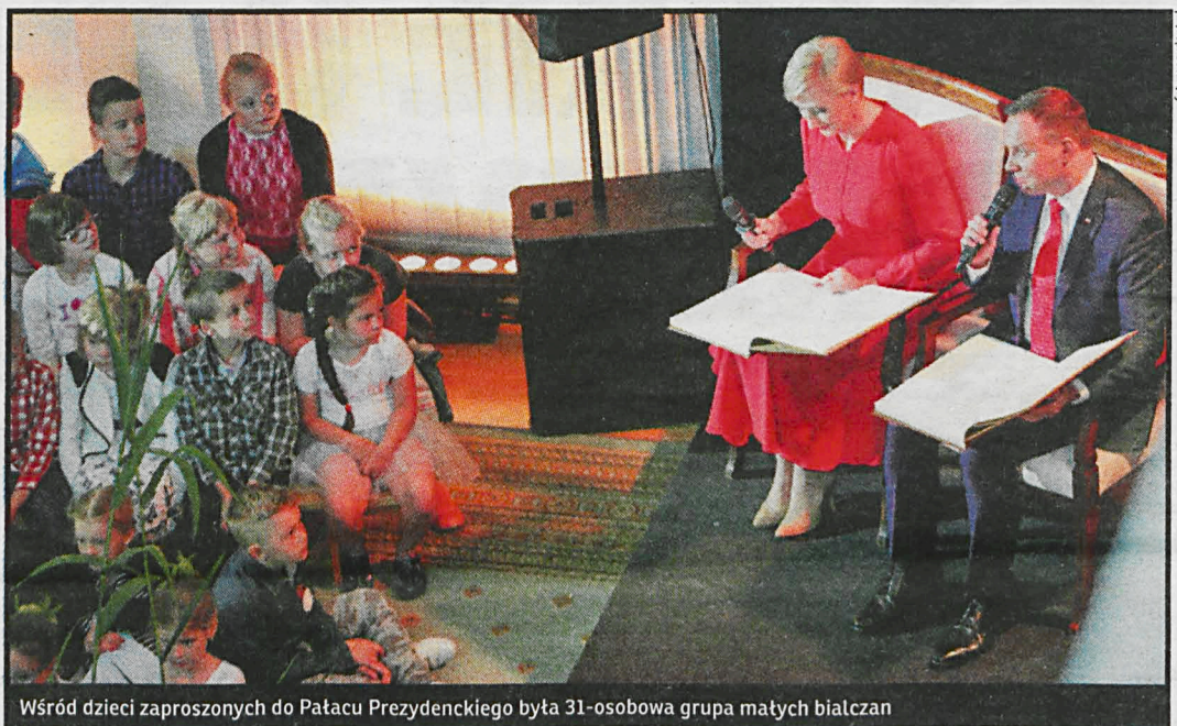
Wśród dzieci zaproszonych do Pałacu Prezydenckiego była 31-osobowa grupa małych białczan

31-osobowa małych białczan spędziła Dzień Dziecka w Pałacu Prezydenckim. Prezydent RP życzył najmłodszym obywatelom w dniu ich święta realizacji wszystkich marzeń i planów, powodzenia, miłości, przyjaźni. – Jesteście najważniejsi, jesteście przyszłością naszego kraju – powiedział Andrzej Duda.