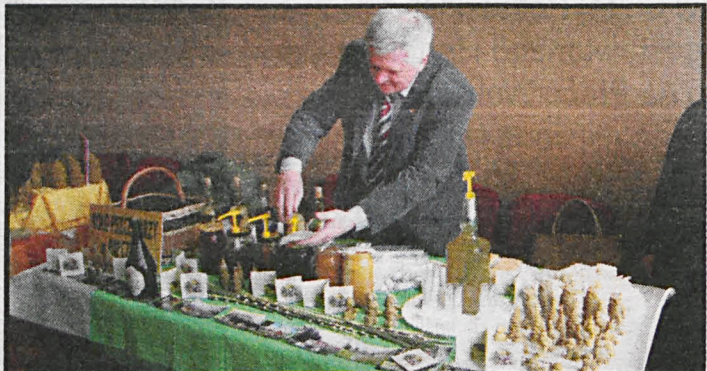
Stymulacja przedsiębiorczości, organizacja imprez kulturalnych, szkoleń, remonty świetlic wiejskich to kierunki działań LGD „Jagiellońska Przystań”