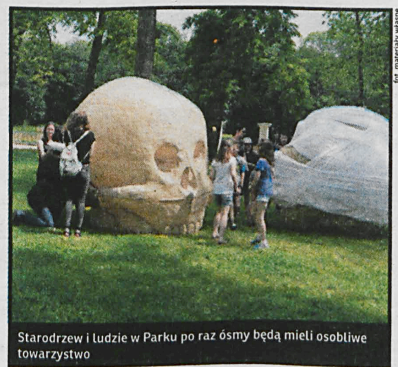
Starodrzew i ludzie w Parku po raz ósmy będą mieli osobiście towarzystwo