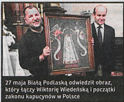
27 maja Białą Podlaską odwiedził obraz, który łączy Wiktorię Wiedeńską i początki zakonu kapucynów w Polsce

Sejm Rzeczypospolitej Polskiej ustanowił rok 2017 m.in. Rokiem Honorata Koźmińskiego – teologa, prezbitera, założyciela 26 wspólnot religijnych, którego Jan Paweł II wyniósł 16 października 1988 r. na ołtarze. – Ojciec Honorat jest wielką postacią. Trzeba, aby poznał Go cały Kościół – powiedział wówczas Ojciec Święty.