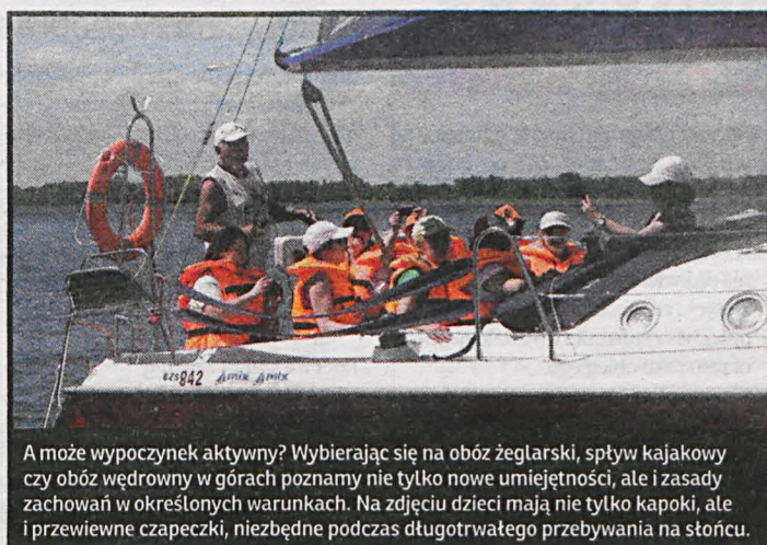
A może wypoczynek aktywny? Wybierając się na obóz żeglarski, spływ kajakowy czy obóz wędrowny w górach poznamy nie tylko nowe umiejętności, ale i zasady zachowań w określonych warunkach. Na zdjęciu dzieci mają nie tylko kapoki, ale i przewiewne czapeczki, niezbędne podczas długotrwałego przebywania na słońcu.

Nieoceniony jest tak dla rodziców, jak i dzieci jest wspólny wyjazd wakacyjny. I jedni i drudzy mają więcej czasu dla siebie. Dorośli nie mogą wymówić się nawałem obowiązków, dzieciaki pod byle pozorem nie mogą uciec przed komputerem. Tyle, że dorośli nie mają dwóch miesięcy wakacji. W pozostałym okresie trzeba zapewnić miłusińskim odpowiednią opiekę. Jeszcze jest na to czas. W 2016 roku na polskich drogach zginęło 72 dzieci w wieku do 14 lat. Nie można zakładać, że piratów i amatorów jazdy na podwójnym gazie przestraszy obowiązujące od 1 czerwca br. zaostrzenia przepisów wobec nich.