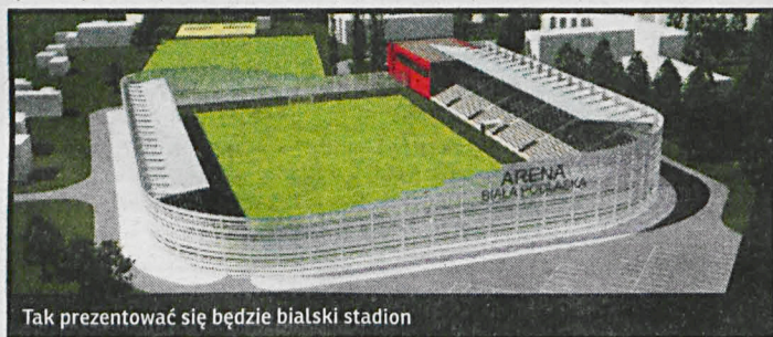
Tak prezentować się będzie białki stadion

tys. na zachodniej z możliwością rozbudowy o ok. 1,7 tys. na trybunie południowej i ok. 1,3 tys. na północnej. Łącznie ok. 7,8 tys. zadaszonych miejsc z zapleczem sportowo-socjalno-magazynowym pod trybunami. Hala sportowa, z której skorzystają uczniowie Ekonomika będzie miała wymiary 45 na 25 metrów. W planach jest również zaplecze sportowe: siłownia, fitness i odnowa biologiczna. W projekcie nie brakuje parkingów na 250 samochodów, miejsc dla niepełnosprawnych i autokarów. Zaprojektowano także drogi dojazdowe, pełniące zarazem funkcję drogi pożarowej. Nowy stadion będzie prezentował się okazałe także z zewnątrz. Fasadę stadionu stanowią panele aluminiowe w kolorze perłowo-białym. Prace mogą rozpocząć się jeszcze w tym roku.