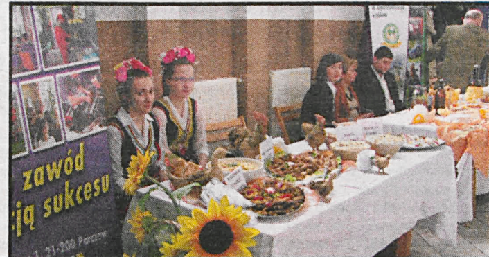
Stymulacja przedsiębiorczości, organizacja imprez kulturalnych, szkoleń, remonty świetlic wiejskich to kierunki działań LGD „Jagiellońska Przystań”

ści, inicjatyw lokalnych i regionalnych: jarmarki pszczelarskie „Jagiellońskie Smaki i Prysmaki”, konkursy „Zostań przedsiębiorcą”, a także wydawała publikacje promujące obszar działania. Grupa stara się pozyskać środki ze