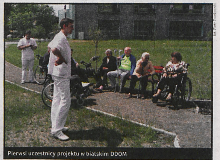
Pierwsi uczestnicy projektu w bialskim DDOM

Podczas pobytu ośrodek zapewnia rehabilitację, zabiegi fizjoterapeutyczne, ćwiczenia usprawniające i gimnastykę, opiekę wykwalifikowanego personelu, pomoc pielęgniarstwa, terapię zajęciową, konsultacje lekarskie, posiłki,