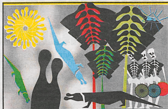
Inspirację grafik zawartych w książce „Puzzle afrykańska figurka” była fotografia afrykańskiej rzeźby. Na zdjęciach prace: Ziemia (powyżej) oraz Dama z... (fragment – poniżej)