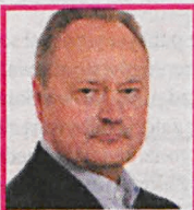
JANUSZ SZEWCZAK Posel PIS