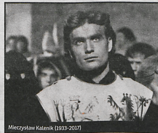
Mieczysław Kalenik (1933-2017)

Mieczysław Kalenik urodził się w Międzyrzeczu. Po ukończeniu warszawskiej Państwowej Wyższej Szkoły Teatralnej związał się z warszawskimi teatrami: Komedią, Powszechnym, Narodowym, Nowym i Polskim, w którym występował do 2000 r. Sławę i rozpoznawalność przyniosła mu rola Zbyszka z Bogdańca w filmie „Krzyżacy”, polskiej superprodukcji wszechczasów. Obraz ten obejrzało w pierwszym tygodniu po premierze w 1960 r. 5 mln widzów, a ogółem – 30 mln. Rola ta stała się dla Mieczysława Kalenika swoistym przekleństwem, podobnie zresztą jak dla Grażyny Staniszewskiej – Danusi oraz Urszuli Modrzyńskiej – Jagienki. Aktor wystąpił w ponad 40 filmach, zwykle jednak były to postacie drugiego planu. Mogliśmy go ujrzeć m.in. w Stawce większej niż życie, Hrabinie Cosel, Lalce, Czterdziestolatku, Polskich Drogach czy Panu Tadeuszu, w którym zagrał Stolnika.