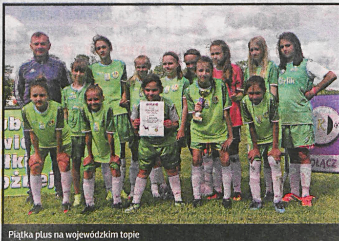
Piątka plus na wojewódzkim topie