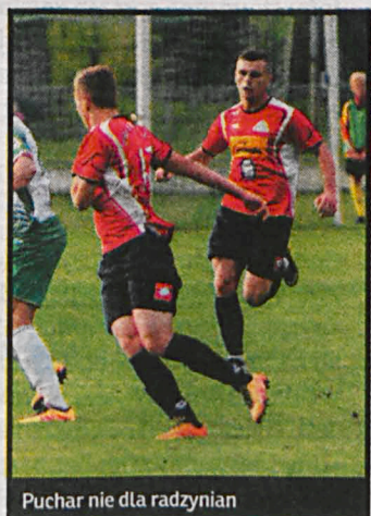
Puchar nie dla radzyńian