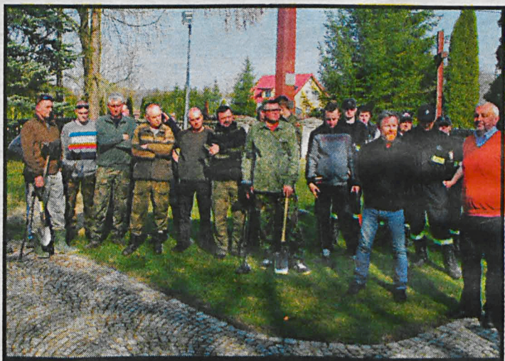
Rozpoczęte wiosną poszukiwania unickiego dzwonu będą kontynuowane

W trakcie tegorocznych poszukiwań nie odnaleziono drugiego, większego dzwonu, ale efekty prac i tak są zaskakujące. Wewnątrz świątyni znaleziono cztery krzyże z XVIII – XIX wieku oraz złożone elementy dawnego ołtarza. Na zewnątrz zaś – kilkanaście gockich stanowisk grobowych. Goci to lud zamieszkujący pierwotnie tereny południowej Szwecji, który na początku naszej ery rozpoczął ekspansję terytorialną na południe, w poszukiwaniu lepszych warunków życia, respektując przy tym stan posiadania tubylczej ludności i za-