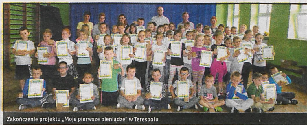
Zakończenie projektu „Moje pierwsze pieniądze” w Terespolu

W IX edycji projektu „Moje pierwsze pieniądze” w roku szkolnym 2016/2017 udział wzięło 150 uczniów trzech szkół