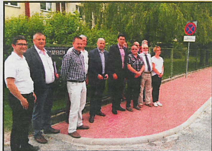
W czerwcu br. w Białej Podlaskiej ukończono pierwszą inwestycję w ramach budżetu obywatelskiego 2017 – chodnik przy ul. Spółdzielczej

Spotkanie informacyjne dotyczące budżetu obywatelskiego odbędzie się w poniedziałek 3 lipca o godz. 16 w sali konferencyjnej UM. Swoje propozycje na co przeznaczyć 100 tys. zł mieszkańcy będą mogli składać od 4 lipca do 4 sierpnia. Formularze zgłoszeniowe będą dostępne od 3 lipca na stronie internetowej www.radzyn-podl.pl oraz – w wersji papierowej – w UM.