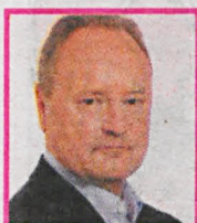
JANUSZ SZEWCZAK Poseł PIS

W przypadku mechanizmu Pomoc na wyrównywanie ceny sprzedaży dla producentów świń (strefa objęta restrykcjami z tytułu ASF), wnioski o udzielenie pomocy w odniesieniu do świń sprzedanych w okresie do dnia 1 maja 2017 r. do dnia 30 czerwca 2017 r. można składać w terminie do 21 lipca 2017 r. Szczegółowe informacje dotyczące udzielenia pomocy producentom świń dostępne są na stronie Agencji Rynku Rolnego www.arr.gov.pl , pod nr tel. (22) 661 72 72 oraz siedzibie Oddziału Terenowego ARR w Lublinie (ul. Leszka Czarnego 3, tel. (81) 536 37 00).