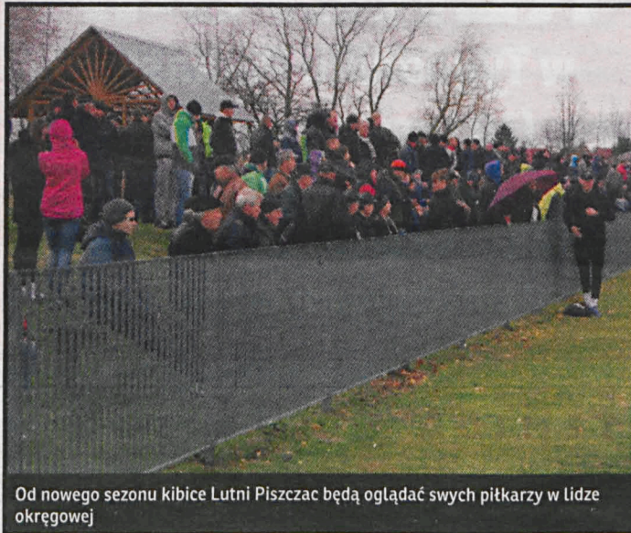
Od nowego sezonu kibice Lutni Piszczac będą oglądać swych piłkarzy w lidze okręgowej

cja. A klasa będzie się składać z dwóch grup wschodniej i zachodniej. Awans do niej wywalczyły trzy ekipy z Grupy I i cztery z Grupy II Klasy B: SRG Sławatyczne, Młodzieżówka Radzyń Podlaski, Twierdza Kobylany, ULKS Dębowica, Orłęta Gołyszyn, Polesie Serokomla i Sokół Krynka. Mimo, że drugie miejsce w Grupie I zajęła Lutnia II Piszczac, to nie może ona wywalczyć awansu do Klasy A ze względu na to, że pierwsze ekipa z Piszczaca grać będzie w lidze okręgowej. Zgodnie zaś z przepisami pierwszą a drugą ekipę jednego klubu muszą dzielić dwie klasy rozgrywkowe.