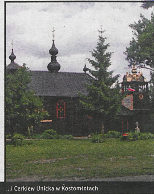
...i Cerkiew Unicka w Kostomłotach