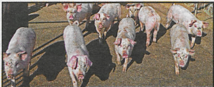
O pomoc finansową w ramach nadzwyczajnych środków wspierania rynku wieprzowiny w Polsce mogą ubiegać się producenci świń, którzy utrzymywali świnie zgłoszone do rejestru zwierząt gospodarskich

Od 17 lutego 2014 r. odnotowano w Polsce 40 ognisk ASF, a z tej liczby 17 przypadków w roku bieżącym (w tym 8 w powiecie bialskim: Woskrzeńce Duże, Mariampol, Stare Buczyce, Witulin – 2 ogniska, Komarno, Ludwinów, Zalesie). Rozgoryczenie wśród podlaskich hodowców budzi konieczność wybijania przez służby weterynaryjne w obszarach zapowietrzonych (ok. 3 km od ogniska) zdrowych sztuk świń oraz brak mechanizmów regulujących liczebność dzików, które są rezerwuarem wirusa. Zdaniem rolników populacja dzików powinna być całkowicie zlikwidowana, jak stało się to na Białorusi.