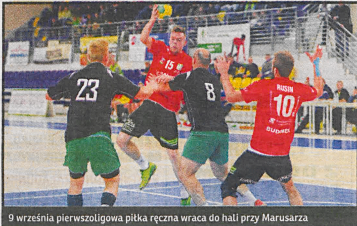
9 września pierwszoligowa piłka ręczna wraca do hali przy Maruszarza

trwają od 3 lutego do 2 czerwca. Znamy także terminy Pucharu Polski: 31 stycznia – 1/16, 7 marca – 1/8, 14 marca – 1/4. Półfinały rozegrane zostaną 28 marca i 11 kwietnia, a finał 12 maja. Białczanie wkrótce rozpoczną przygotowania do nowego sezonu.