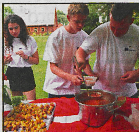
Międzynarodowy dialog kultur zaowocował warsztatami – również kulinarnymi – i kręceniem ujęć do filmu, który stanie się ich plonem

Młodzież odwiedziła również bialski Ośrodek dla Cudzoziemców, gdzie poznali warunki, w jakich mieszkają uchodźcy, następnie przeprowadzili zajęcia integracyjne na świeżym powietrzu. Malowanie twarzy, rozgrywki sportowe, zabawy z chustą animacyjną, zajęcia plastyczne, konkurs piosenki czy rysowania z największym entuzjazmem przyjęli najmłodsi mieszkańcy ośrodka. Dorośli natomiast wyrażali wdzięczność za wspólnie spędzony czas, okazane zrozumienie i życzliwość oraz podarowaną radość i chwile beztrudności ich pociechom.