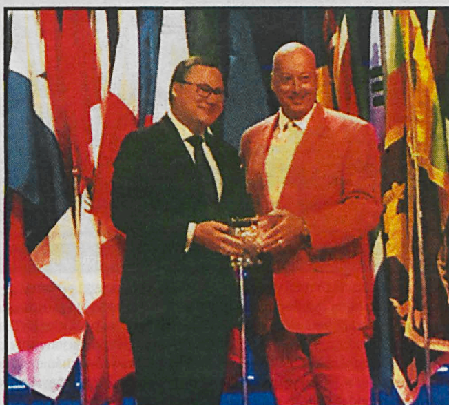
Senator Grzegorz Bierecki odbiera nagrodę DSA podczas dorocznej konferencji Światowej Rady Związków Kredytowych