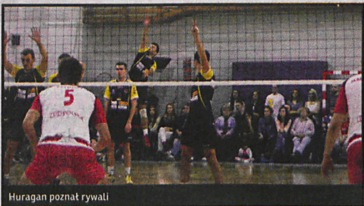
Huragan poznał rywali

zakończy się 17 marca. Poza międzyrzeszaczanami w grupie II zagrają: Energa Ostrołęka, BAS Białystok, AZS UWM II Olsztyn, Legia Warszawa, KS Metro Warszawa, UMKS MOS Wola Warszawa, Lesan Halinów, UKS Centrum Augustów, Czołg AZS Uniwersytet Warszawski i MUKS Huragan Wołomin.