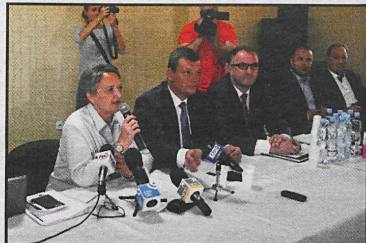
W ostatnich dniach odnotowano kolejne przypadki ASF w gminach: Kąkolewnica, Włodawa, Międzyrzec Podlaski i Platerów

– Niestety, pojawienie się ostatnich ognisk choroby w naszym województwie spowodowane było działalnością człowieka, swego rodzaju nieostrożnością. Musimy wspólnie zrobić wszystko, by