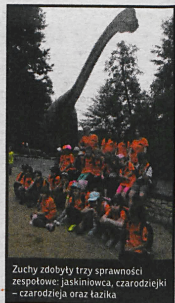
Zuchy zdobyły trzy sprawności zespołowe: jaskiniowca, czarodziejki – czarodzieja oraz łazika