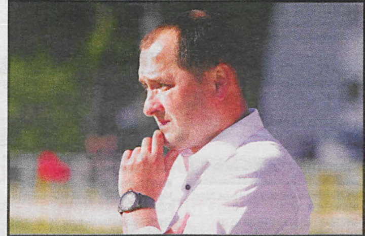
Panie z AZS PSW w kolejny sezon ekstraklidy wchodzą pod wodzą nowego trenera