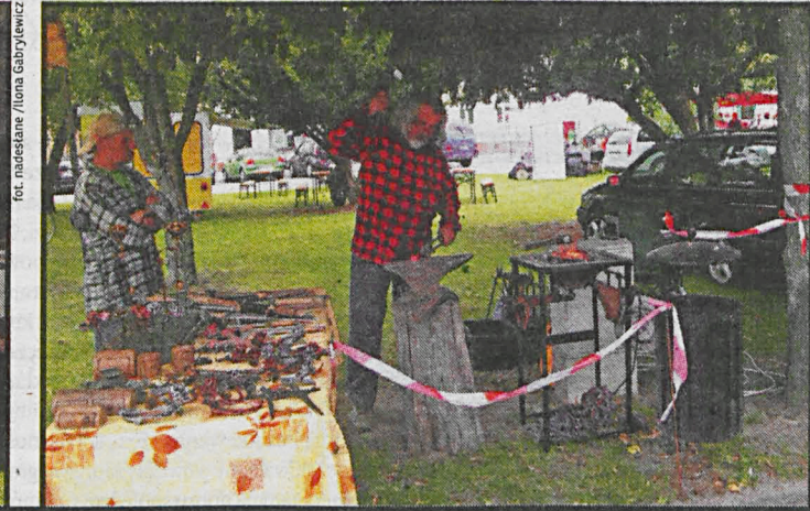
Formuła jarmarku różni się od tej z dawnych wieków. Obecna impreza jest festiwalem twórczości ludowej, artystycznej i rzemieślniczej

giellonów i wreszcie to tutaj nastąpiło przyjęcie przez króla Zygmunta Augusta uchwał Soboru Trydenckiego, które zadecydowało o tym, że Polska stała się państwem katolickim. Te wszystkie lata sprawiły, że w Parczewie prężnie rozwinął się handel. W 1570 roku pra-