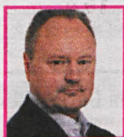
JANUSZ SZEWCZAK Poset PiS