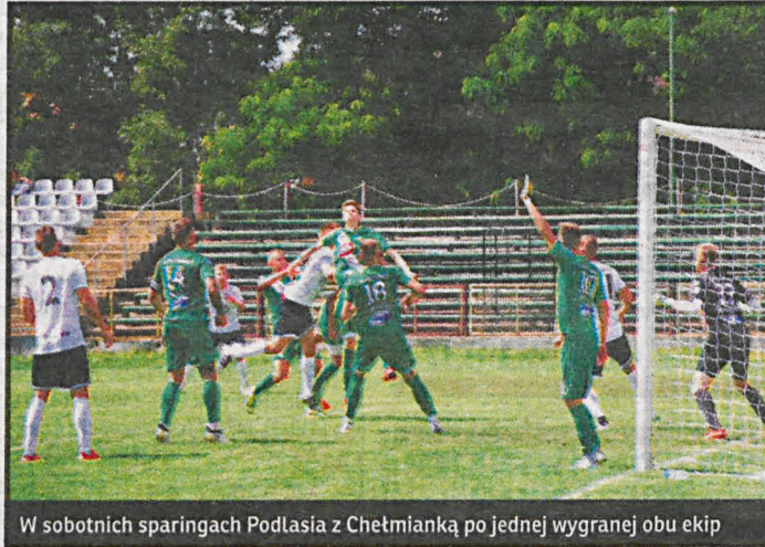
W sobotnich sparingach Podlasia z Chełmianką po jednej wygranej obu ekip

Podlasie rozegrało dwa sparingi z Chełmianką. Trenerzy podzieli swoje ekipy na dwie drużyny. W pierwszej konfron-