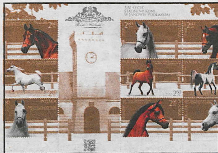
31 lipca br. Poczta Polska wydała z okazji 200-lecia Stadniny Janowskiej specjalną emisję dziewięciu znaczków

Tegoroczne Święto Konia Arabskiego, które odbywać się będzie w dn. 11 – 15 sierpnia, towarzyszy obchodom 200-lecia stadniny w Janowie Podlaskim. Najważniejszym punktem wydarzenia będzie trwający od piątku (od godz. 15) do niedzieli (w sobotę i niedzielę) czempionaty rozpoczynając się będą od godz. 10) w janowskiej stadninie XXXIX Narodowy Pokaz Koni Arabskich Czystej Krwi, podczas którego międzynarodowy skład sędziowski oceni konie w 11 klasach wiekowych. W niedzielę o godz. 17 rozpocznie się 48 aukcja Pride of Poland, w której udział zapowiedzieli goście ze Zjednoczonych Emiratów Arabskich, Arabii Saudyjskiej, Kataru, Kuwejtu, Chin, Niemiec Włoch, Rumunii i Szwecji. W poniedziałek zaś od godz. 10 trwać będzie Summer Sale – Letnia Aukcja Koni Arabskich. Świętu Konia Arabskiego towarzyszyć będzie kiermasz