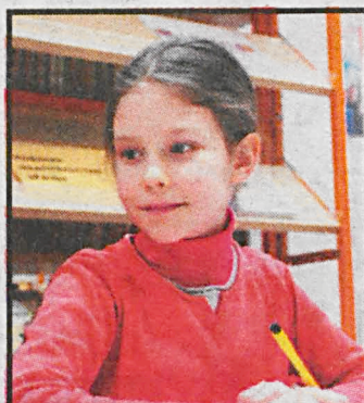
W tym roku do dzieci z rodzin znajdujących się w najtrudniejszej sytuacji trafi 1665 tornistrów

– Dzięki akcji, obdarowane dzieci zaczną