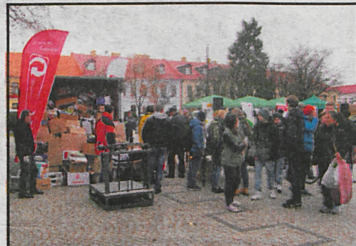
W ubiegłym roku zebraliśmy 13,5 tony makulatury, jakie będą wyniki tegorocznej „Makulatury na drzewo”?

– Zapraszamy przedszkola, szkoły i mieszkańców naszego miasta do