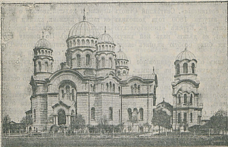
Каѳедральный соборъ въ Ригѣ.

предъ Министерствомъ Внутреннихъ Дѣлъ, въ концѣ декабря 1875 года Высочайше отпущены были средства изъ Государственнаго Казначейства на сооруженіе новаго каѳедральнаго собора въ г. Ригѣ. Постройка соборнаго храма продолжалась около 8 лѣтъ. Заложенный 3 іюня 1876 года, новый каѳедральный соборъ торжественно былъ освященъ 28 октября 1884 года во имя Рождества Христа Спасителя.