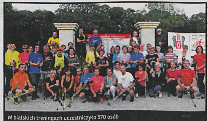
W białskich treningach uczestniczyło 570 osób

Akademia Zdrowia Santandera to ogólnopolska akcja, której celem jest propagowanie ruchu i zdrowego trybu życia. Ambasadorami Akademii Zdrowia Santandera są Justyna Kowalczyk, pięciokrotna medalistka olimpijska w biegach narciarskich i czterokrotna zdobywczyni Kryształowej Kuli, a także znani polscy aktorzy Tamara Arciuch i Bartłomiej Kasprzykowski. Podczas cotygodniowych, wtorkowych zajęć prowadzonych od maja do sierpnia br. spotykali się zarówno amatorzy,