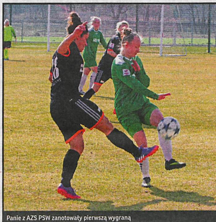
Panie z AZS PSW zanotowały pierwszą wygraną