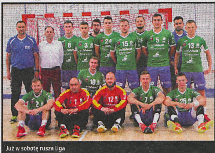
Już w sobotę rusza liga