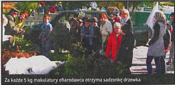
Za każde 5 kg makulatury ofiarodawca otrzyma sadzonkę drzewka