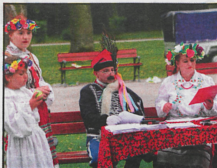
„Wesele” czytano m.in. w Białej Podlaskiej, Radzynie, Międzyrzecu, Rzeczy i w Ulan – Majoracie