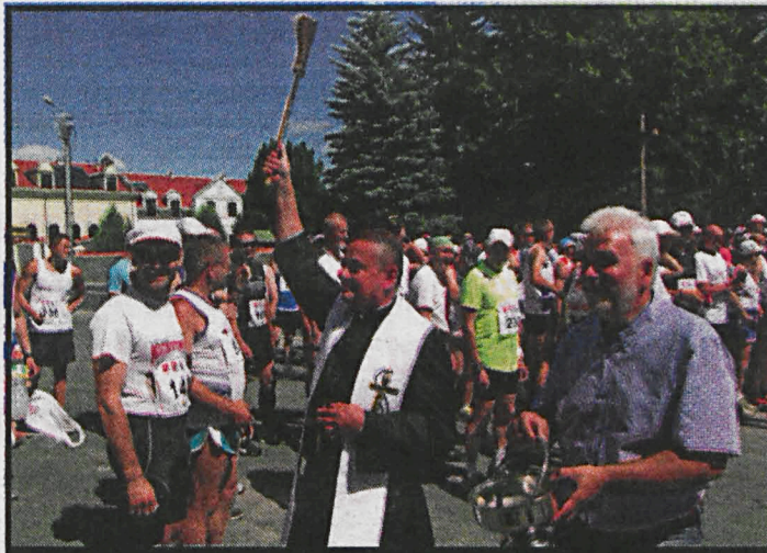
Wśród zawodników „Bieg Sapiehów” zastępną z tego, że na starcie przed bazyliką żegnał ich ksiądz z kropidłem, a na mecie czekał na wszystkich dwudaniowy obiad