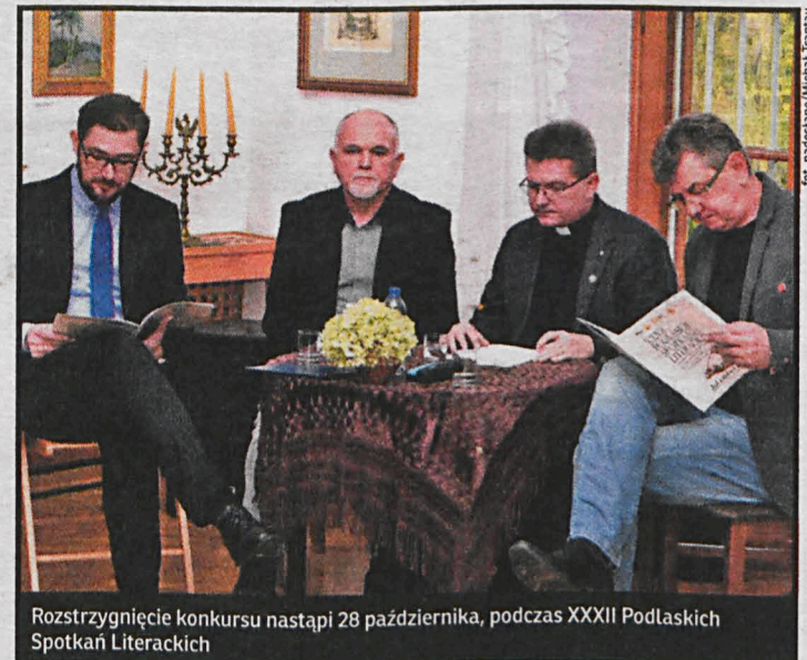
Rozstrzygnięcie konkursu nastąpi 28 października, podczas XXXII Podlaskich Spotkań Literackich

Autorzy trzech najlepszych prac w obu kategoriach otrzymają nagrody finan-