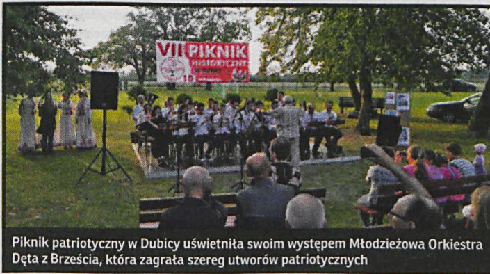
Piknik patriotyczny w Dubicy uświetniła swoim występem Młodzieżowa Orkiestra Dęta z Brześcia, która zagrała szereg utworów patriotycznych