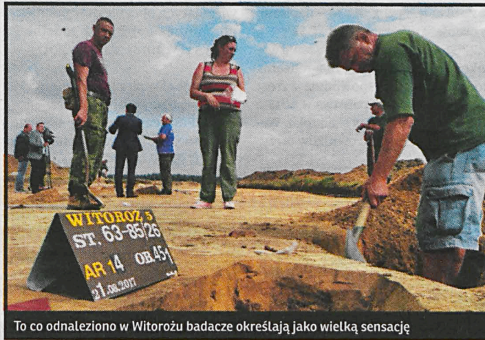
To co odnaleziono w Witorożu badacze określają jako wielką sensację

Podczas prac wykopaliskowych w Szóstce nie znaleźli śladów jednoznacznie świadczących o istnieniu tam cmentarzyska bądź osady z okresu rzymskiego. W wykopie sondazowym znaleziono