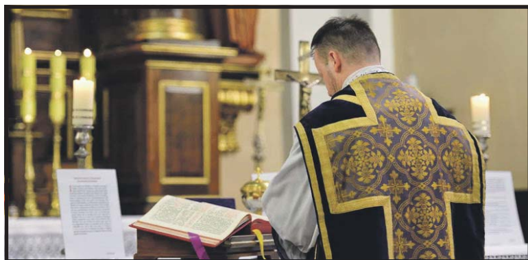
Msza trydencka sprawowana jest w każdą niedzielę o godz. 13.30 w białskim kościele św. Antoniego