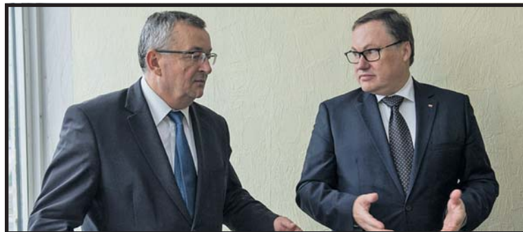
Jestem przekonany, że w 2024 roku pojedziemy autostradą A2 do Białej Podlaskiej – powiedział minister infrastruktury i budownictwa Andrzej Adamczyk

– Po programie Mieszkanie Plus, podstrefie ekonomicznej, infrastrukturze drogowej i sportowej to kolejna okazja do podkreślenia dobrej współpracy Białej Podlaskiej z rządem. Dowodzimy, że