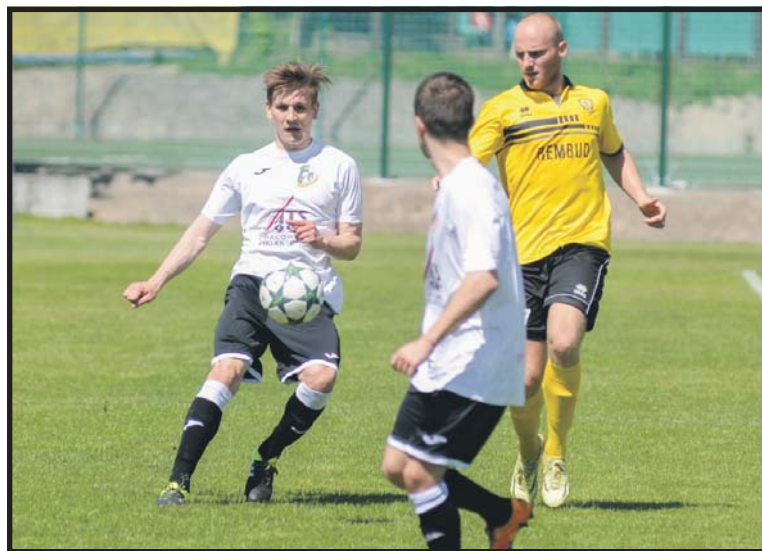
Podlasie przywiozło swoje pierwsze punkty z wyjazdu w tym sezonie

względu na potyczki reprezentacji narodowej. W sobotę o godz. 12 akademiczki na własnym obiekcie zmierzą się z zespołem łódzkiego SMS-u. Rywalki –