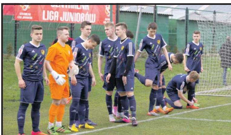
Wychowankowie AP TOP-54 grają m.in. w Legii Warszawa, Queens Park Rangers czy w Ruchu Chorzów

Te kluby i stowarzyszenia, które korzystały czy też obecnie korzystają z środków programu mają na swoim koncie sukcesy nie tylko na regionalnych are-