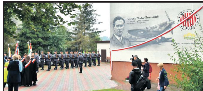
Kolejny podlaski mural odsłonięty staraniem Fundacji „Kocham Podlasie”

Uroczystości zainaugurowała msza święta, po której zgromadzeni udali się pod budynek Gminnego Ośrodka Kultury, gdzie odsłonięto mural upamiętniający pułkownika; kolejny, który powstał na Południowym Podlasiu stara-