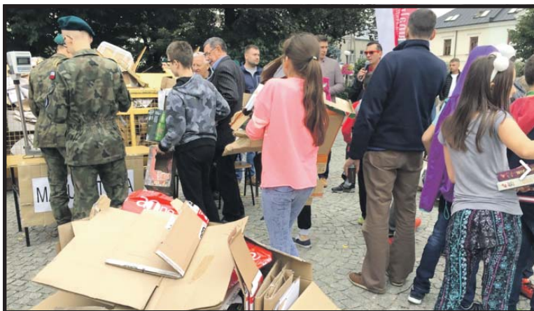
Kształtowanie postaw ekologicznych, sadzonka drzewka za 5 kg. makulatury, zabawy i konkursy, ciepły posiłek – to zwyczajowe akcenty Makulatury na drzewo

W kategorii szkół podobnie jak przed rokiem najskrętniejszymi zbieraczami okazały się dzieci ze Szkoły Podstawowej nr 4, które zebrały 7 158 kg. To prawie dwukrotnie więcej od zdobywcy II miejsca – Zespołu Szkół Ogólnokształ-