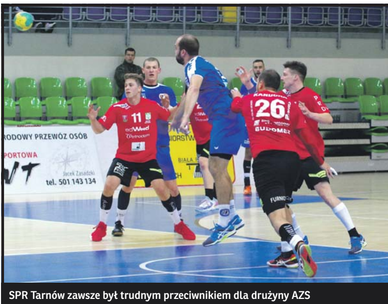
SPR Tarnów zawsze był trudnym przeciwnikiem dla drużyny AZS

AZS AWF: Adamiuk, Chmurski – Wołyncew 7, Warmijak 5, Bekisz 4, Stefaniec 3, Kandora 2, Małecki 2, Ziółkowski 2, Kruczkow 1, Banaś 1, Nowicki, Urbaniak