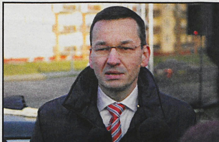
Wicepremier i minister rozwoju Mateusz Morawiecki szacuje, że do 2027 roku nakłady inwestycyjne w Polsce zwiększą się do 117, 2 mld zł

Powtarzam, że pora już realizować budowę własnych fabryk. Polacy powinni ścigać kapitał zagraniczny, ale powinni zacząć budować nowoczesne fabryki –