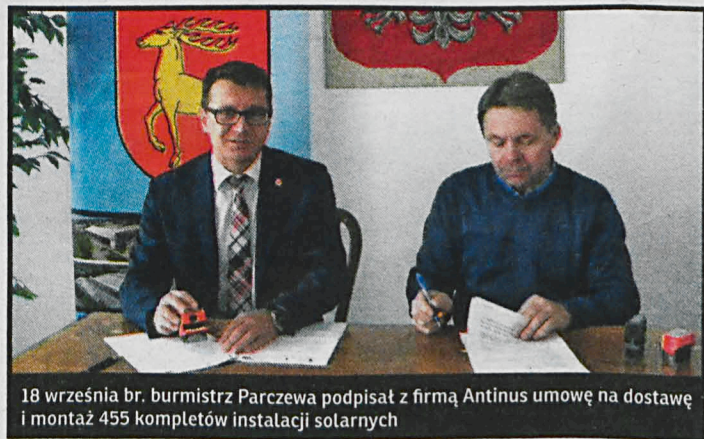
18 września br. burmistrz Parczewa podpisał z firmą Antinus umowę na dostawę i montaż 455 kompletów instalacji solarnych

Wykonawca kontaktować się będzie z mieszkańcami telefonicznie lub osobiście, a przedstawiciele firmy posiadać powinni oryginalne upoważnienie udzielone przez Burmistrza Parczewa. W umowie pomiędzy Gminą Parczew a firmą Antinus nie ujęto robót niekwalifikowanych (nieobjętych dotacją ani wpłatą mieszkańca) m.in. podłączenie drugiej węzłownicy i pompy obiegowej do pieca c.o., montaż grzałki elektrycznej. W trakcie robót instalacyjnych istnieje możliwość wykonania tych prac we własnym zakresie lub zlecenia ich w/w firmie. W takim przypadku zostanie załączony cennik (wraz z harmonogramem) za wykonanie poszczegól-