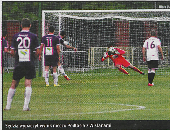
Sędzia wypaczył wynik meczu Podlasia z Wiślanami