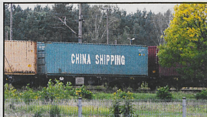
Z Międzynarodowego Urzędu Wymiany (IOE) w Małaszewiczach chińskie przesyłki trafiać będą do 30 krajów Europy