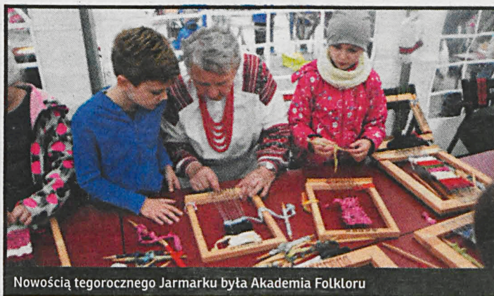
Nowością tegorocznego Jarmarku była Akademia Folkloru

W tym roku nowością na Jarmarku była Letnia Akademia Folkloru, podczas której dzieci i młodzież poznawali ginące zawody, dawne gry, zabawy i tańce ludowe. Można było uczestniczyć w zajęciach obróbki lnu, garncarstwa, hafciarstwa, tkactwa, wyplatania postoiów, dawnego prania i maglowania oraz przedzenia. Dzieci chętnie próbowały swoich sił w nauce tańców ludowych. Na zakończenie imprezy Zespół Obrzędowo-Śpiewaczy „Lewkowanie” z Dokudowa zaprezentował widowisko o dawnej obróbce lnu. Kiermaszowi towarzyszyły występy folklorystyczne. Na scenie zaprezentowali się m.in. zespół Podlasiacy, Kapela Zdzisława Marczuka, Sokotuchy