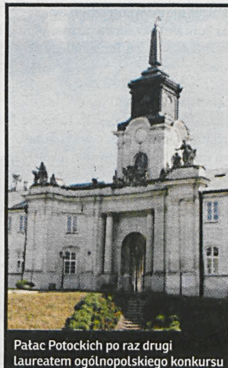
Pałac Potockich po raz drugi laureatem ogólnopolskiego konkursu