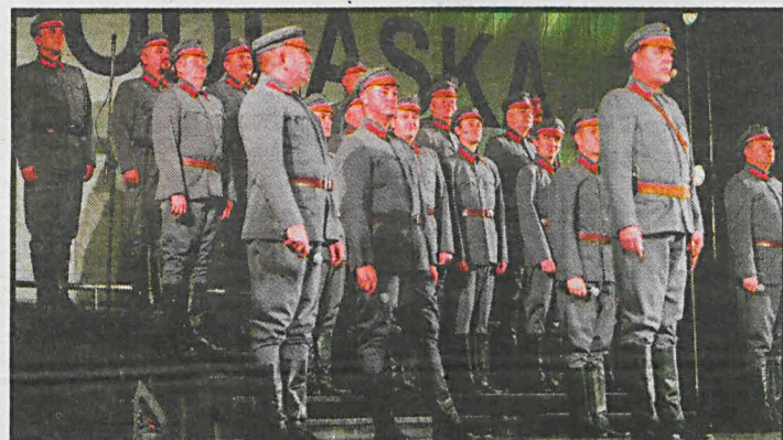
Widowisko Zespołu Artystycznego WP obejrzało ponad 3,5 tys. białczan