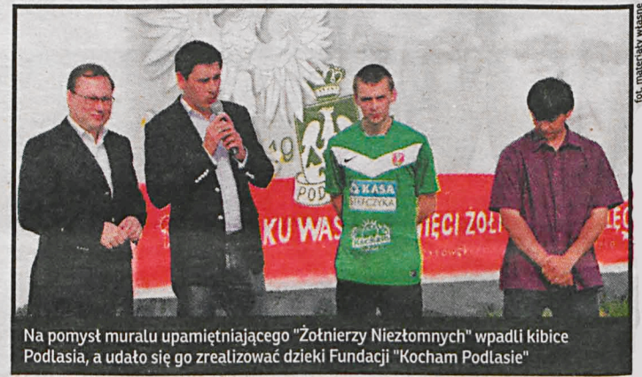
Na pomysł muralu upamiętniającego „Żołnierzy Niezłomnych” wpadli kibice Podlasia, a udało się go zrealizować dzięki Fundacji „Kocham Podlasie”

W niedzielę 8 października o godz. 14.30 odsłonięty zostanie odnowiony, a w zasadzie odtworzony mural przy ul. Ks. Z. Bienkowskiego. Na pomysł muralu, pierwszego na Południowym Podlasiu upamiętniającego „Żołnierzy Wykłych”, wpadli bialscy kibice, a dzięki Fundacji senatora Grzegorza Biereckiego, udało się go urzeczywistnić 2 maja 2012 r. Na obecnie odtworzonym i powiększonym widnieją podobnie jak