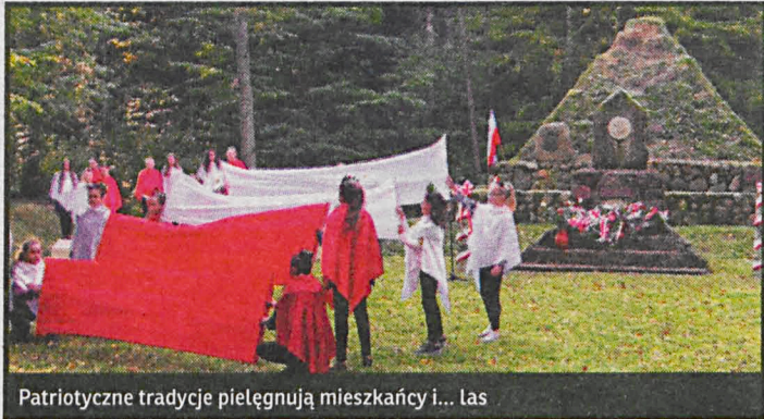
Patriotyczne tradycje pielęgnują mieszkańcy i... las

Zorganizowany w brzozowickim lesie „Dzień z Historią” uświetnił 80 rocznicę usypania przez mieszkańców Kopca Piłsudskiego oraz 150-rocznicę urodzin Marszałka.