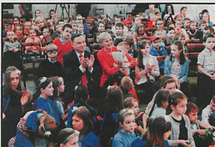
31-osobowa grupa małych białczan spędziła tegoroczny Dzień Dziecka w pałacu prezydenckim. 8 marca przyszłego roku Pierwsza Dama odwiedzi Białą Podlaską

Projekty realizowane przez Stowarzyszenie Biała Pozytywka zaangażują dzieci, młodzież szkolną, dorosłych i seniorów. Społeczeństwo składa się z ludzi w różnym wieku. Ideałem byłoby,