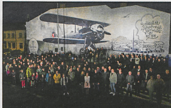
W sobotę odsłonięto mural na ścianie kamienicy "Pod Wieszcami", po czym trzy pokolenia białczan uczestniczyły w nightskatingu

Centrum niedzieli 1 było wmurowanie kamienia węgielnego pod powstającą kościół pod wezwaniem św. Michała Archanioła. Kamień to fragment skały z włoskiego sanktuarium w Gargano, który został wmurowany w jedną ze ścian świątyni. Razem z nim umieszczono tam też akt upamiętniający budowę kościoła, który podpisali m.in. pre-