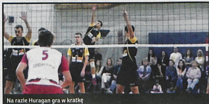
Na razie Huragan gra w kratkę