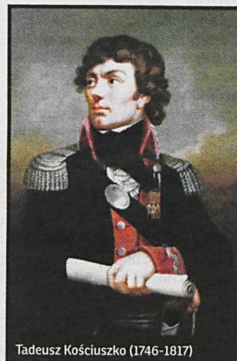
Tadeusz Kościuszko (1746-1817)

Mimo przegranej Kościuszki naród czci w nim nie pobitego wodza, ale symbol moralnego zwycięstwa. Od 1794 roku chłop polski, który na ogół miał słabe pojęcie o Kircholmie, Chocimiu czy Wiedniu, zaczął w swej izbie wieszać portrety Naczelnika, gdyż on właśnie uosabiał jego żywotne interesy oraz nadzieje społeczne i narodowe. Naczelnikiem Państwa był po ponad stu lata