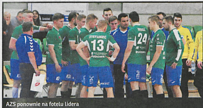
AZS ponownie na fotelu lidera