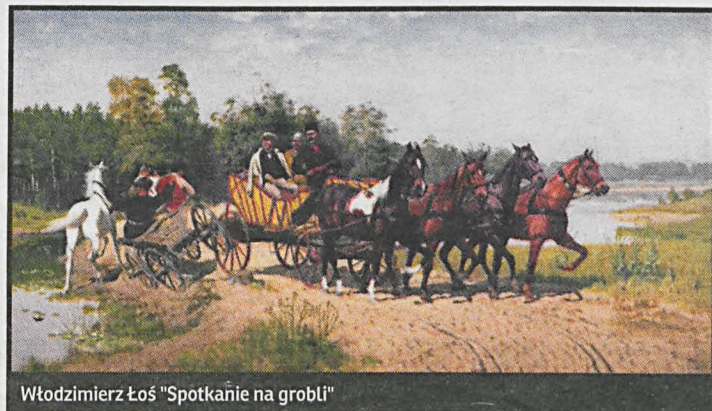
Włodzimierz Łoś "Spotkanie na grobli"

W czasach kiedy istniało jeszcze województwo białskopodlaskie, rocznie udawało się kupić na aukcjach i w antykariatach ok. 10 dzieł sztuki, choć zdobycie ich było bardzo trudne. Obecnie obrazy są dostępniejsze, jednak przeszkodą jest brak środków. Dzieło