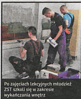
Po zajęciach lekcyjnych młodzież ZST szkoli się w zakresie wykańczania wnętrz

Nauczyciele tych mogą zaś uczestniczyć w studiach podyplomowych oraz specjalistycznych kursach. Od października nauczyciele międzyryckiego ZST odbywają na Politechnice Warszawskiej studia podyplomowe „Automatyka oraz Mechatronika w Kształceniu Zawodowym”, a nauczyciele „Ekonomika” – kursu języka angielskiego w nauczaniu