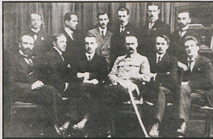
17 listopada 1918 r. Józef Piłsudski utworzył pierwszy rząd RP

A co nas czeka jutro? Biała Podlaska, Radzyń, Parczew, Terespol, Domaszewnica, Borki, Podedwórze, Krzewica, Milanów, Rokitno... Trudno wymienić wszystkie miejscowości, gdzie odbędą się oficjalne obchody narodowego święta. Towarzyszyć im będą inne wydarzenia kulturalne i sportowe. Już dzisiaj wieczorem w Radzynie zapłoną „Ognie Niepodległości”, wcześniej w Parczewie odbędzie się Bieg, a w niedzielę w Czemiernikach – Marsz Niepodległości. W Białej Podlaskiej cykl 4-dniowych imprez otworzy dzisiaj koncert laureatów Międzyszkolnego Konkursu Piosenki Patriotycznej, a zakończy w środę biesiada koncertowa piosenki biesiadno-patriotycznej. W sobotę w auli AWF o godz. 18 rozpocznie się galowy koncert „Warto być Pola-