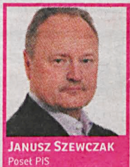
JANUSZ SZEWCZAK Posel PIS

stać się znaczącym graczem na arenie międzynarodowej, ze względu na swą stabilną sytuację finansową i gospodarczą. Polskie mamy obowiązki i zamierzamy im sprostać.