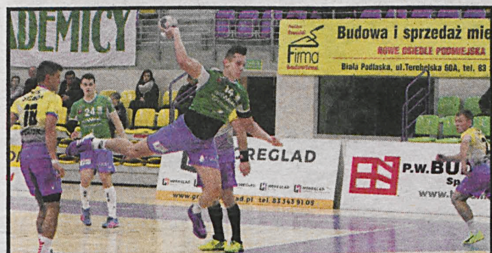
Akademicy rzucili prawie dwukrotnie więcej bramek niż MTS Chrzanów