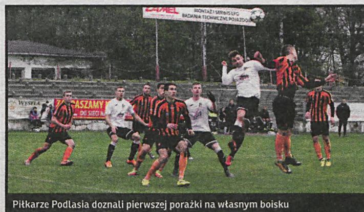
Piłkarze Podlasia doznali pierwszej porażki na własnym boisku