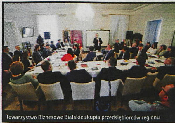
Towarzystwo Biznesowe Białskie skupia przedsiębiorców regionu