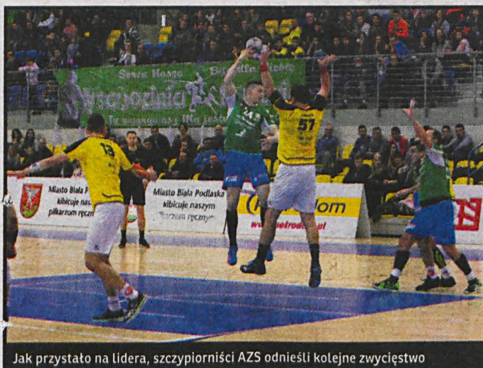
Jak przystało na lidera, szczypiornicy AZS odnieśli kolejne zwycięstwo