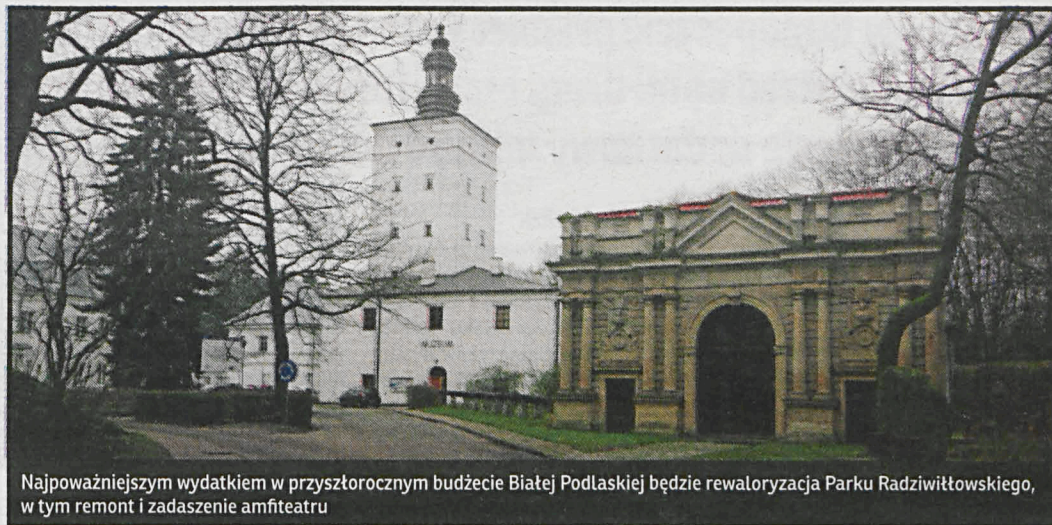
Najpoważniejszym wydatkiem w przyszłorocznym budżecie Białej Podlaskiej będzie rewaloryzacja Parku Radziwiłłowskiego, w tym remont i zadaszenie amfiteatru

Kolejnymi przedsięwzięciami będą: utworzenie filii żłobka „Skarbiec Skrzata” (1,4 mln zł), modernizacja i doposażenie warsztatów szkolnych (4 mln