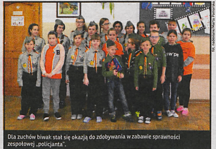
Dla zuchów biwak stał się okazją do zdobywania w zabawie sprawności zespołowej „policjanta”.