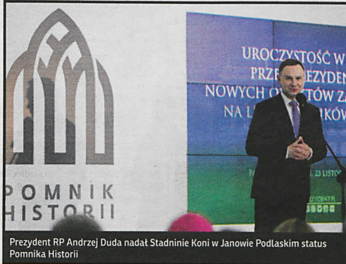
Prezydent RP Andrzej Duda nadał Stadninie Koni w Janowie Podlaskim status Pomnika Historii

23 listopada status Pomnika Historii otrzymały: „Ciechocinek – zespół tężni i warzelnia soli wraz z Parkiem Tężniowym oraz Parkiem Źródłowym”, „Gdańsk-Oliwa – zespół pocystersko-katedralny”, „Gościkowo-Paradyż – pocysterski zespół klasztorny”, „Grudziądz – zespół zabytkowych spichlerzy wraz z panoramą od strony Wisły”, „Janów Podlaski – Stadnina Koni”, „Kielce – dawny Pałac Biskupów i Katedra”, „Kraków – Kopicie Kościuszki z otoczeniem”, „Nieborów i Arkadia – zespół pałacowo-ogrodowy i ogród sentymentalno-romantyczny”, „Radruż – zespół cerkiewny”, „Sandomierz – historyczny zespół architektoniczno-krajobrazowy” i „Szalowa – Kościół parafialny pw. św. Michała Archanioła”. Ponadto istniejący już Pomnik Historii „Katowice – Gmach Województwa i Sejmu Śląskiego” został