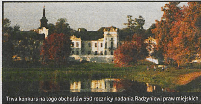
Trwa konkurs na logo obchodów 550 rocznicy nadania Radzyniowi praw miejskich

W przyszłym roku Radzyń Podlaski będzie fetował jubileusz 550 lat nadania praw miejskich. Radzyński Ośrodek Kultury ogłosił konkurs na logo, które stanie się oficjalną identyfikacją graficzną Miasta w trakcie obchodów.