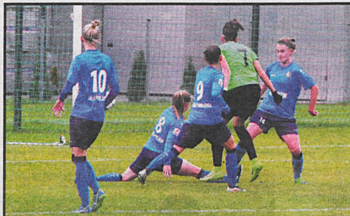
Dziewczyny z AZS PSW okazałym zwycięstwem pożegnały piłkarską jesień

Bialczanie rozegrali test mecz z Huraganem Miedzyrzec Podlaski, remisując 2:2. Wystąpiło w nim jedenastu pretendentów do gry w Podlasiu. Część z tej grupy już pożegnała z zespołem, część dostanie kolejną szansę w następnych sparingach.