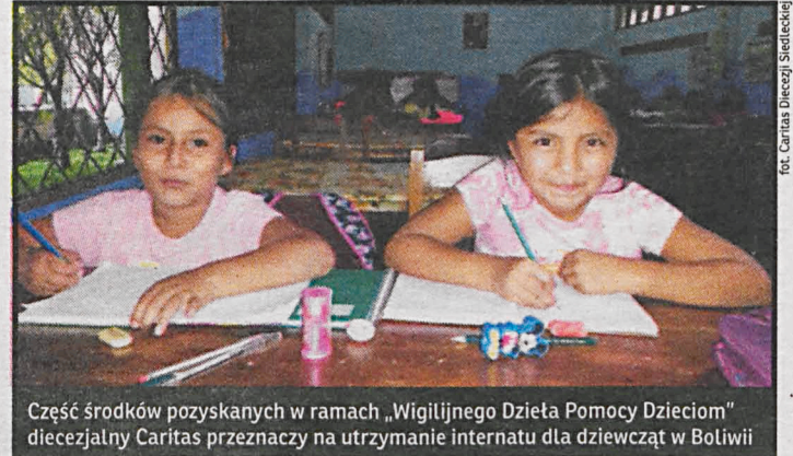
Część środków pozyskanych w ramach „Wigilijnego Dzieła Pomocy Dzieciom” diecezjalny Caritas przeznaczy na utrzymanie internatu dla dziewcząt w Boliwii