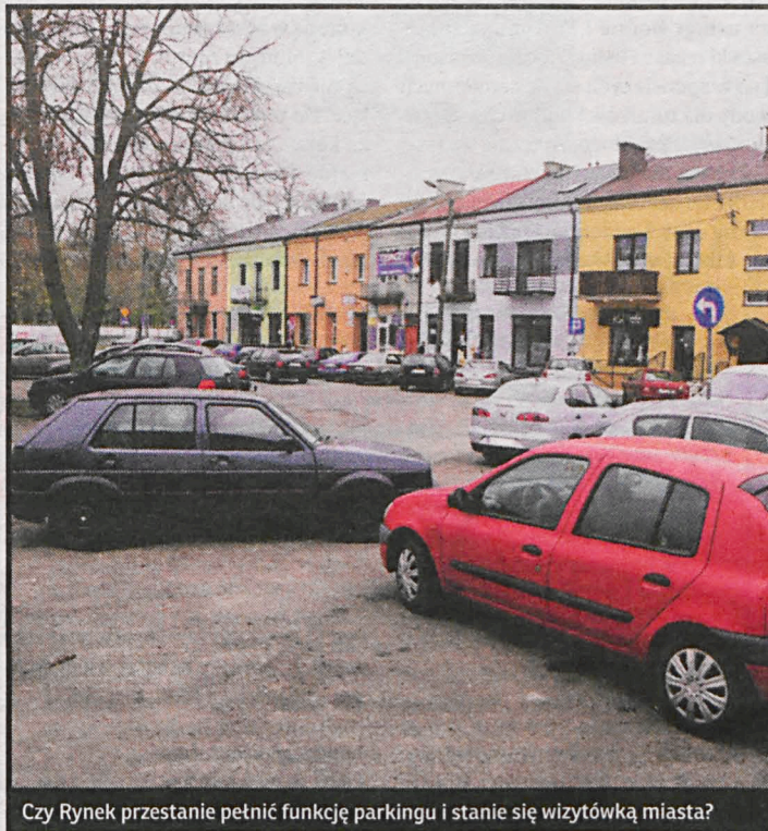
Czy Rynek przestanie pełnić funkcję parkingu i stanie się wizytówką miasta?

Czynione przez radzyński samorząd, od przejęcia na własność pałacu w 2015 r., starania na rzecz przywrócenia mu dawnego blasku, polegające na konserwacji a także adaptacji wnętrza na potrzeby działalności społeczno-kulturalnej i edukacyjnej, nawiązują do najlepszych tradycji tego miejsca – pisze Magdalena Gawin, podkreślając swoje poparcie dla inicjatyw służących poprawie stanu tak wartościowego pod względem historycznym i artystycznym obiektu jak kompleks pałacowy w Radzynie Podlaskim.