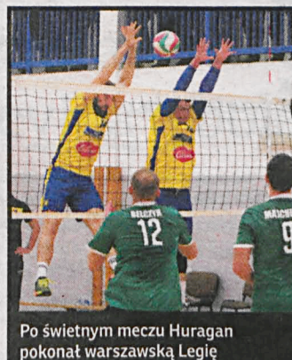
Po świetnym meczu Huragan pokonał warszawską Legię

Jak burza w III lidze idą zawodnicy AZS AWF Biała Podlaska. Wygrali po raz kolejny, tym razem w Nałęczowie 3:1, i jako jedyna niepokonana ekipa w lidze samodzielnie przewodzą stawce. W najbliższy weekend akademicy zmierzą się u siebie z MKS-em Kraśnik.