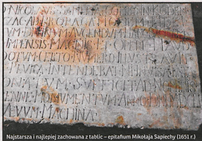
Najstarsza i najlepiej zachowana z tablic – epitafium Mikołaja Sapiechy (1651 r.)

Cztery lub pięć: są potłuczone. W kurii przechowywana jest pochodząca z 1723 r księga zawierająca inwentarz Sanktuarium Kodeńskiego, w której wymienione są te epitafijne tablice z łacińskimi inskrypcjami, a także ich treść. Trzeba będzie je poskładać jak puzzle, ale zdaniem specjalistów – nie sprawi to trudności. Najlepiej zachowaną jest tablica epitafijna z 1651 r. Mikołaja Sapiechy, za sprawą którego wizerunek Matki Bożej Kodeńskiej znalazł się na Podlasiu. Przed wywiezieniem z Kodnia znajdowała się ona nad wejściem