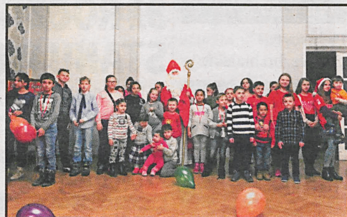
W przedświąteczne dni dzieci odwiedza św. Mikołaj

Przedszkolaki, młodzież szkolna i seniorzy śpiewać będą kolędy. Grupy taneczne zaprezentują ciekawe programy. Studenci PSW przygotowali konkursy oraz animacje.