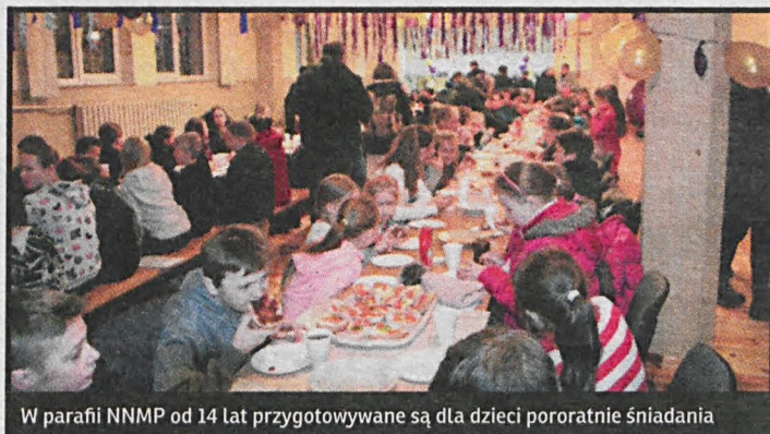
W parafii NNMP od 14 lat przygotowywane są dla dzieci poratnie śniadania