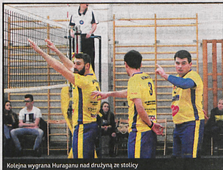
Kolejna wygrana Huraganu nad drużyną ze stolicy