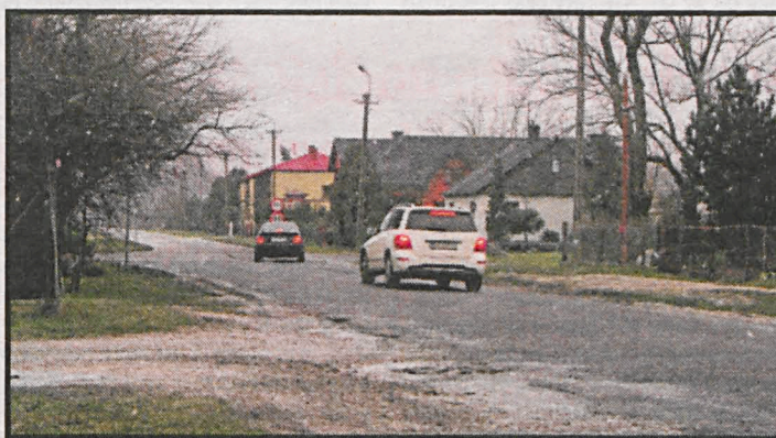
Będzie kompleksowa przebudowa drogi Ciczibór - Leśna Podlaska. Na dwóch białskich skrzyżowaniach m.in. ul. Terebelskiej z krajową „dwójką” powstaną dwupasmowe ronda

Prawie 10 mln zł uzyskały ramach Programu Współpracy Transgranicznej Polska-Białoruś-Ukraina na lata 2014-2020 również miasta Biała Podlaska i Brześć. Za środki z Europejskiego Instrumentu Sąsiedztwa w Białej Podlaskiej przebu-