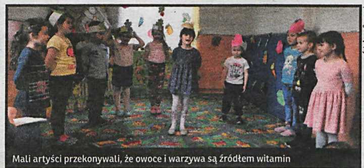
Mali artyści przekonywali, że owoce i warzywa są źródłem witamin