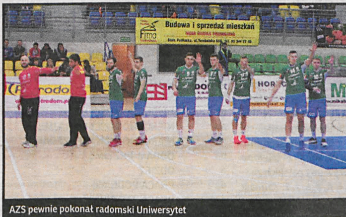
AZS pewnie pokonał radomski Uniwersytet

sytetem Radom 38:19 i wrócili na fotele lidera I ligi grupy B. Mecz z radomską ekipą można śmiało nazwać egzekucją. Przed szczypiornistami przerwa świą-