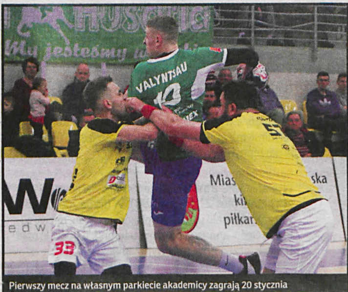
Pierwszy mecz na własnym parkiecie akademicy zagrają 20 stycznia