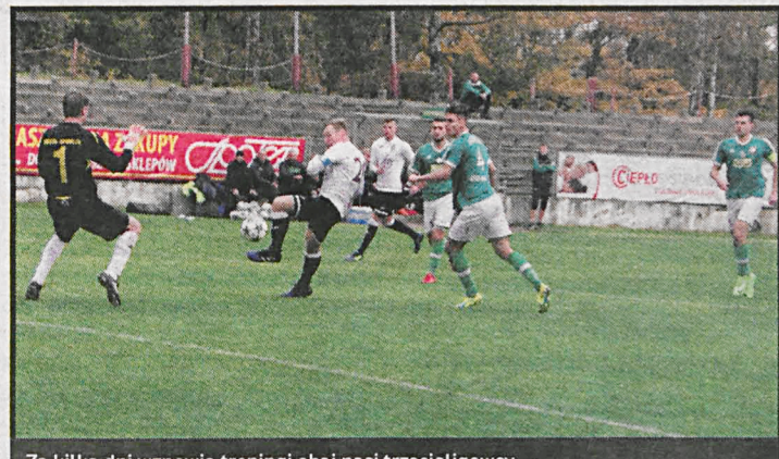
Za kilka dni wznawiają treningi obaj nasi trzeciolicowcy