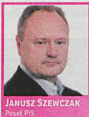
JANUSZ SZEWCZAK Posłanek PiS