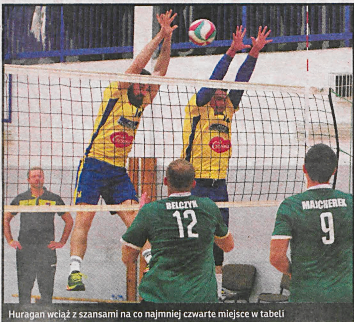
Huragan wciąż z szansami na co najmniej czwarte miejsce w tabeli

Międzyrzeczanie wciąż mają szansę na zajęcie 4 miejsca w tabeli, które pozwoliłoby im w uprzywilejowanej pozycji w pierwszej rundzie play-offów.