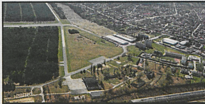
Wiosną Edwood rozpocznie na terenie bialskiej podstrefy budowę zakładu produkcji półfabrykatów oraz komponentów meblowych

Bialska podstrefa Pomorskiej Specjalnej Strefy Ekonomicznej obejmuje obecnie 94,06 ha terenów znajdujących się na terenie byłego lotniska wojskowego w bezpośrednim sąsiedztwie linii kolejowej E 20 oraz europejskiej trasy drogowej E-30. Firmy, które tu zainwestują, mogą liczyć na zwolnienie z podatku dochodowego – nawet do 70% kosztów kwalifikowanych inwestycji lub dwuletnich kosztów pracy nowo zatrudnionych pracowników.