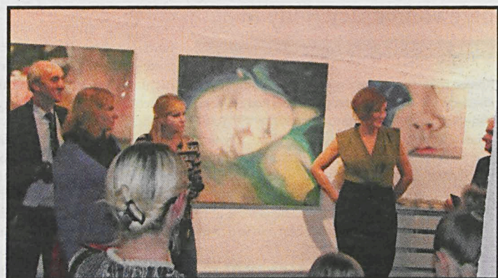
Dzięki warsztatom arteterapii człowiek może lepiej zrozumieć siebie oraz naturę swoich problemów i trudności